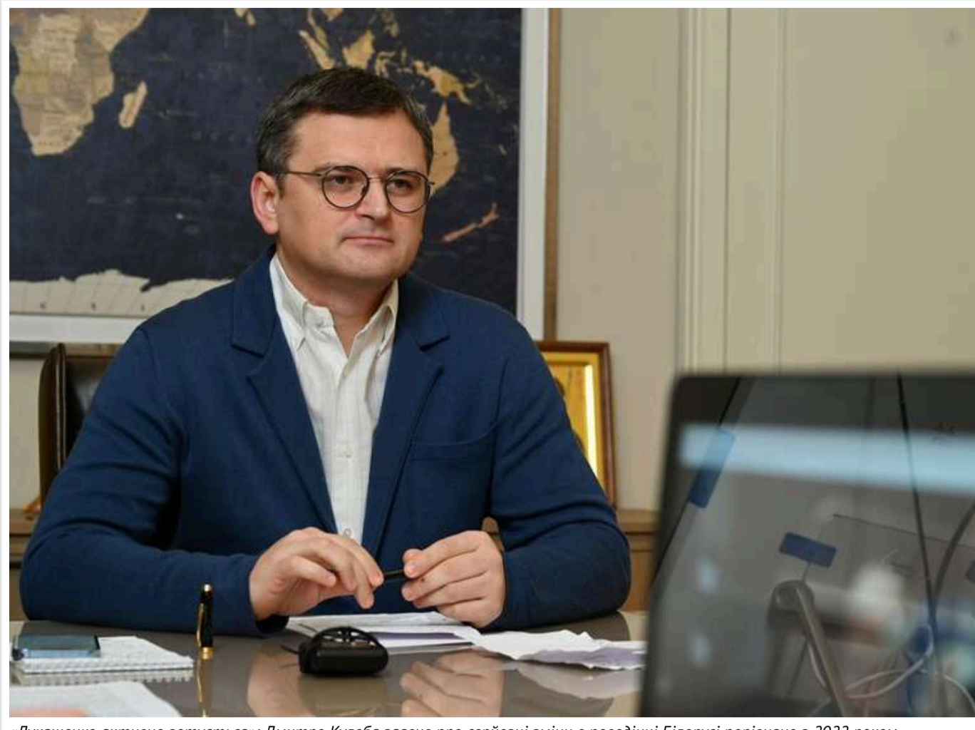
«Лукашенко активно готується»: Дмитро Кулеба заявив про серйозні зміни в поведінці Білорусі порівняно з 2022 роком

Колишній міністр закордонних справ України Дмитро Кулеба в інтерв'ю зазначив, що теперішні дії та риторика Александра Лукашенка суттєво відрізняються від того, що спостерігалось з початку повномасштабного вторгнення у 2022 році.