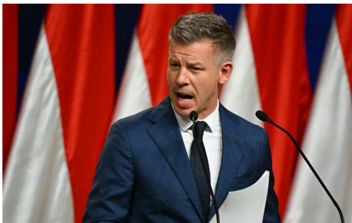
Фото: прем'єр Угорщини Петер Мадяр