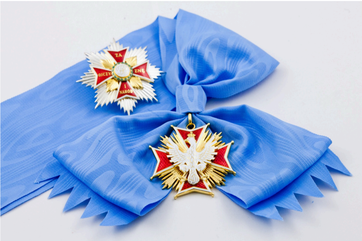
Фото: Орден Білого Орла

Після Другої світової війни вручення ордену було відновлено на підставі Закону про ордени та нагороди від 16 жовтня 1992 року. Перші подання на нагородження формувала Тимчасова рада ордену, до складу якої входили очільники Сейму, Сенату та уряду.