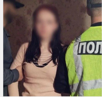
Підсипала метадон: неповнолітня цинічно вбила військового