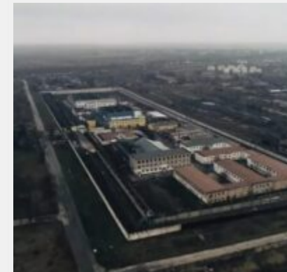
Російські загарбники перетворили Бердянську колонію № 77 на катівню для українців