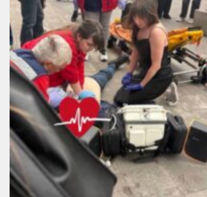
«А МИ ТУТ ПРИ ЧОМУ?». Смертельна відмова за п'ять хвилини від порятунку та ціна байдужості кмітської підземки