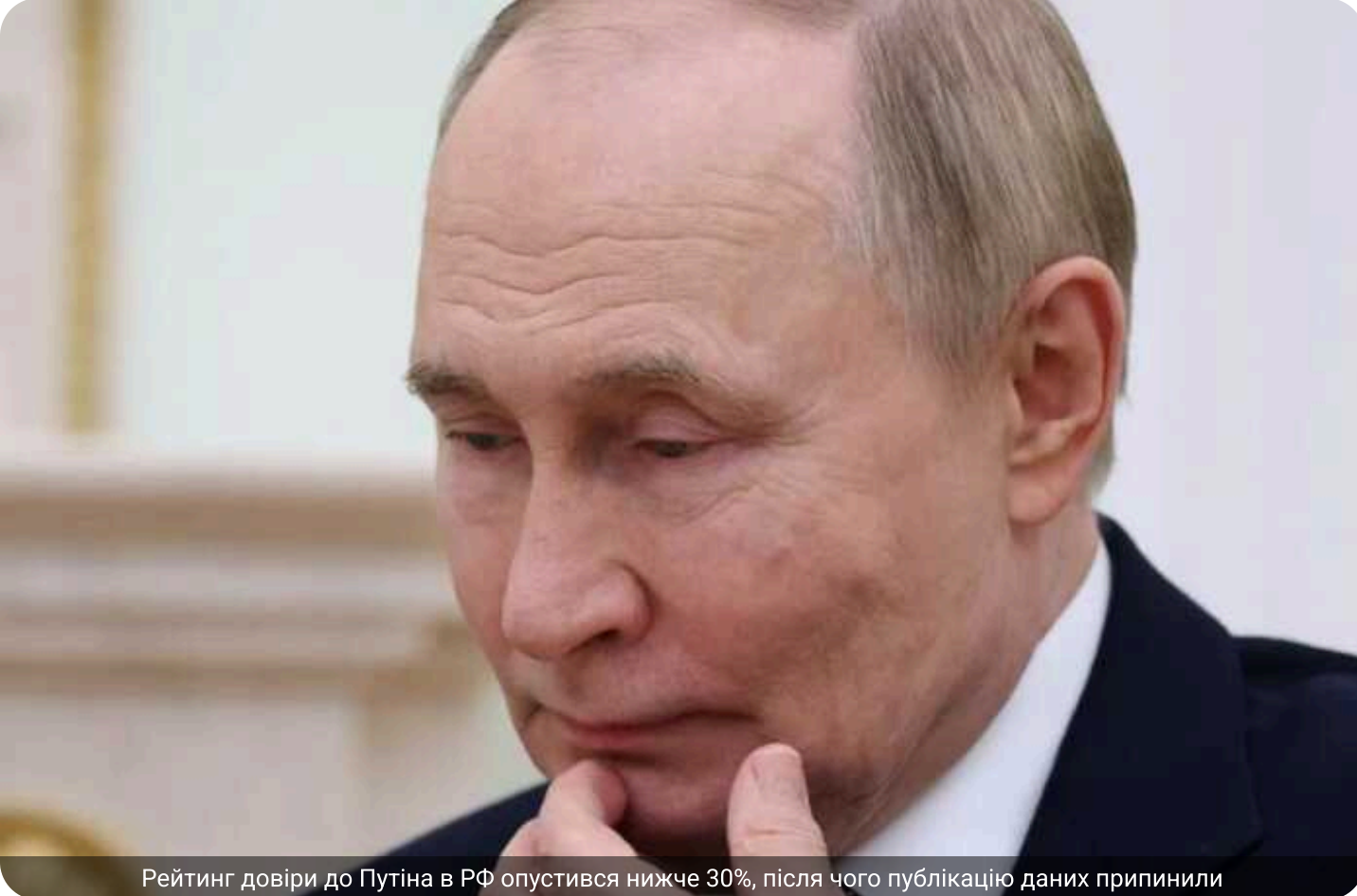
Рейтинг довіри до Путіна в РФ опустився нижче 30%, після чого публікацію даних припинили

Всеросійський центр вивчення громадської думки (ВЦВГД) офіційно призупинив оприлюднення даних про рівень довіри до президента РФ Володимира Путіна. Це рішення було прийняте одразу після того, як результати соціологічних опитувань зафіксували найнижчі показники підтримки глави держави з моменту початку війни Росії проти України.