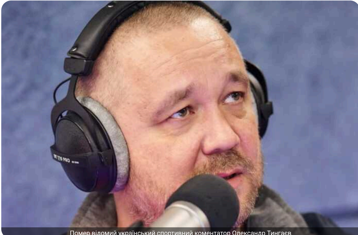
Помер відомий український спортивний коментатор Олександр Тингаєв

У віці 46 років пішов із життя відомий український коментатор та радіоведучий Олександр Тингаєв. Журналіст потрапив до реанімації минулими вихідними після нещасного випадку на риболовлі – він зачепив вудкою високовольтний кабель і отримав потужний удар струмом.