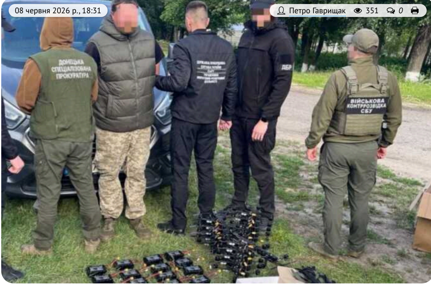
Військовий викрав FPV-дрони "Генерал Черешня" з частини та продав їх

На Донеччині затримали сержанта, який налагодив «бізнес» на війні. Старший бойовий медик роти БпАК вкрав і продав 16 FPV-дронів виробництва «Генерал Черешня». Мародера, що наживався на забезпеченні побратимів, затримали правоохоронці.