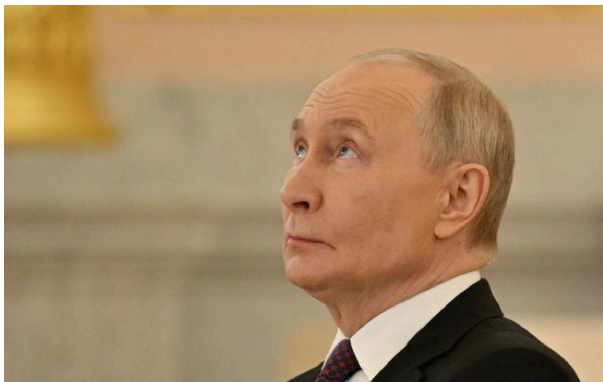
Фото: російський диктатор Володимир Путін (Getty Images)