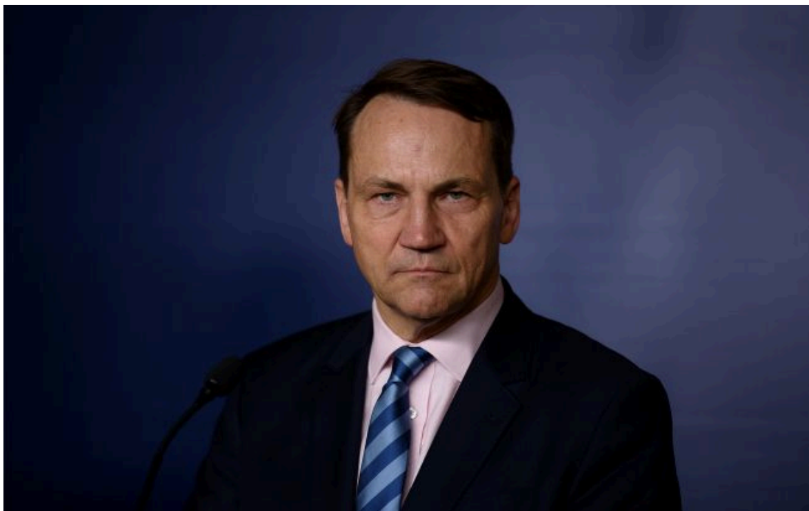
Фото: Радослав Сікорський (Getty Images)

Не витрачай час на шум! Читай тільки суть з РБК-Україна у Google