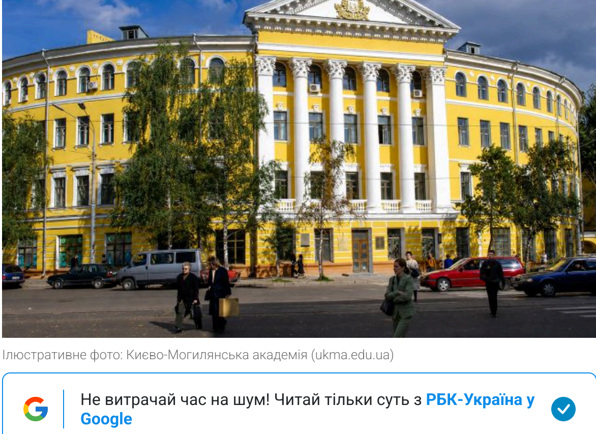
Ілюстраційне фото Києво-Могилянської академії

Не витрачай час на шум! Читай тільки суть з РБК-Україна у Google