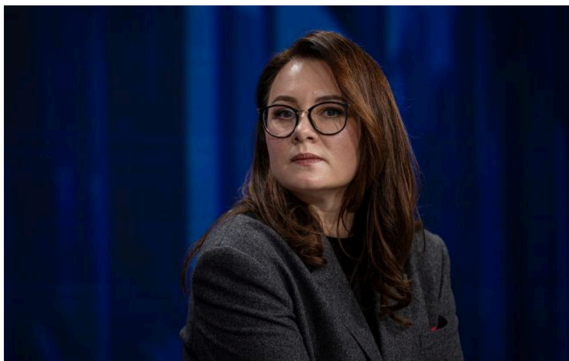
Фото: прем'єр-міністр України Юлія Свириденко (Getty Images)