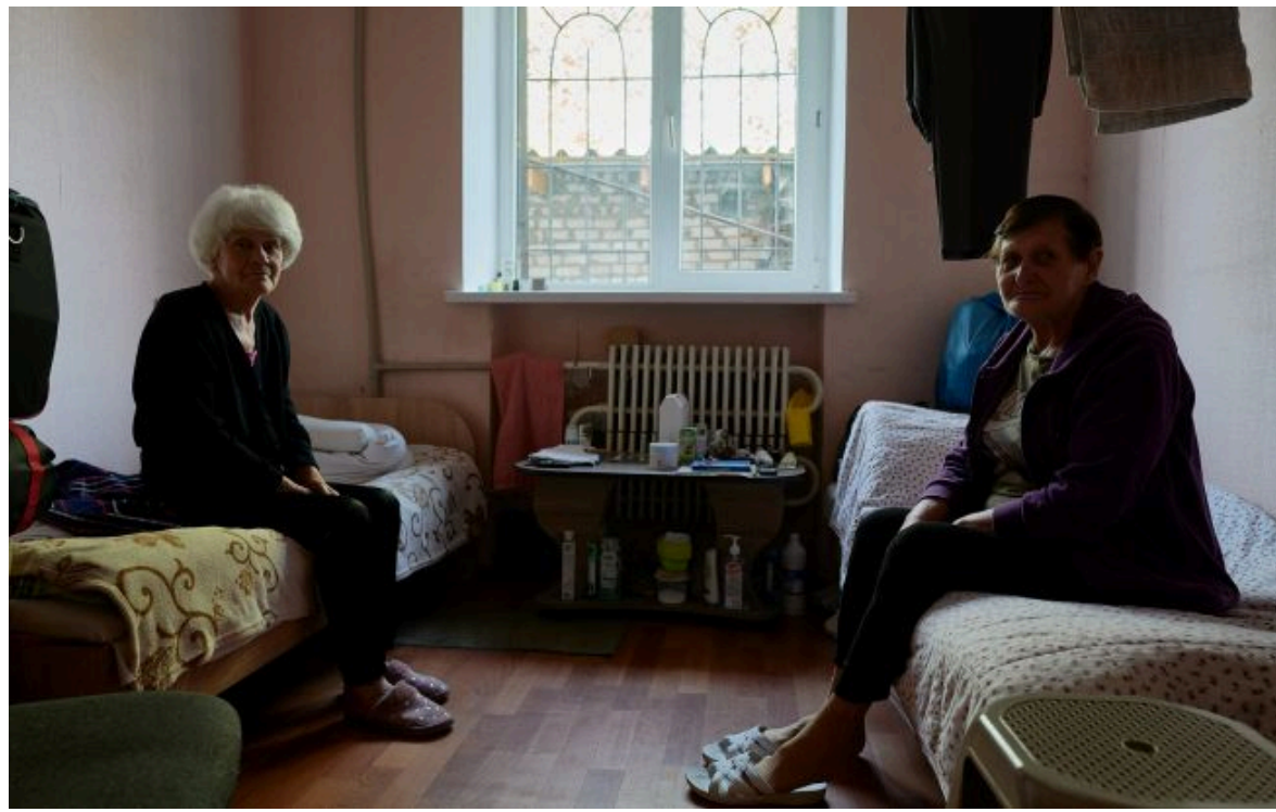
Фото: Уряд посилив захист прав ВПО у місцях тимчасового проживання