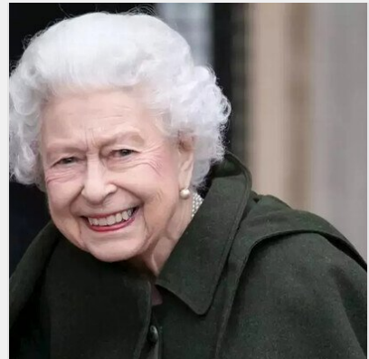
Принцеса Єлизавета могла вийти заміж зовсім не за принца ...