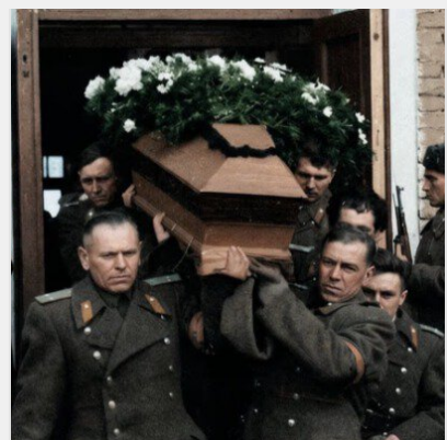
Секретна трагедія СРСР: як у ніч смерті Сталіна у Полтаві ...