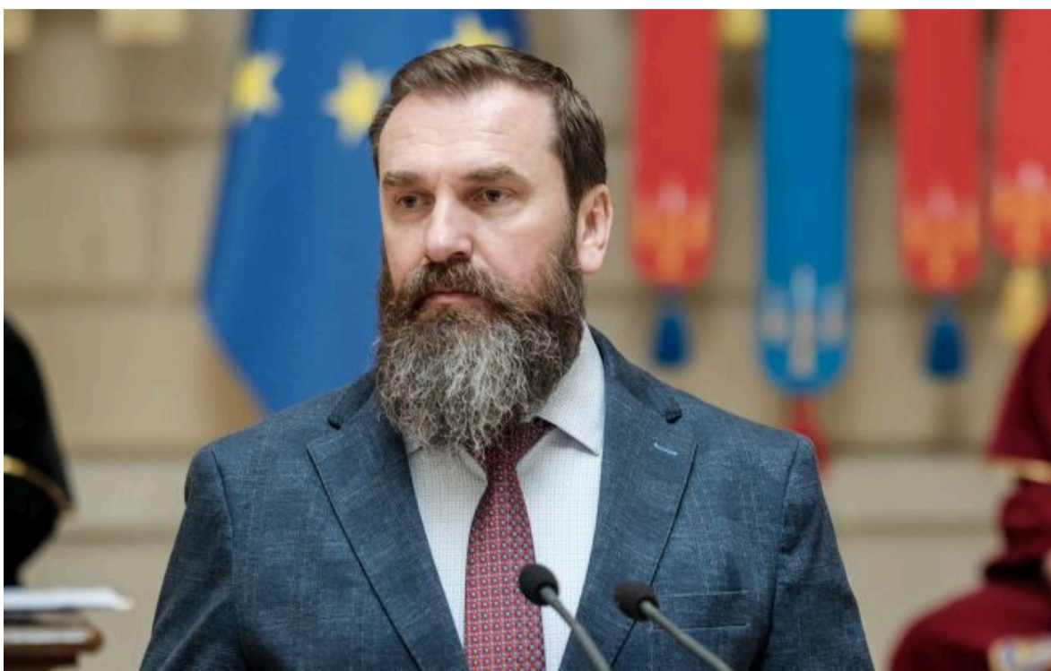
Фото: міністр освіти і науки України Оксен Лісовий

Не витрачай час на шум! Читай тільки суть з РБК-Україна у Google