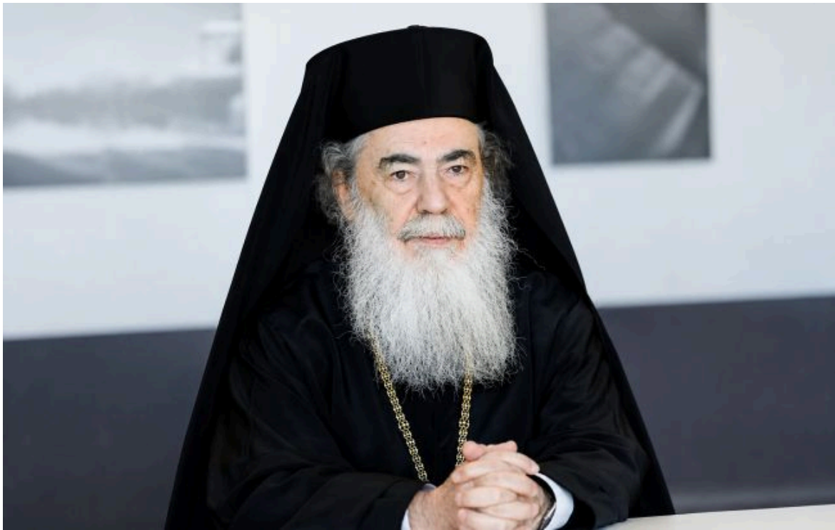
Фото: Патріарх Феодіт III

Не витрачай час на шум! Читай тільки суть з РБК-Україна у Google