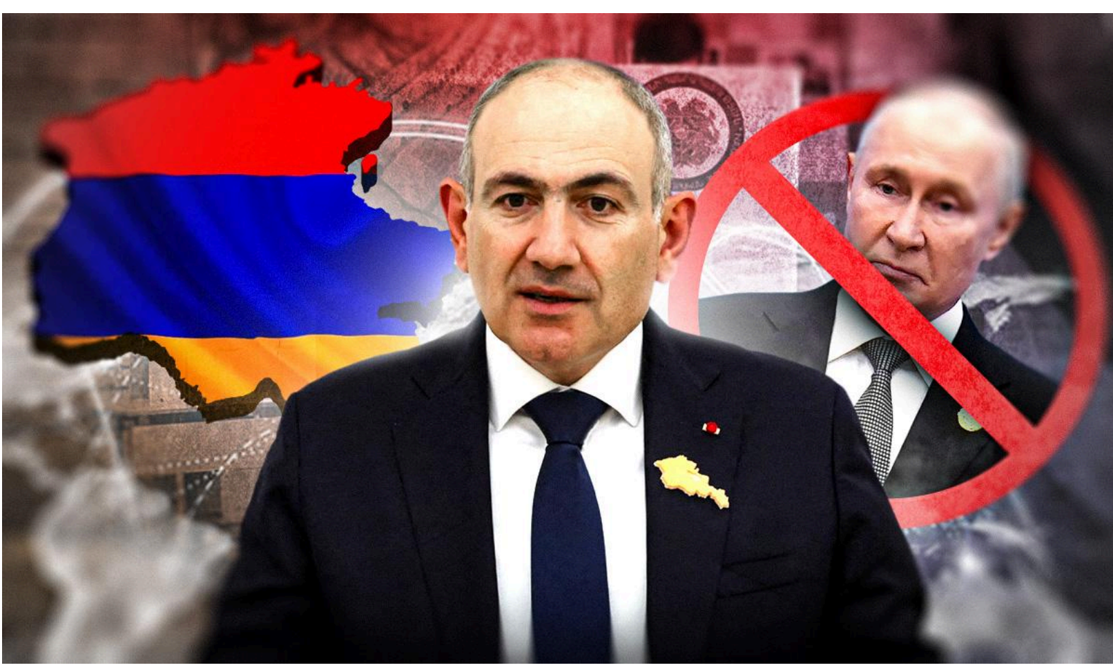
Весь період виборчої кампанії у Вірменії Росія намагалась вплинути на процес