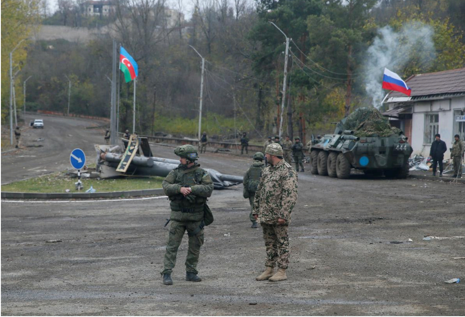
Фактично, Росія завжди створювала в регіоні напруженість

Найближчим ключовим викликом у регіональній політиці Вірменії стане офіційне завершення війни з Азербайджаном. Саме за каденції Пашиняна Єреван офіційно пішов на поступки Баку. Сторони підписали драфт угоди, який передбачає зміни у Конституції Вірменії з відмовою від Карабаху.