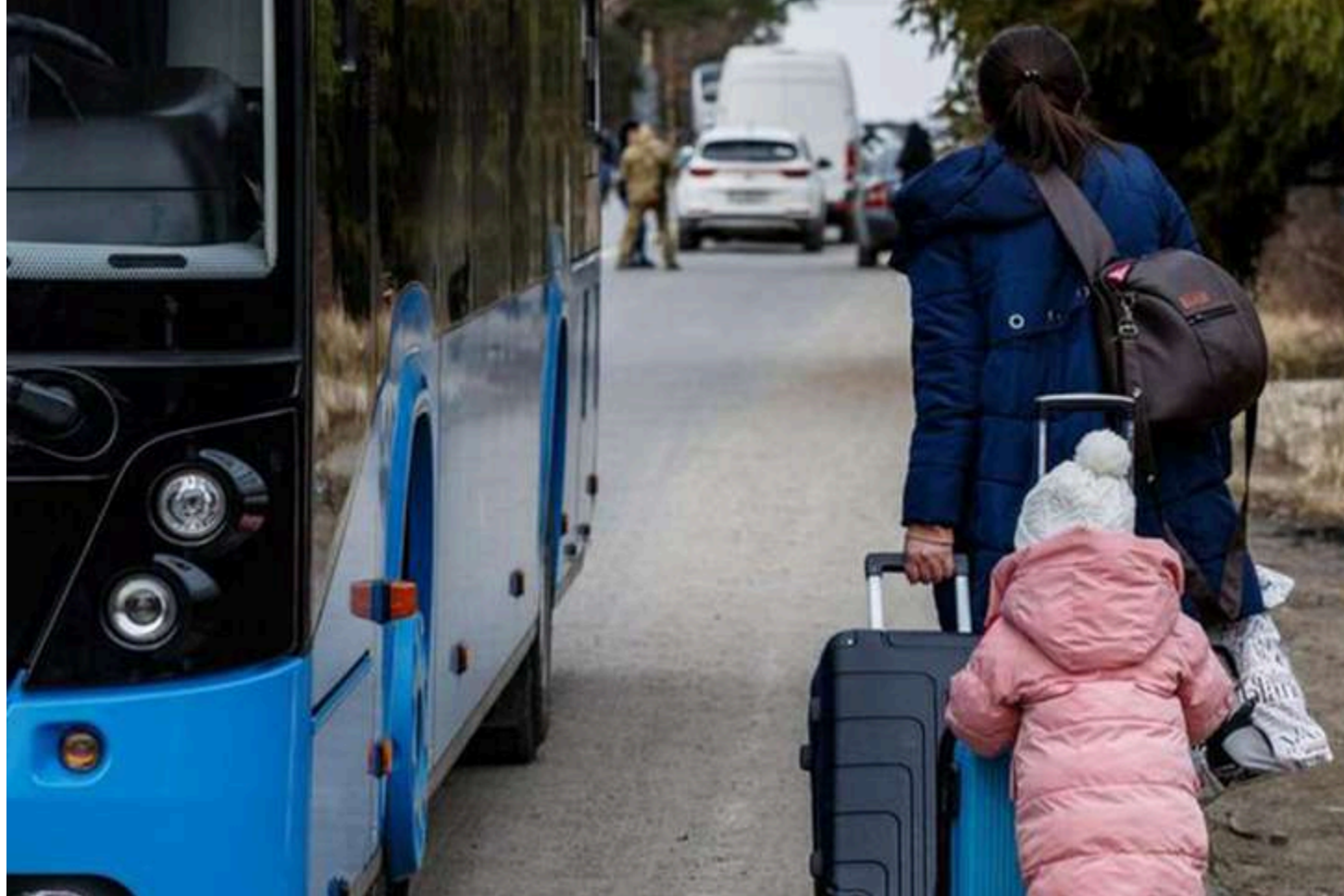
Ілюстративне фото з відкритих джерел

Уряд ухвалив низку рішень щодо посилення соціальної підтримки внутрішньо переміщених осіб та забезпечення житлом дитячих будинків сімейного типу. Про це у Телеграмі повідомила прем'єр-міністр України Юлія Свириденко.