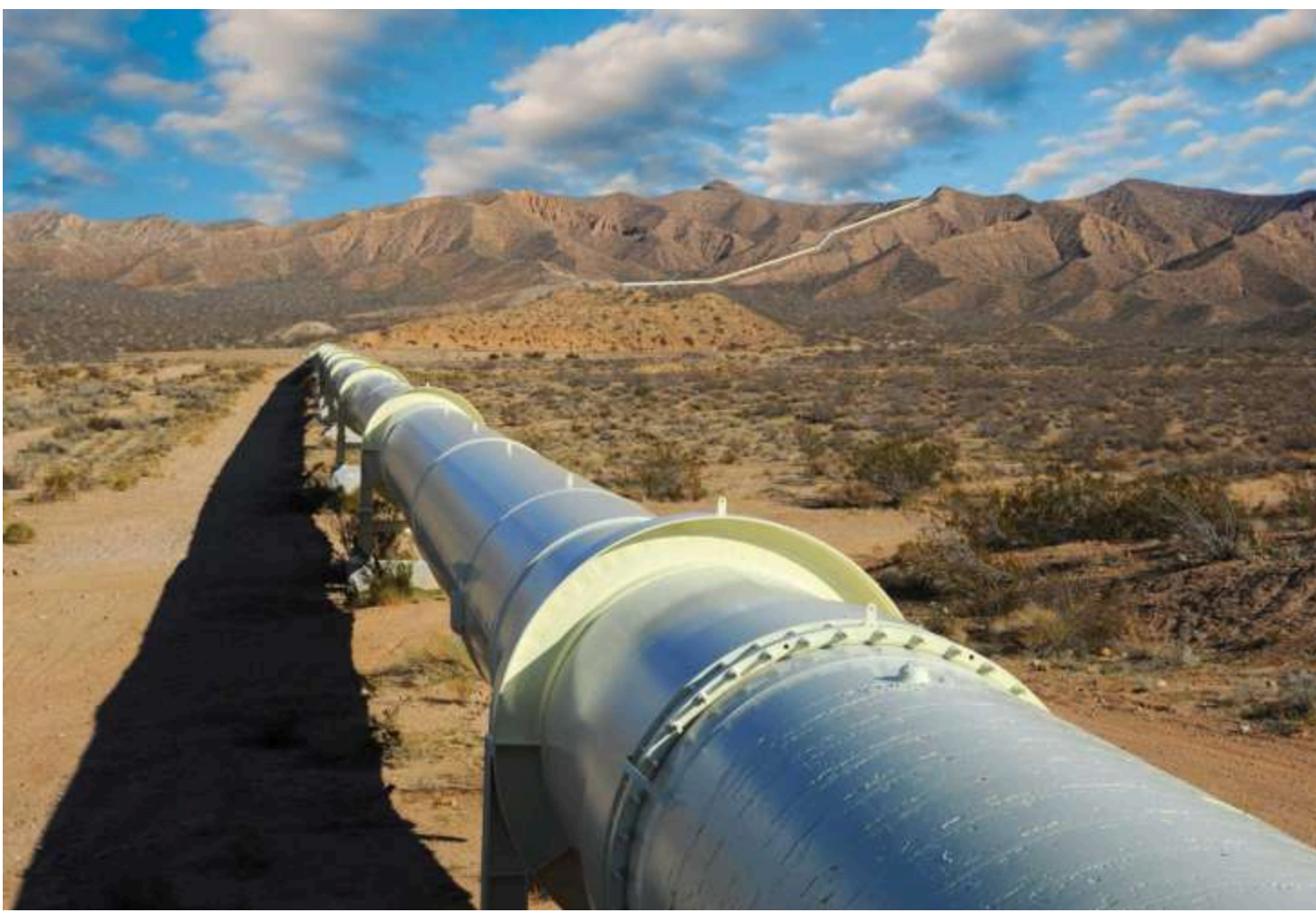
Транссахарський газопровід до ЕС

Три африканські країни - Нігерія, Нігер та Алжир - об'єдналися у проєкті будівництва газопроводу завдовжки 4128 км, який зможе щорічно постачати до Європи до 30 млрд кубометрів природного газу. Проєкт розглядається як альтернатива російським енергоносіям, пише Business Insider Africa .