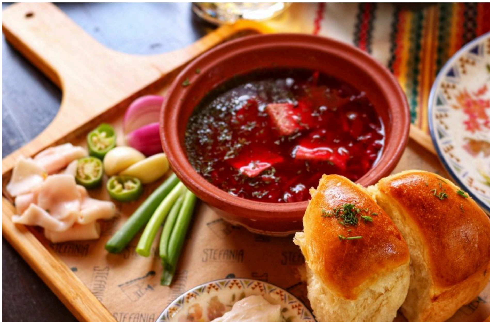
Борщовий набір

КОЛОМІЄЦЬ НАДІЯ — 08 Червня 2026, 15:03 1 Min Read — ГРОШІ