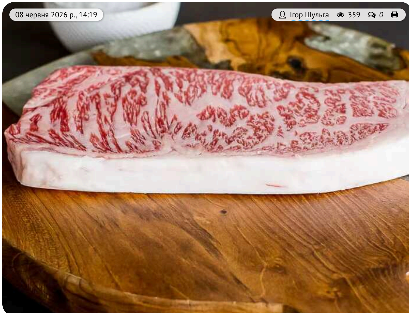
Японська мармурова яловичина вагою в багажнику: у Львові оштрафували водія за контрабанду елітного м'яса

Галицький районний суд м. Львова притягнув до адміністративної відповідальності громадянина України, який намагався таємно везти з-за кордону партію ексклюзивного японського м'яса преміум-класу під виглядом особистих речей.