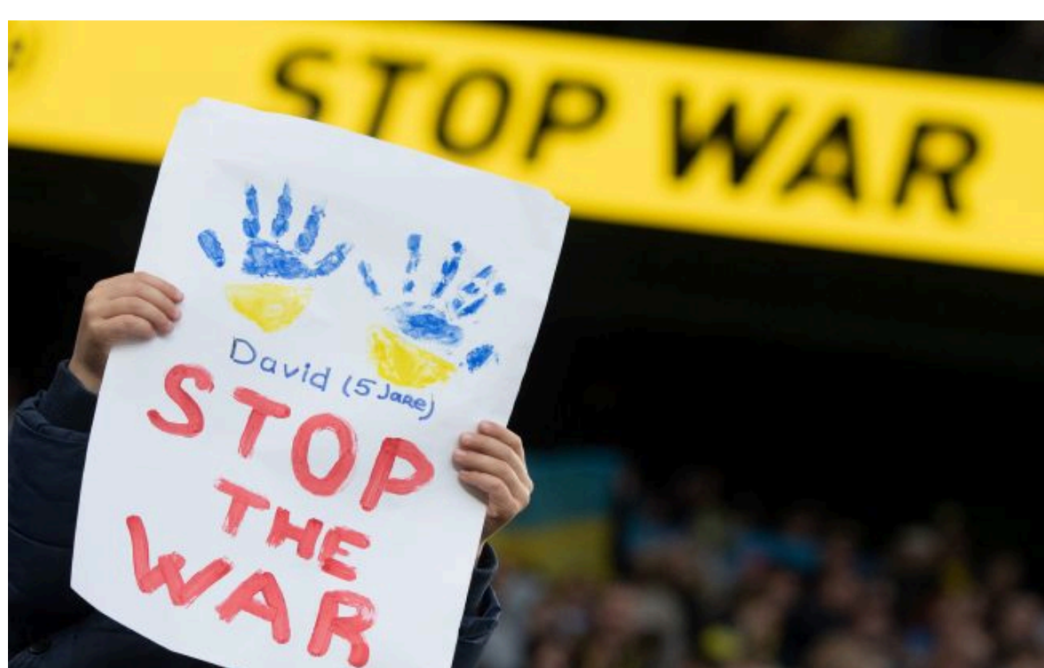
Фото: Опитування КМІС розкрило головну умову перемир'я