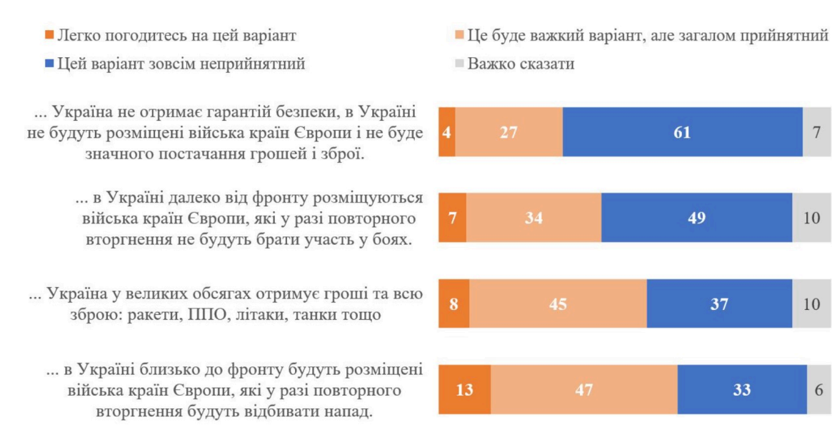
Фото: результати опитування КМІС (kiis.com.ua)

Без жодних гарантій більшість проти. Якщо Україна не отримає ні гарантій безпеки, ні зброї, ні фінансової підтримки - 61% категорично відкидають таке перемир'я. Підтримати готові лише 32%, і то переважно неохоче.