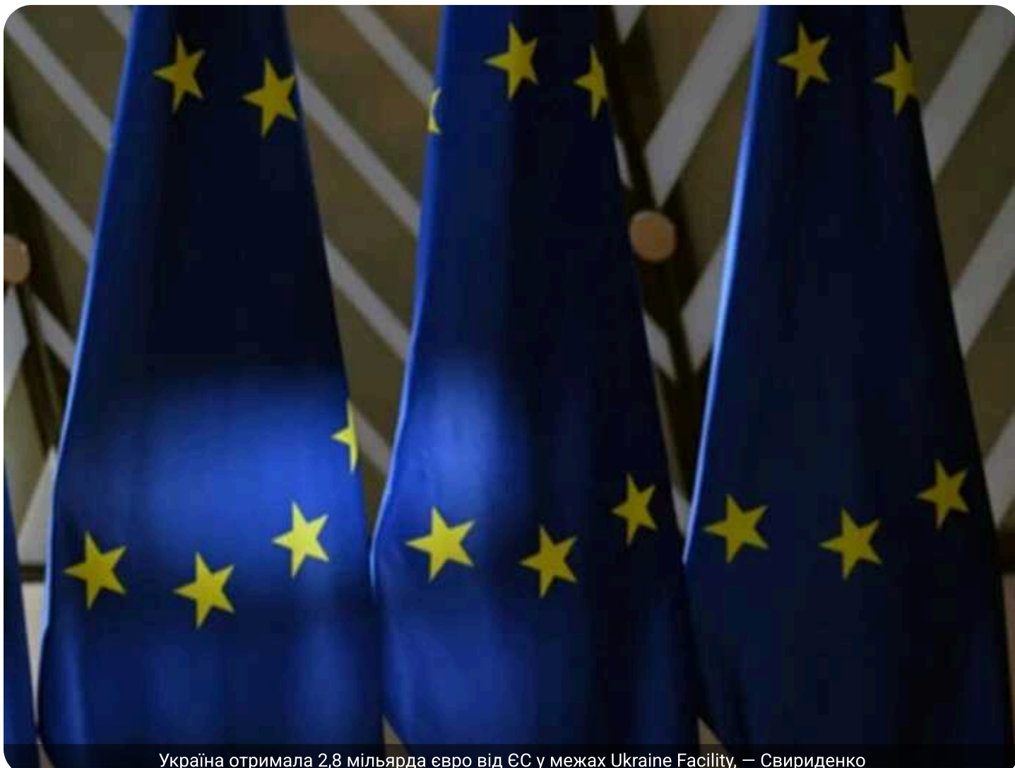
Україна отримала 2,8 мільярда євро від ЄС у межах Ukraine Facility, — Свириденко

Україна отримала сьомий транш фінансування від Європейського Союзу в межах Ukraine Facility загальним обсягом 2,8 мільярда євро.