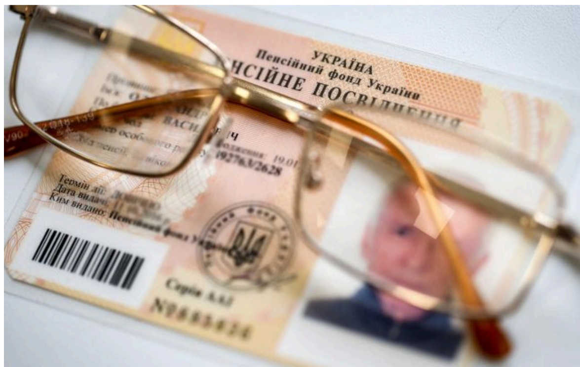
Фото: у чому суть урядової реформи