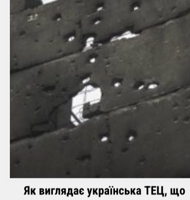
Як виглядає українська ТЕЦ, що пережила не одну ракетну атаку російських загарбників