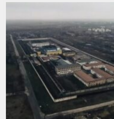
Російські загарбники перетворили Бердянську колонію № 77 на катівню для українців