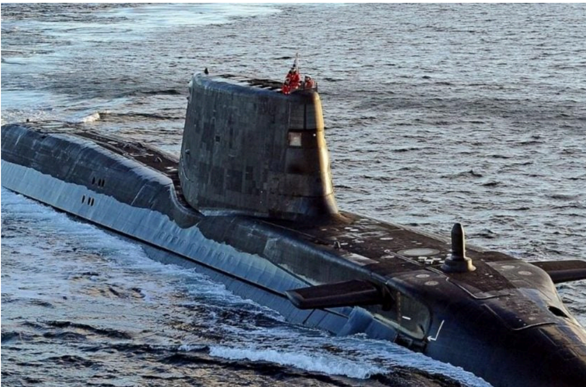
Атомні підводні човни

КАРПЕЦЬ ОЛЕКСАНДР — 08 Червня 2026, 13:28 2 Mins Read — АРМІЯ І ЗБРОЯ