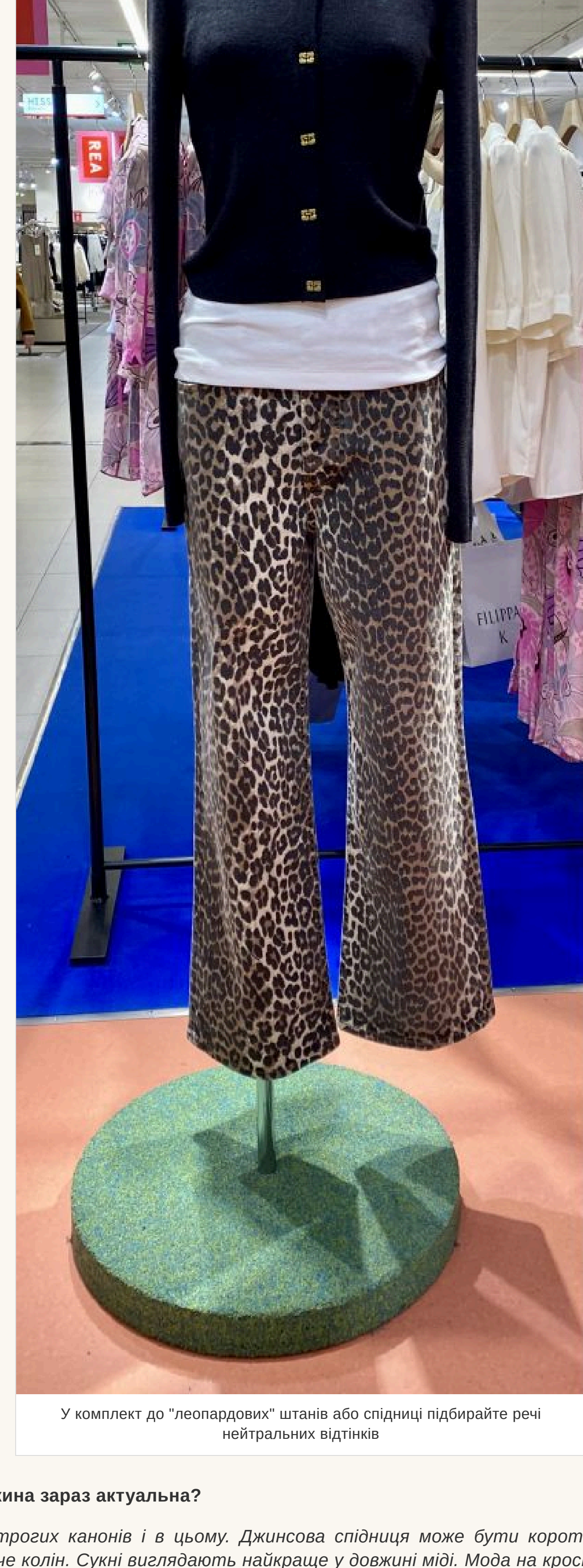
У комплект до «леопардових» штанів або спідниці підбирайте речі нейтральних відтінків

— Якщо така рін у вашому гардеробі — улюблена, носите із задоволенням. Але у комплект до «леопардових» штанів або спідниці підбирайте речі нейтральних відтінків і фасону, що не «кричить» — інакше буде перебір.