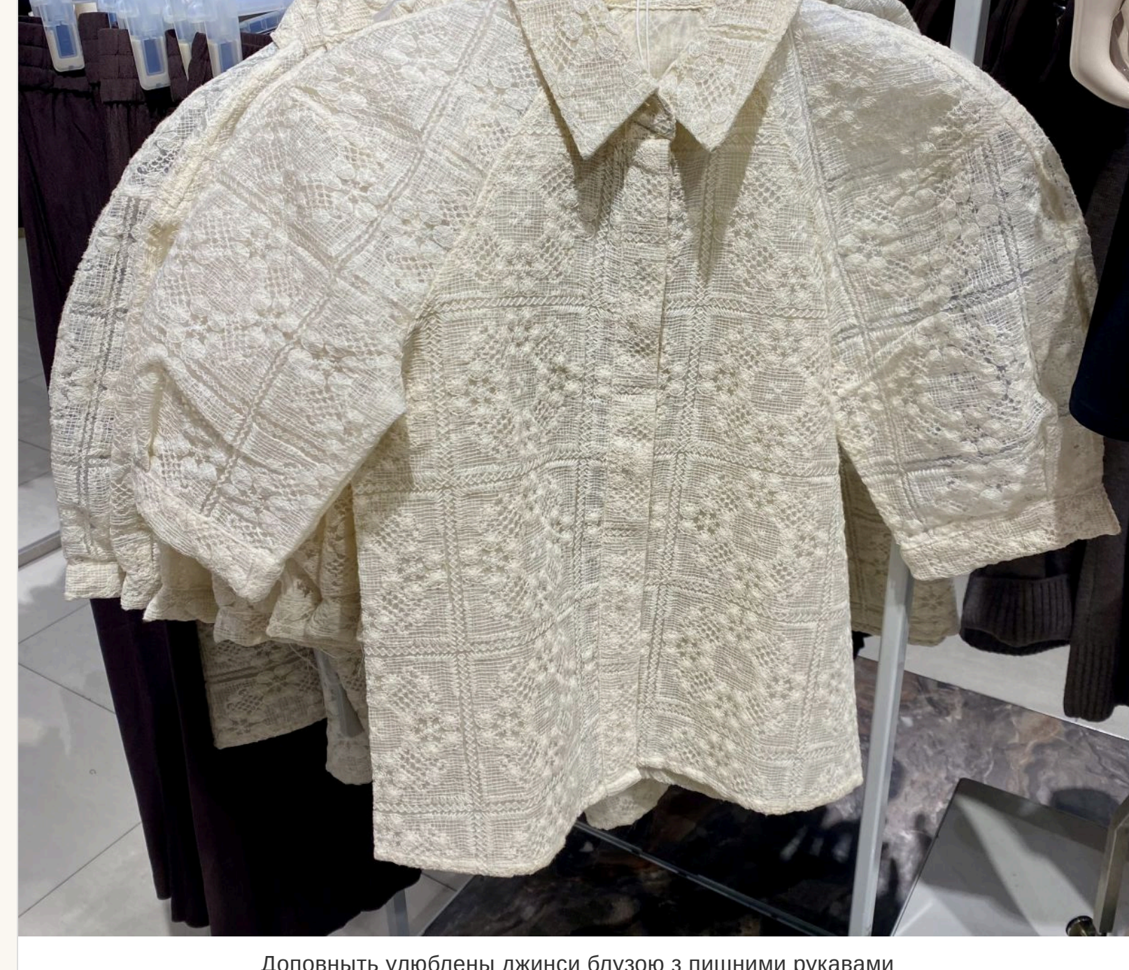
Доповнить улюблені джинси блузою з пишними рукавами

— Викодить, що так. Секрет лише в тому, чим «оновити» ці джинси, що під них одягнути. Наприклад, зараз у моді багатощаровість. Якщо на джинси одягнути легку шовкову або шовкову спідницю, це виглядатиме дуже актуально. Або блузу з пишними рукавами, об'ємний піджак. Не треба боятися виглядати не класично.