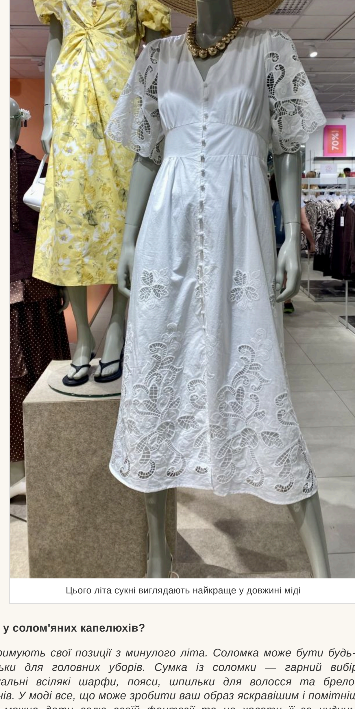
Цього літа сукні виглядають найкраще у довжині між

— Немає строгих канонів і в цьому. Джинсова спідниця може бути короткою із суцільним і трохи вище колін. Сукні виглядають найкраще у довжині між колінами до колінок у гудзюк відходять. Звичайно, це комфортно, але для літа краще підібрати босоніжки на низькій підсоші або півшпильні шльопанці. У моді найпростіші в'єтнамки, які зазвичай носять на пляжі. Вони дуже щільно виглядають із джинсами. Що стосується фасонів штанів, то головне — це комфорт. Купуйте трохи більше вашого розміру, не намагайтеся, щоб джинси чи штани сиділи ідеально. Якщо здаватиметься, що ви їх заповчили у свого хлопця — це те, що треба!