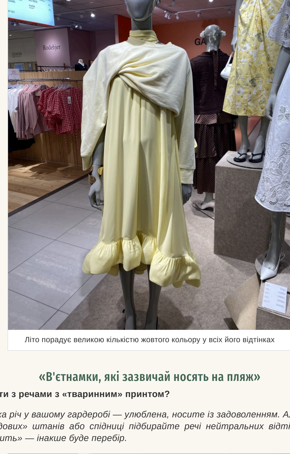
Літо порадує великою кількістю жовтого кольору у всіх його відтінках

Знову актуальна зав'язана талія та накладки кишень. Нісуді це зник зорух — він став ще більшим у порівнянні з минулим сезоном. Що стосується клітнини, то вибиратиме вбрання із клітчиною середнього розміру, а ось її колір найкраще щоб був яскравим. Літо порадує великою кількістю жовтого кольору у всіх його відтінках. Білий — на піку популярності. Продовжує утримувати позиції та яскраво-червоної із блакитним. А ось популярний минулого літа коричневий поступається своїм місцем.