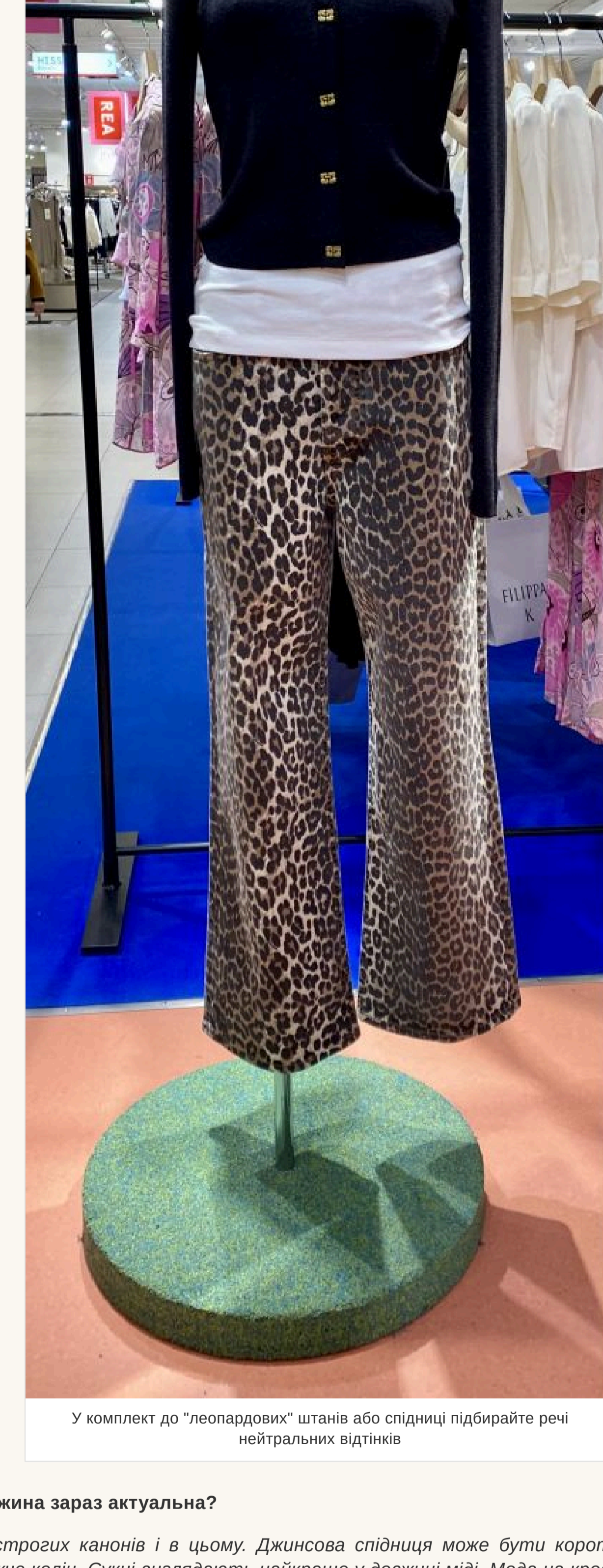
У комплект до «леопардових» штанив або спїдницї підбирайте речі нейтральних відтїнків

— Якщо така рїч у вашому гардеробї — улюблена, носите із задоволенням. Але у комплект до «леопардових» штанив або спїдницї підбирайте речі нейтральних і фасону, що не «кричить» — інакше буде перебір.