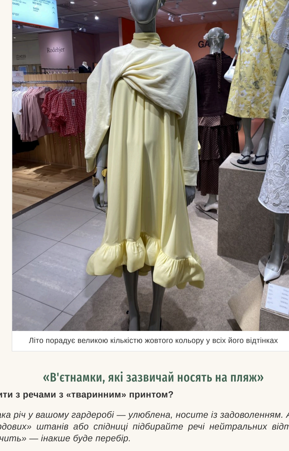
Лїто порадує великою кількістю жовтого кольору у всіх його відтінках

Знову актуальна завищена талія та накладні кишені. Нїкуди не зник зорох — він став ще більшим у порівнянні з минулим сезоном. Що стосується клітшин, то вибирати вбрання із клітшиною середнього розміру, а ось її колір найкраще щоб був яскравим. Літо порадує великою кількістю жовтого кольору у всіх його відтінках. Білий — на лїку популярності. Продовжує утримувати позиції та яскраво-червоний із блакитним. А ось популярний минулого літа коричневий поступається своїм місцем.