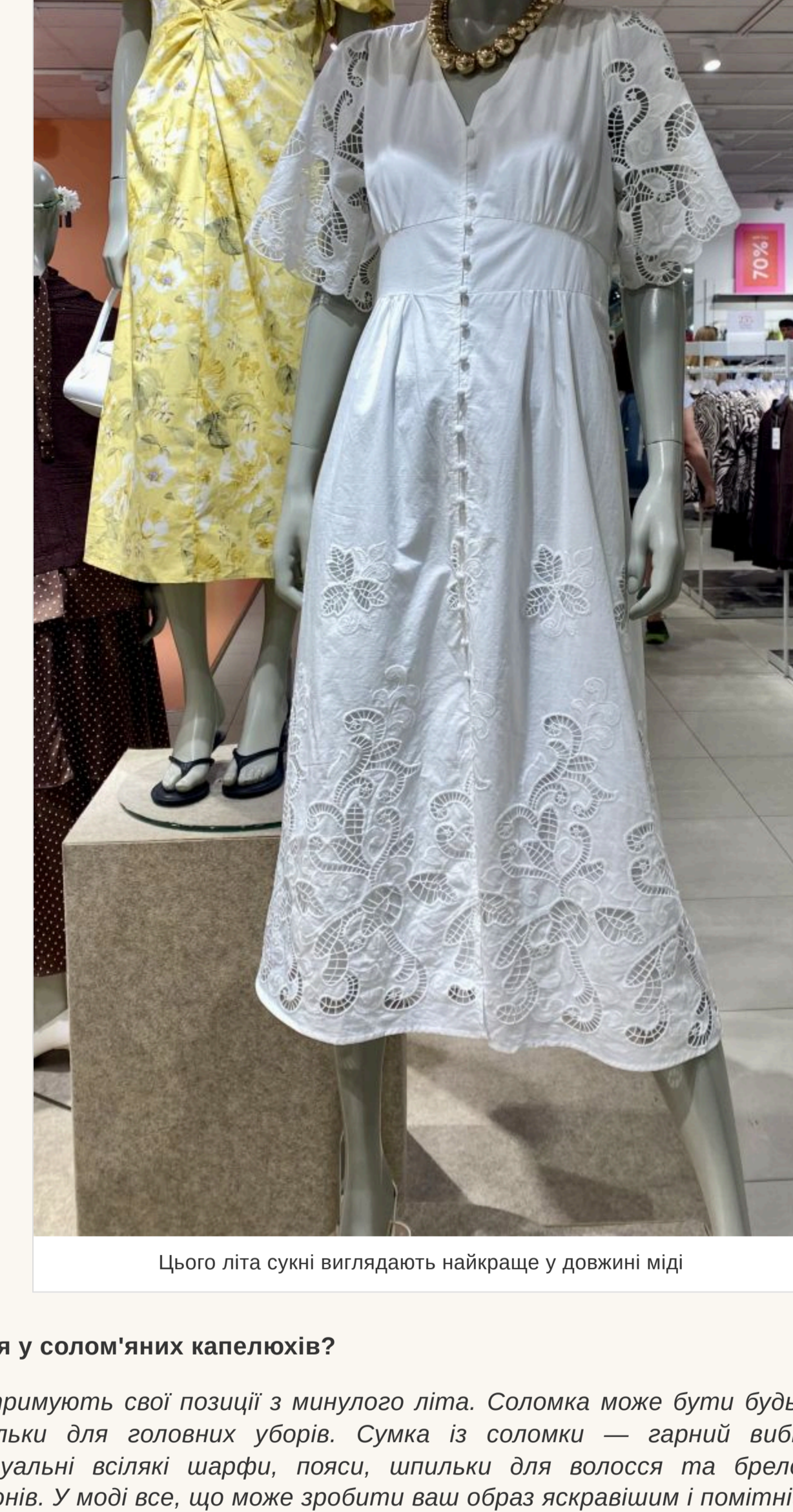
Цього літа сукні виглядають найкраще у довжину мідї

— Немає строгих канонів і в цьому. Джинсова спїдниця може бути короткою на гудзик і трішки нижче колїни. Сукня виглядатиме найкраще у довжину мідї. Мода на кросївки із сукнями відокрилась. Звичайно, це комфортно, але для лїта краще підібрати босоніжки на низькій пїдошві або популярнї шльопанці. У модї найпростїшї в'єтнамки, які зазвичай носять на пляж. Вони дуже щільно виглядають із джинсами. Що стосується фасонів штанив, то головне — це комфорт. Купуйте трохи більше вашого розміру, не намагайтеся, щоб одягати чи штани сидїли ідеально. Якщо здаватиметься, що ви їх запозичили у свого хлопця — це те, що треба!