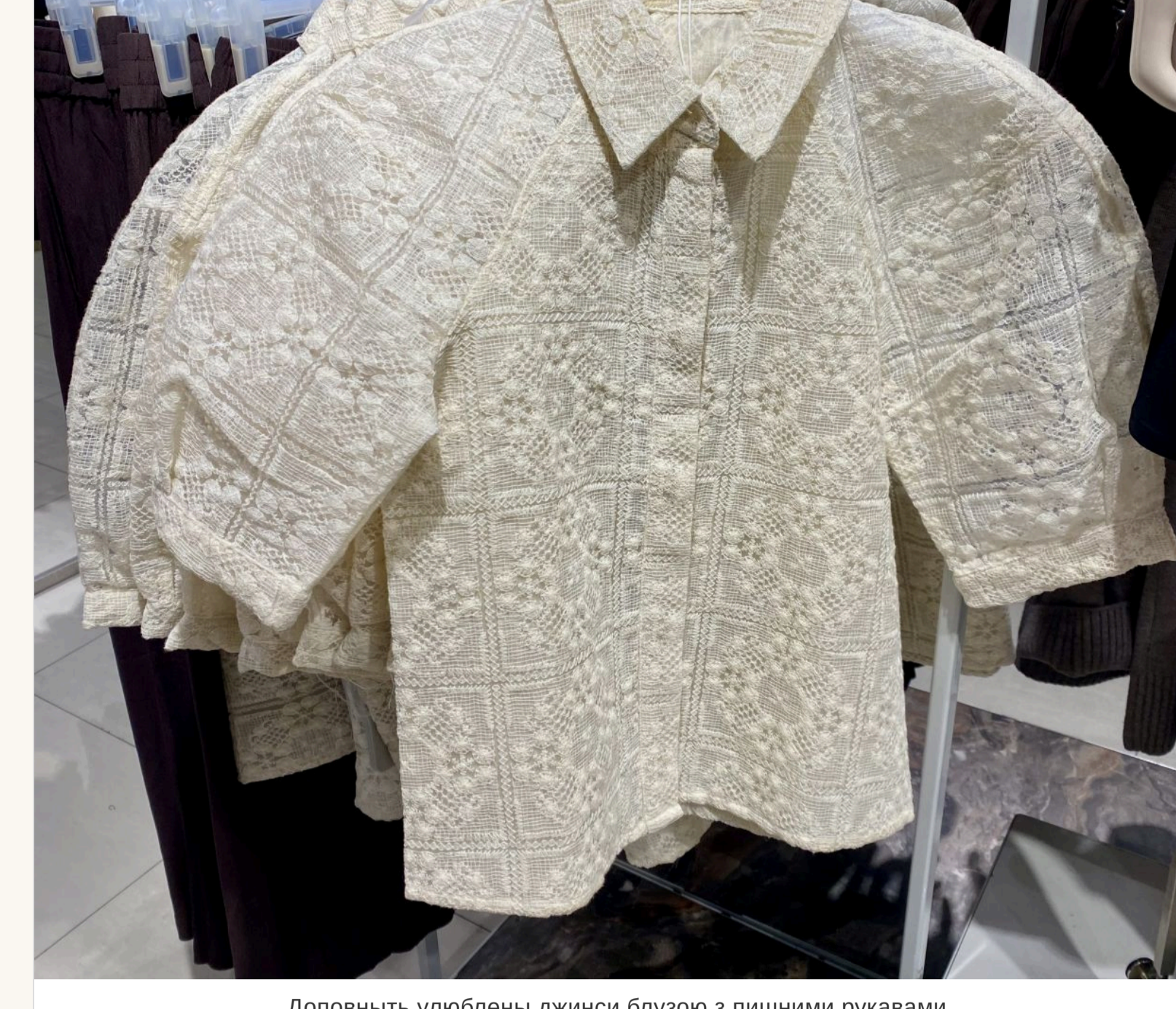
Доповнить улюбленї джинси блузою з пишними рукавами

— Виходить, що так. Секрет лише в тому, чим «новітїш» ці джинси, що лїд них одягати. Наприклад, зараз у модї базатюшарість. Якщо на джинси одягнути легку отвору або шовкову спїдницю, це виглядатиме дуже актуально. Або блузу з пишними рукавами, об'ємнїй пїд'як. Не треба боятися виглядати не класично.