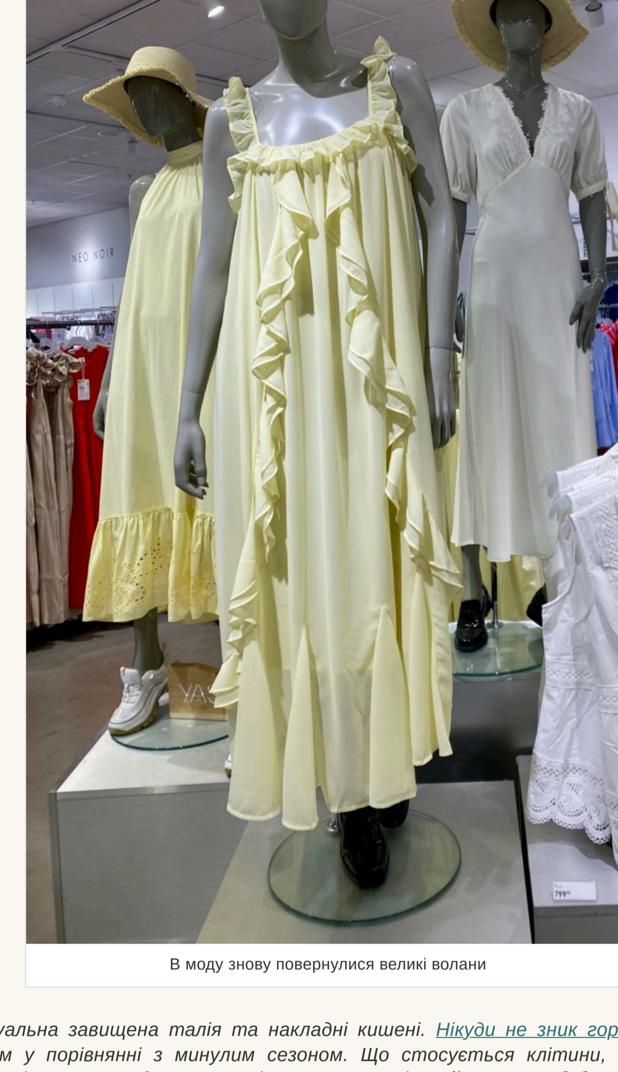
В моду знову повернулися великі волани

— На сухих теплох рїднт завжди виглядає красиво та ніжно. Інциє питання — наскільки квіти будуть актуальнї такого вбрання. Скажимо, якщо дївчина невисокого зросту, то великі квіти їй не підійдуть, а от дрібні — саме те, що треба. І навпаки. Якщо говорити про фасони суконь, то в моду повернулися великі волани. Вони можуть прикрашати поділ виробу, глибокий виріз чи рукав.