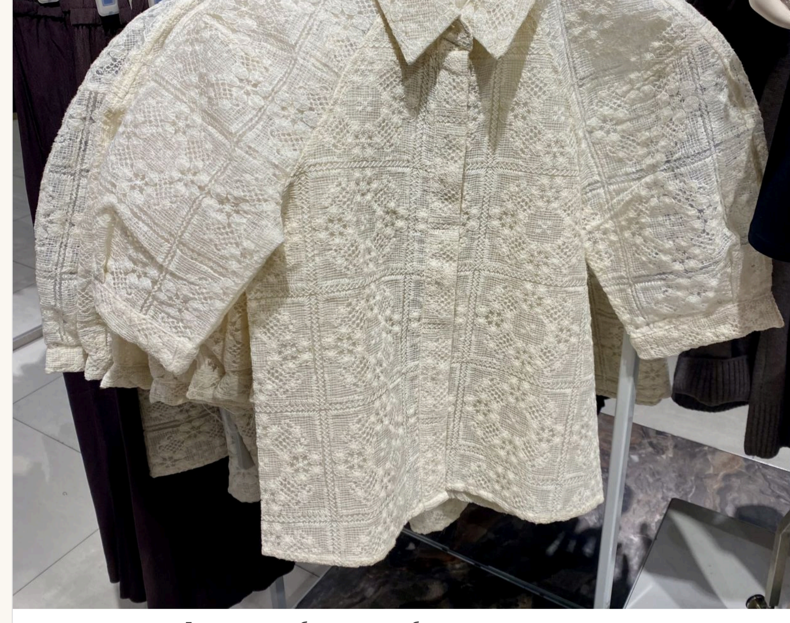
Доповнити улюблені джинси блузою з пишними рукавами

— Виходить, що так. Секрет лише в тому, чим «оновити» ці джинси, що під них одягнути. Наприклад, заради у моді багатшаровість. Якщо на джинси одягнути легку сілпору або шовкову спідницю, це виглядатиме дуже актуально. Або блузу з пишними рукавами, об'ємний піджак. Не треба боятися виглядати не класично.