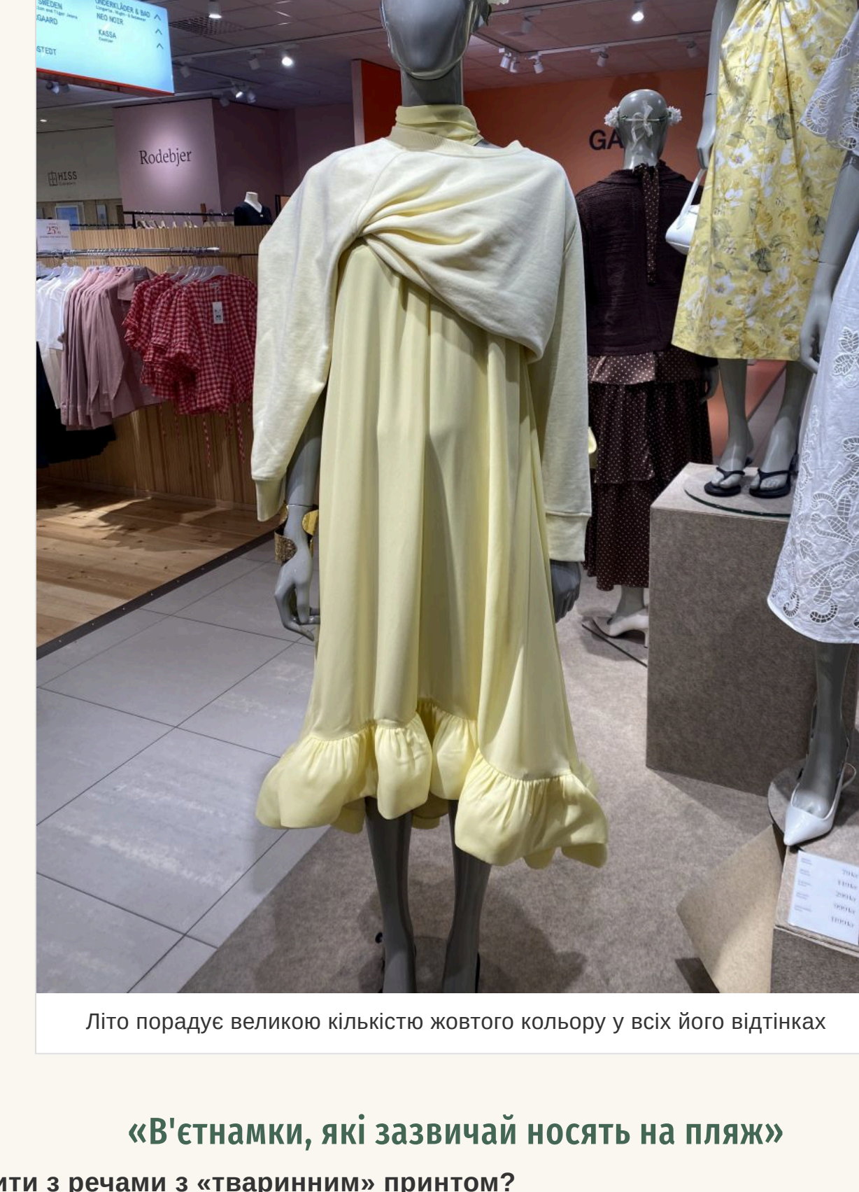
Літню порадує великою кількістю жовтого кольору у всіх його відтінках

Знову актуальна завищена талія та накладні кишені. Нікуди не зник горох — він став ще більшим у порівнянні з минулим сезоном. Що стосується клітнини, то вибирайте вбрання із клитиною середнього розміру, а ось її колір найкраще щоб був яскравим. Літню порадує великою кількістю жовтого кольору у всіх його відтінках. Білий — на піку популярності. Продовжує утримувати позиції та яскраво-чорний із блискотини. А ось популярний минулого літа коричневий поступається своїм місцем.