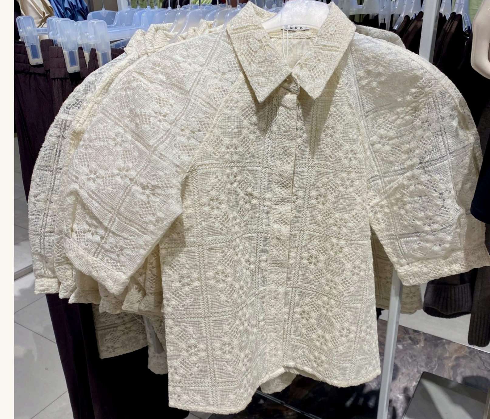
Доповнити улюблені джинси блузою з пишними рукавами

— Значить, сміливо можна одягати улюблені джинси, яким вже років п'ять? — Виходить, що так. Секрет лише в тому, чим «оновити» ці джинси, що під них одягнути. Навприклад, зараз у моді бавошаровість. Якщо на джинси одягнути легку вільнову або шовкову спідницю, це виглядатиме дуже актуально. Або блузу з пишними рукавами, об'ємний піджак. Не треба боятися виглядати не класично.