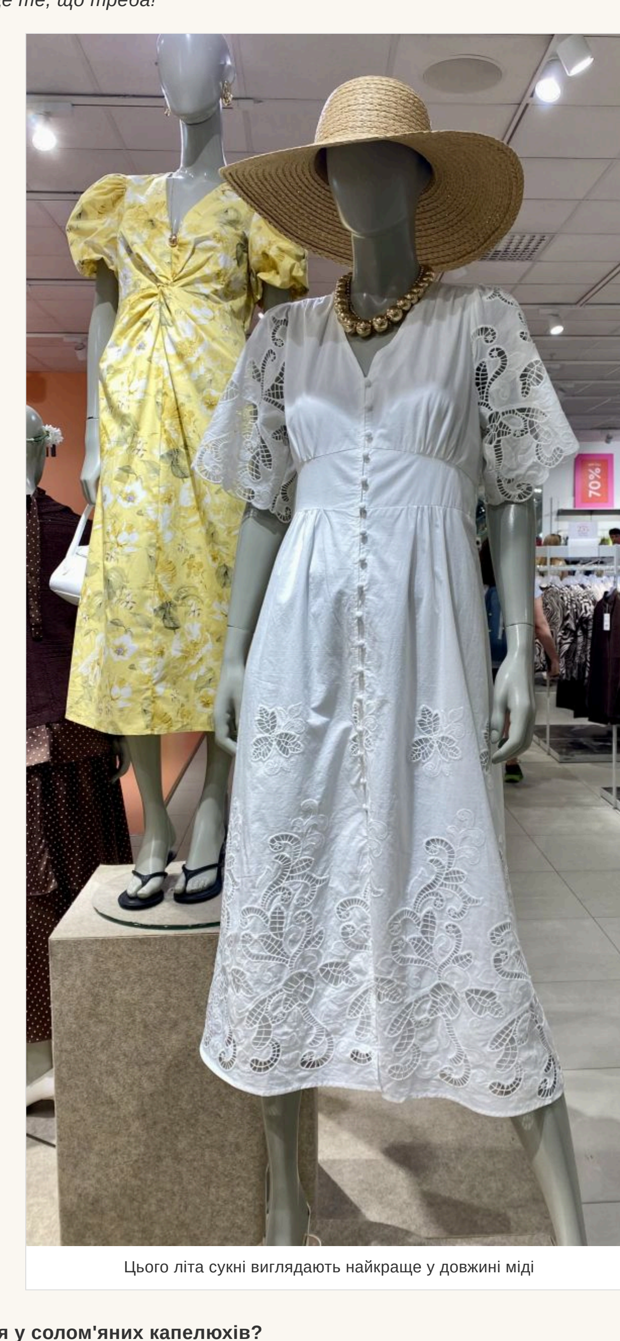
Цього літа сукні виглядають найкраще у довжину міді

— Яка довжина зараз актуальна? — Немає строгих канонів і в цьому. Джинсова спідниця може бути короткою на гудзик і відкривати щиколотки. Сукні виглядають найкраще у довжині міді. Мода на кросявки із сукнями ідентична. Звичайно, це комфортно, але для літа краще підібрати босоніжки на низькій підсошці або популярні шльопанці. У моді найпростіші в'єтнамки, які зазвичай носять на пляж. Вони дуже стильно виглядають із джинсами. Що стосується фасонів штанив, то зовсім — це комфорт. Купуйте трохи більше вашого розміру, не намагайтеся, щоб джинси чи штани сиділи ідеально. Якщо здаватиметься, що ви їх зализчили у своєю хлопця — це те, що треба!