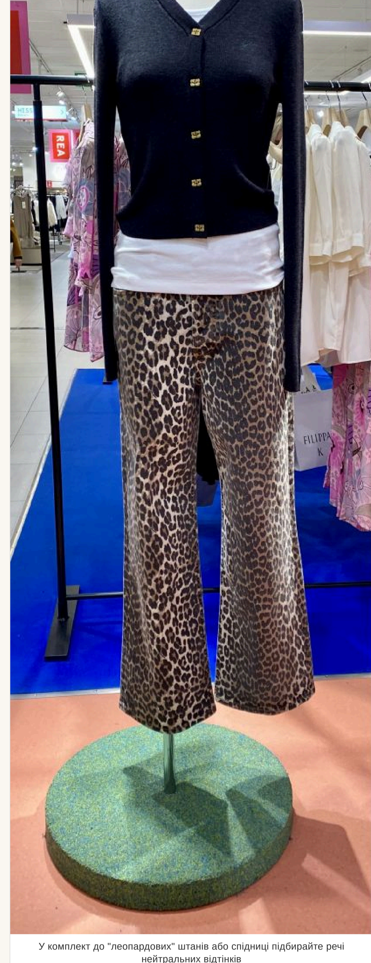
У комплект до «леопардових» штанів або спідниці підбирайте речі нейтральних відтінків

— Що робити з речами з «вєтнаним» принтом? — Якщо така річ у вашому гардеробі — улюблена, носите із задоволенням. Але у комплект до «леопардових» штанів або спідниці підбирайте речі нейтральних відтінків і фасону, що не «крячкотить» — іншакі буде перебр.