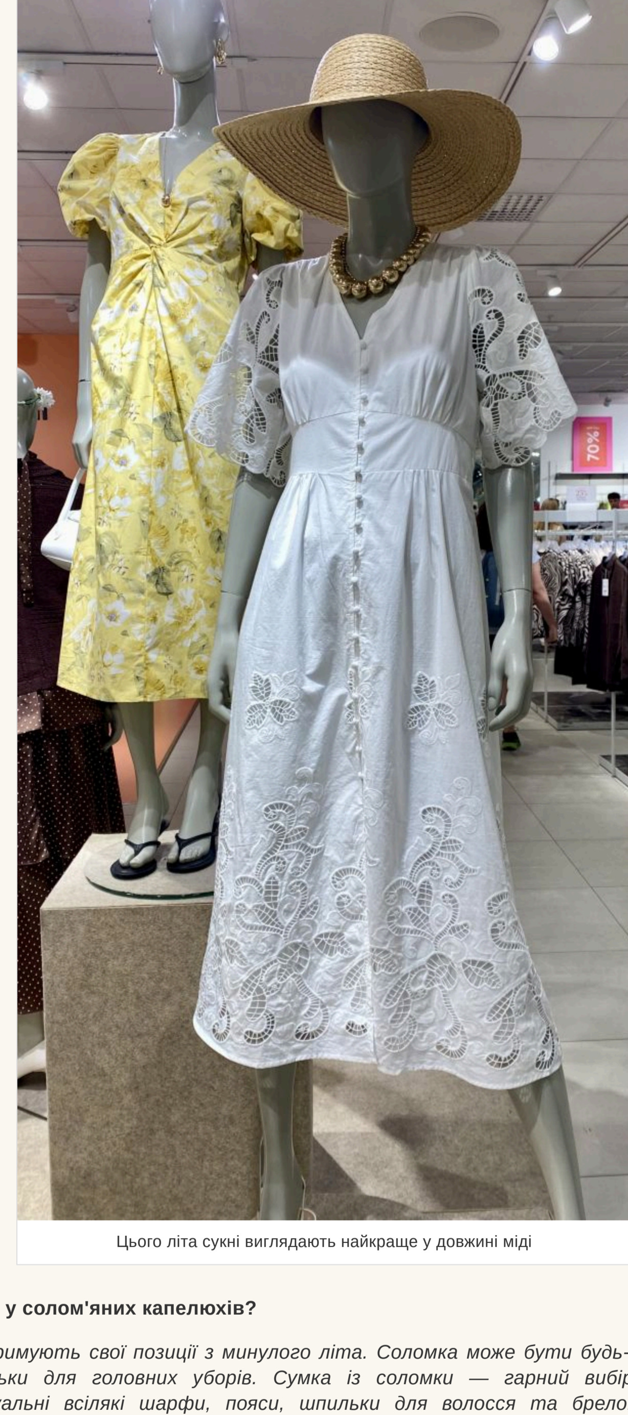
Цього літа суєні виглядають найкраще у довжині міді

— Яка довжина зараз актуальна? — Немає строгих канонів і в цьому. Джинсова спідниця може бути короткою на гудзик і трохи нижче колін. Сукні виглядають найкраще у довжині міді. Мода на кросівки із суцільними відходить. Звичайно, це комфортно, але для літа краще підібрати босоніжки на низькій підшаві або популярні шльопанці. У моді найпростіші в'єтнамки, які зазвичай носять на пляжі. Вони дуже стильно виглядають із джинсами. Що стосується фасонів штанів, то головне — це комфорт. Купуйте трохи більше вашого розміру, не намагайтеся, щоб джинси чи штани сиділи ідеально. Якщо здаватиметься, що ви їх зазичили у свого хлопця — це те, що треба!