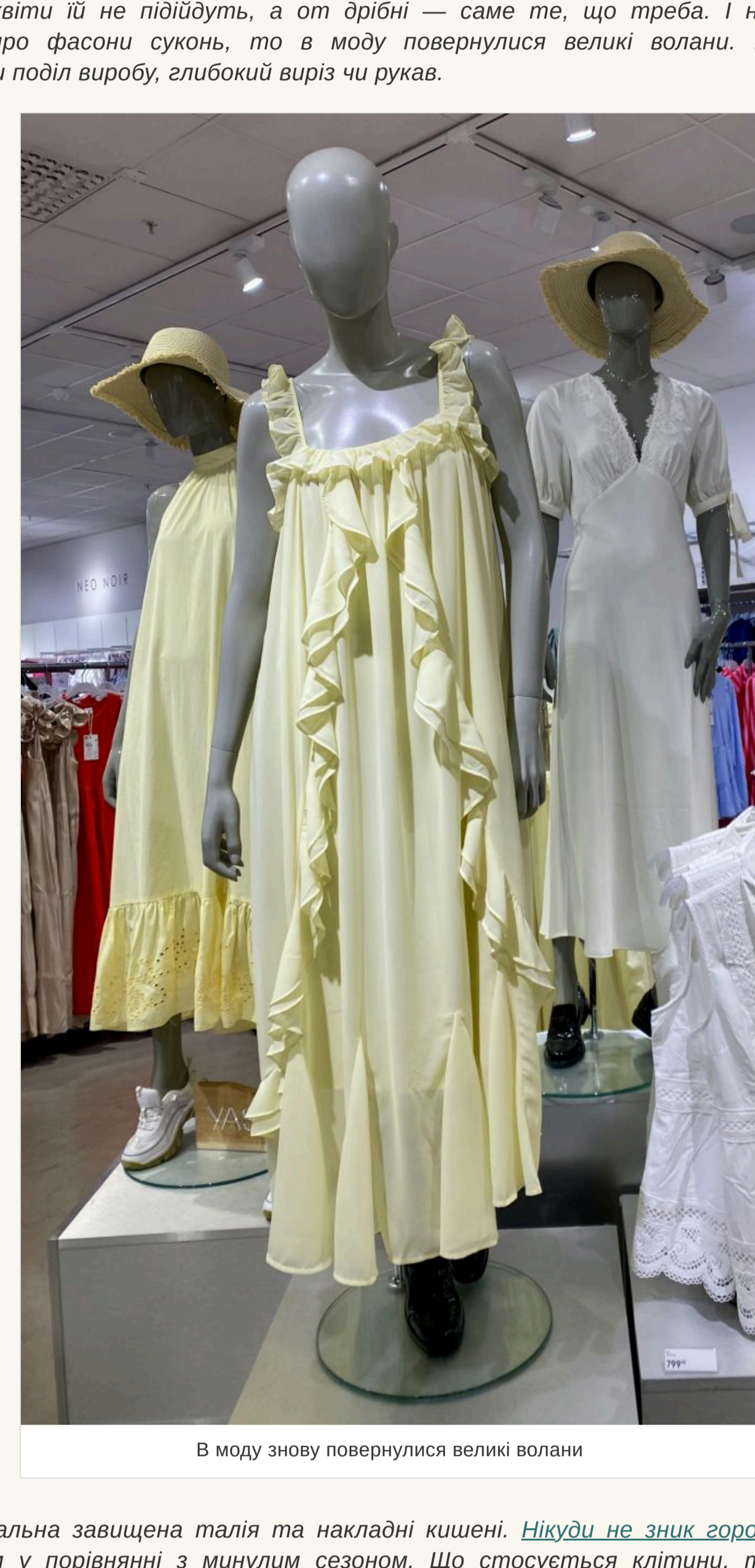
В моду знову повернулися великі волани

— Чи варто вибирати вбрання із квітковими принтами? — На сухих такій принт завжди виглядає красиво та ніжно. Інше питання — наскільки квіти йдуть володарці такого вбрання. Скажимо, якщо дівчина невисокого зросту, то великі квіти їй не підійдуть, а от дрібні — саме те, що треба. І навпаки. Якщо говорити про фасони суконь, то в моду повернулися великі волани. Вони можуть прикрасити поділ виробу, глибокий виріз чи рукав.