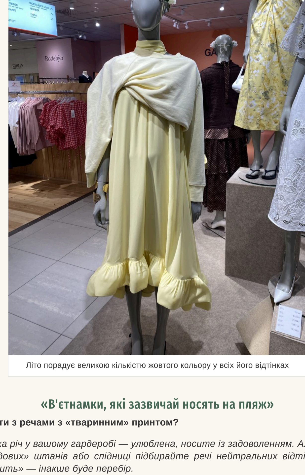
Літо порадує великою кількістю жовтого кольору у всіх його відтінках

Знову актуальна завищена талія та накладні кишені. Нікуди не зник 2020x — він став ще більшим у порівнянні з минулим сезоном. Що стосується клітшини, то вибирайте вбрання із клітшиною середнього розміру, а ось її колір найкраще щоб був яскравим. Літо порадує великою кількістю жовтого кольору у всіх його відтінках. Білий — на піку популярності. Продовжує утримувати позиції та яскраво-червоної із білким. А ось популярний минулого літа коричневий поступається своїм місцем.