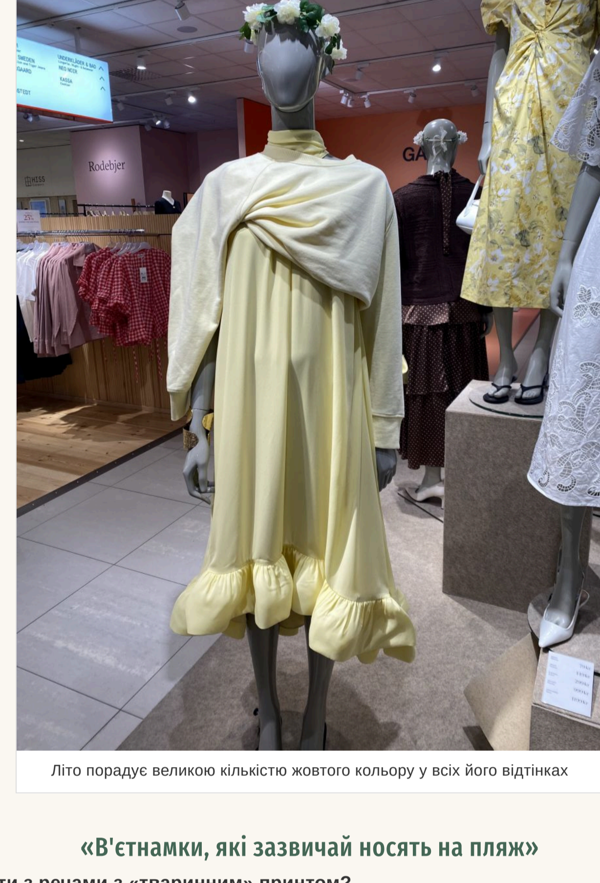
Лїто порадує великою кїлькїстю жовтого кольору у всїх його відтїнках

Знову актуальна завищена талїя та накладні кишенї. Нікуди не зник зорох — він став ще бїльшим у порівнянні з минулим сезоном. Що стосується клітшини, то вибирайте вбрання із клітшиною середнього розмїру, а ось її колїр найкраще щоб був яскравим. Лїто порадує великою кїлькїстю жовтого кольору у всїх його відтїнках. Бїлий — на піку популярности. Продовжує утримувати позиції та яскраво-червоний із бїльшим. А ось популярний минулого лїта коричневий поступається своїм місцем.