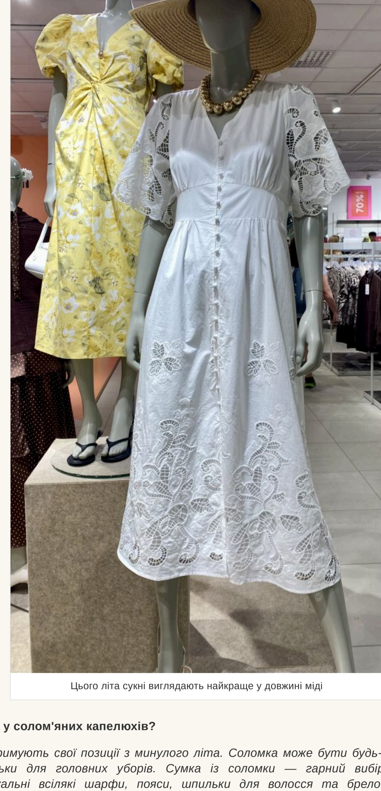
Цього лїта сукнї виглядають найкраще у довжинї мїдї

— Немає строгих канонів і в цьому. Джинсова спїдниця може бути короткою на гудзик і трохи довжє. Звичайно, сукнї виглядають найкраще у довжинї мїдї. Мода на кроєвкї із сукнями вїдходить. Звичайно, це комфортно, але для лїта краще пїдбрати босоніжки на низькїй пїдшавї або понулярнї шльопанцї. У модї найпростїшї в'єтнамки, якї зазвичай носять на пляжї. Вони дуже стильно виглядають із джинсами. Що стосується фасонів штанів, то головне — це комфорт. Купуйте трохи бїльше вашого розмїру, не намагайтеся, щоб джинси чи штани сидїли ідеально. Якщо здаватиметься, що ви їх запозичили у свого хлопця — це те, що треба!