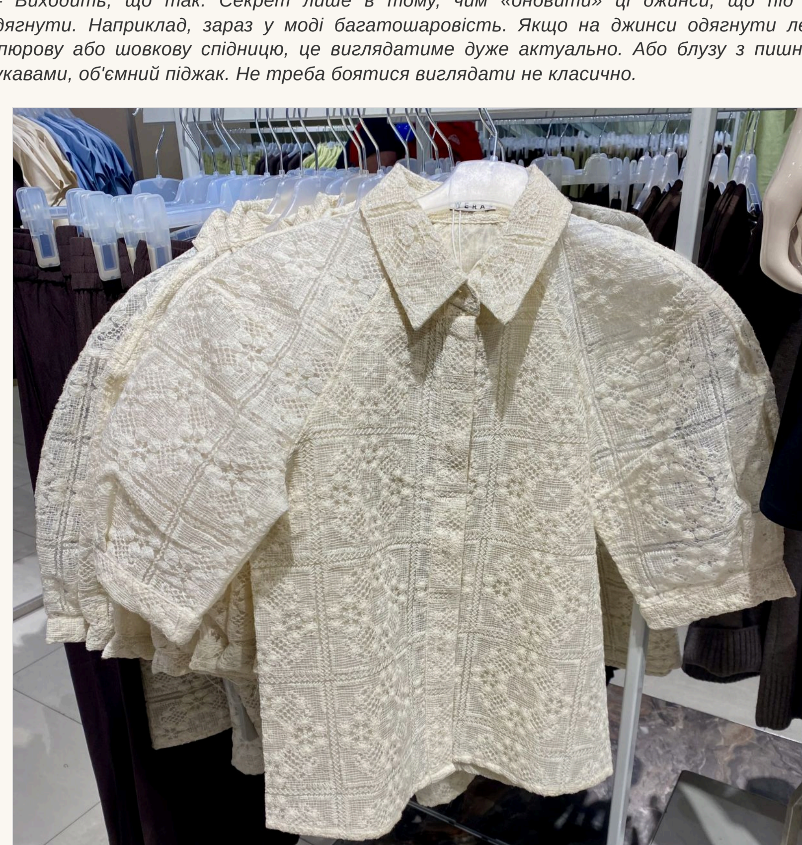
Доповнить улюблені джинси блузою з пишними рукавами

— Значить, смїливо можна одягати улюбленї джинси, яким вже рокїв п'ять? — Виходить, що так. Секрет лише в тому, чим «оновити» ці джинси, що під них одягати. Навряджд, зарад у модї багатозвчєрств. Якщо на джинси одягати легку шпїртову або шовкову спїдницю, це виглядатиме дуже актуально. Або блуз з пишними рукавами, обємний плїжак. Не треба боятися виглядати не класично.