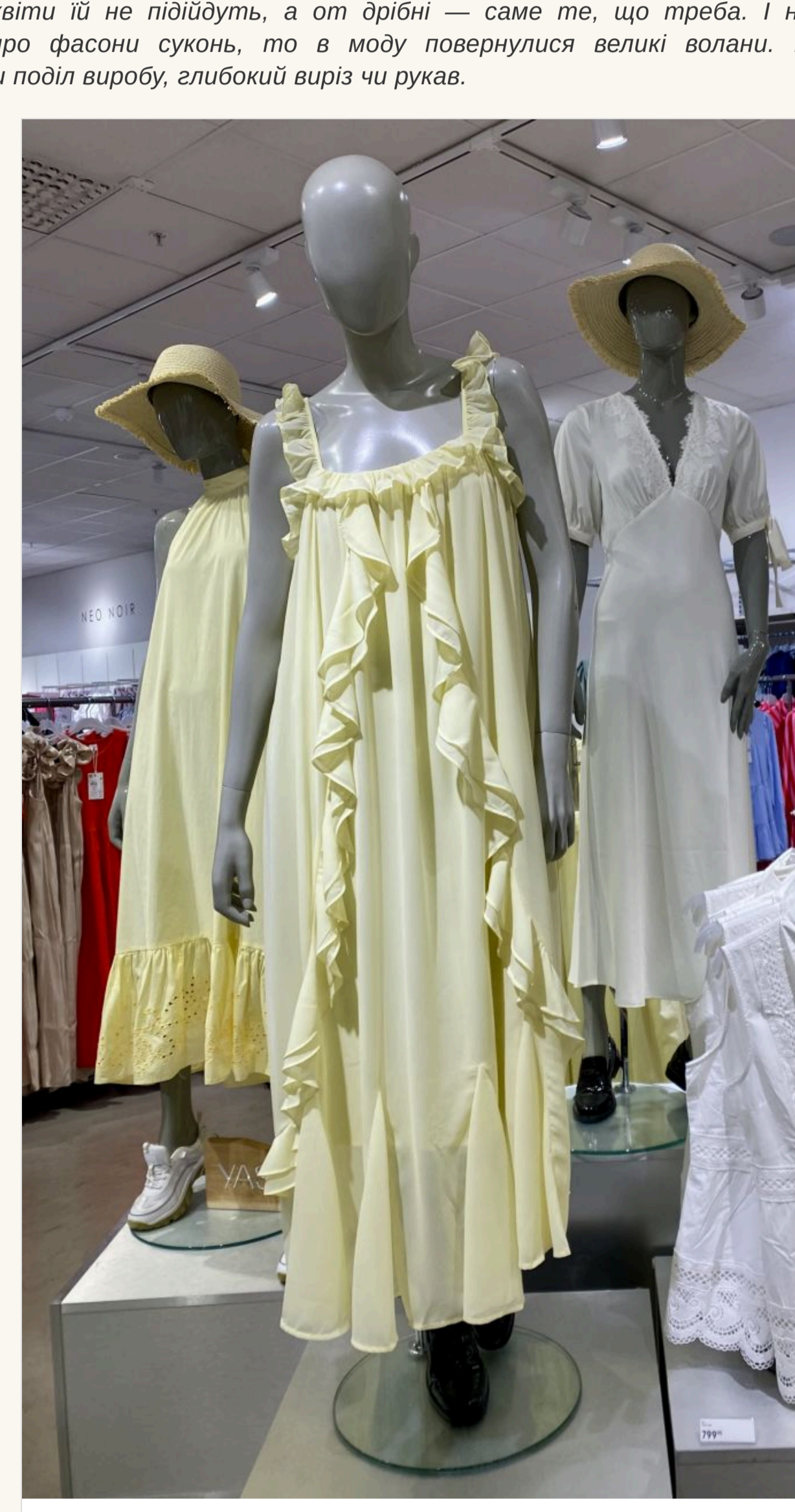
В моду знову повернулися великі волани

— На сукнях такїй принт завжди виглядає красиво та ніжно. Інше питання — наскїльки квіти їдуть володарцї такою вбрання. Скажимо, якщо дївчина невисокого зросту, то великї квіти їй не пїдїдуть, а от дрібнї — саме те, що треба. І навпаки. Якщо говорити про фасони суконь, то в моду повернулися великї волани. Вони можуть прикрашати повїл виробу, глибокїй вирїз чи рукав.