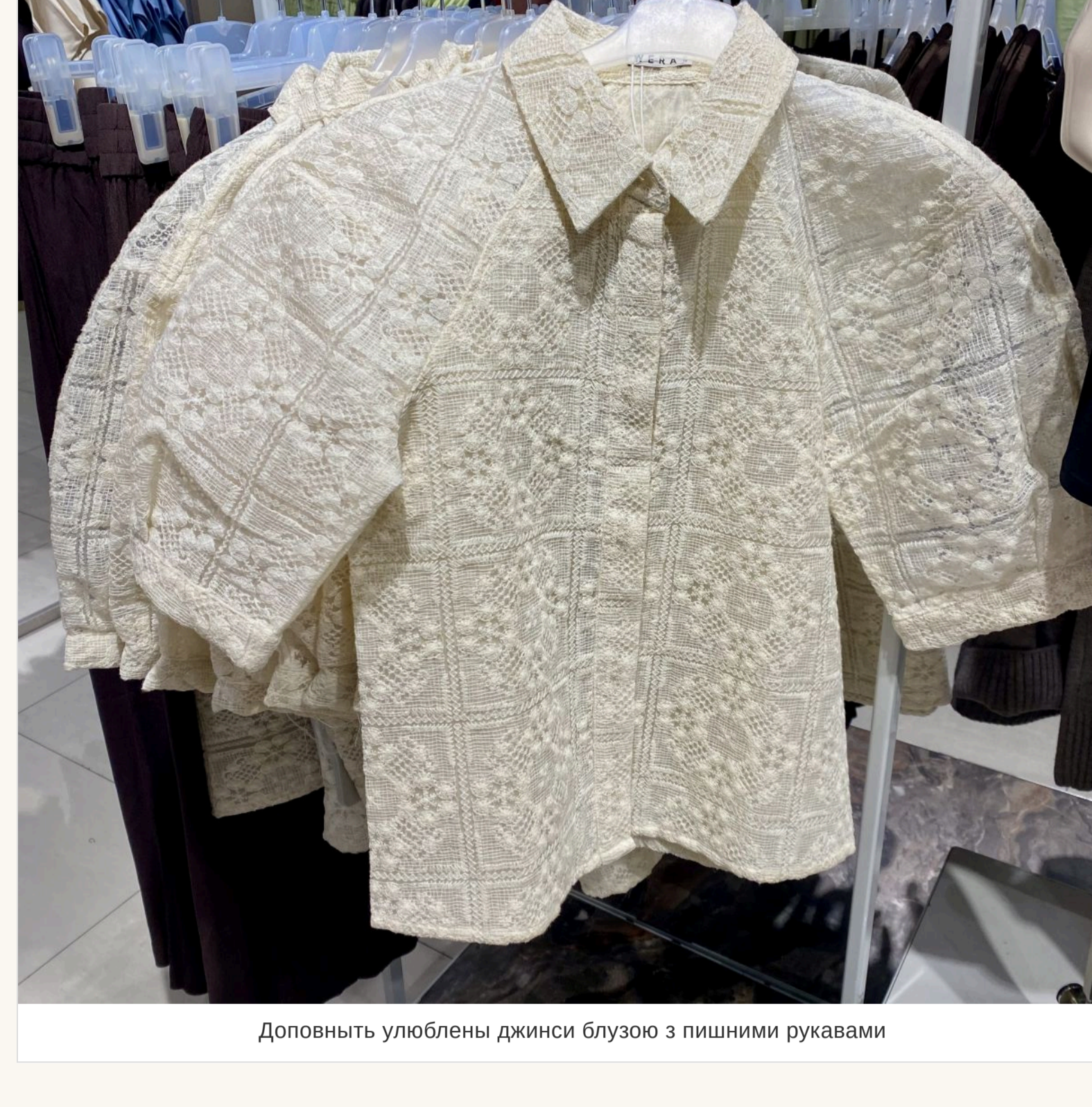
Доповнюють улюблені джинси блузою з пишними рукавами

— Значить, сміливо можна одягати улюблені джинси, яким вже років п'ять? — Виходить, що так. Секрет лише в тому, чим «новити» ці джинси, що під них одягнати. Наприклад, зараз у моді базатюшаровість. Якщо на джинси одягнути легку отвору або шовкову спідницю, це виглядатиме дуже актуально. Або блузу з пишними рукавами, об'ємний піджак. Не треба боятися виглядати не класично.