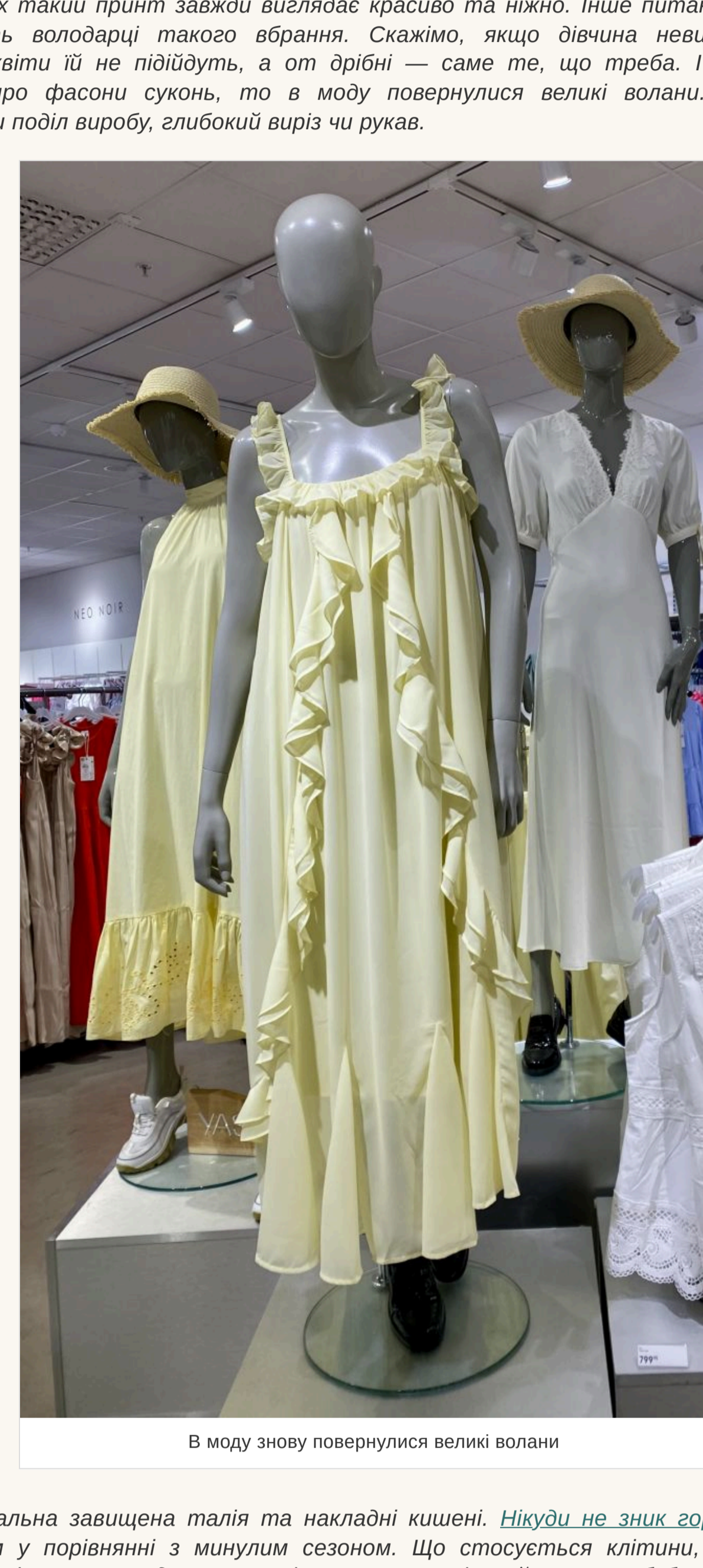
В моду знову повернулися великі волани

— Чи варто вибирати вбрання із квітковими принтами? — На сухих такий принт завжди виглядає красиво та ніжно. Іще питання — наскільки квіти ідуть володарці такого вбрання. Скажимо, якщо дівчина невисокого зросту, то великі квіти їй не підійдуть, а от дрібні — саме те, що треба. І навпаки. Якщо говорити про фасони суконь, то в моду повернулися великі волани. Вони можуть прикрасити поділ виробу, глибокий виріз чи рукав.