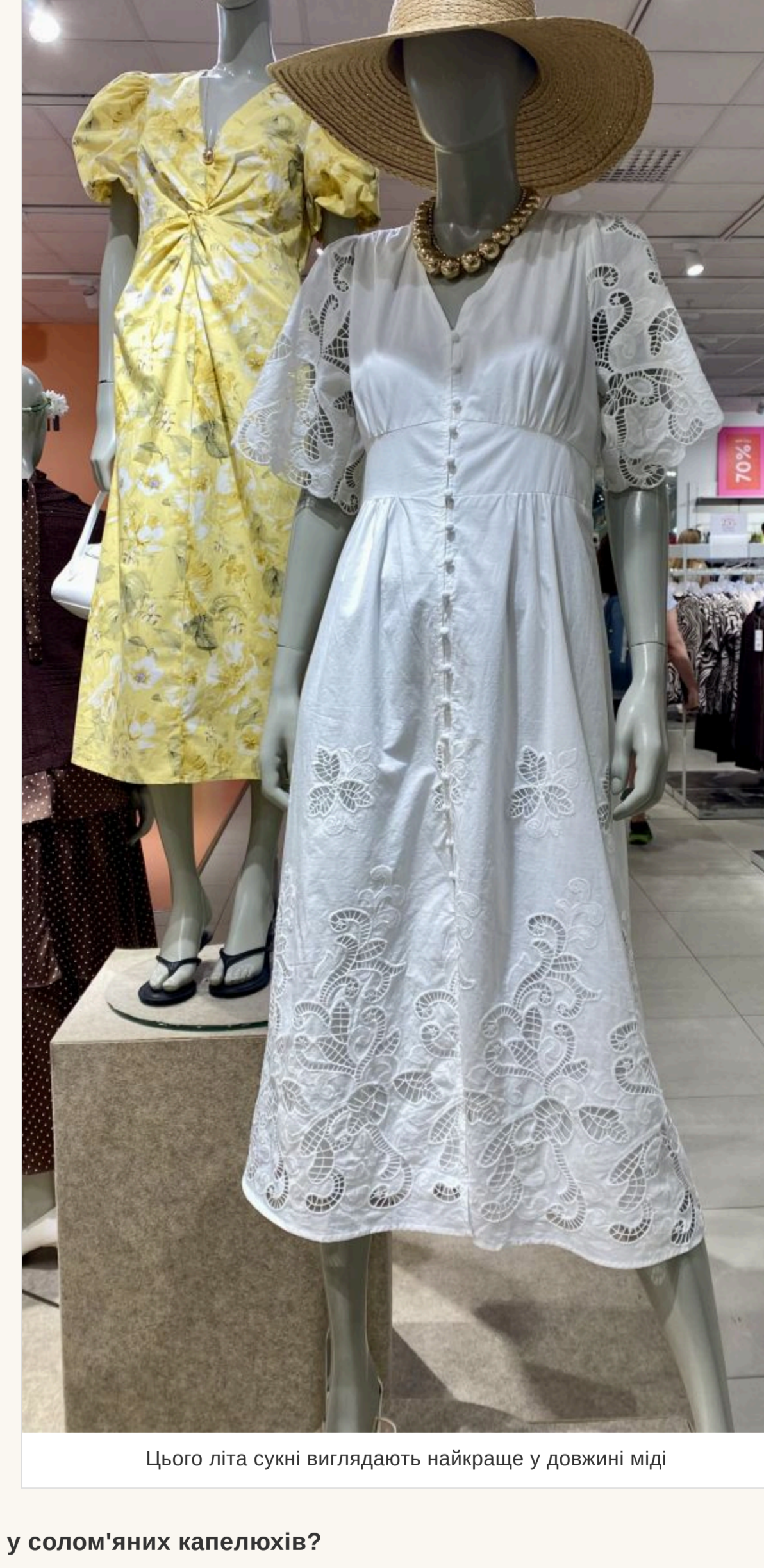
Цього літа сукні виглядають найкраще у довжину коліні

— Яка довжина зараз актуальна? — Немає строгих канонів і в цьому. Джинсова спідниця може бути короткою на гудзик і трішки нижче коліні. Сукні виглядають найкраще у довжину коліні. Мода на красуні із сукнями відкритою або зав'язаною, але для літа краще підібрати босоніжки на низькій підсош або популярні шльопанці. У моді найпростіші в'єтнамки, які зазвичай носять на пляжі. Вони дуже стильно виглядають із джинсами. Що стосується фасонів штанив, то головне — це комфорт. Купуйте трохи більше вашого розміру, не намагайтеся, щоб одягати чи штани сиділи ідеально. Якщо здаватиметься, що ви їх заплочили у свого хлопця — це те, що треба!