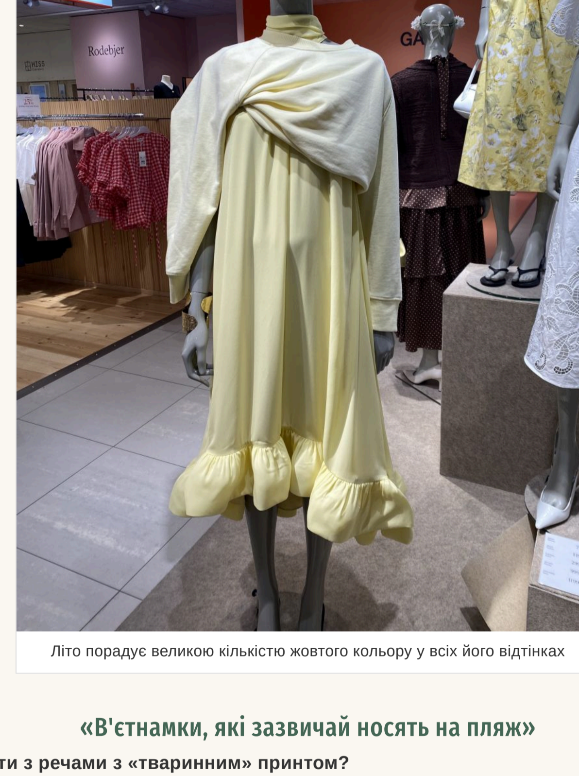
Літо порадує великою кількістю жовтого кольору у всіх його відтінках

Знову актуальна завшчена талія та накладні кишені. Нікуди не зник зорох — він став ще більшим у порівнянні з минулим сезоном. Що стосується клітчини, то вибирайте вбрання із кліткою середнього розміру, а ось її колір найкраще щоб був яскравим. Літо порадує великою кількістю жовтого кольору у всіх його відтінках. Білий — на літку популярності. Продовжує утримувати позиції та яскраво-червоний із блакитним. А ось популярний минулого літа коричневий поступається своїм місцем.