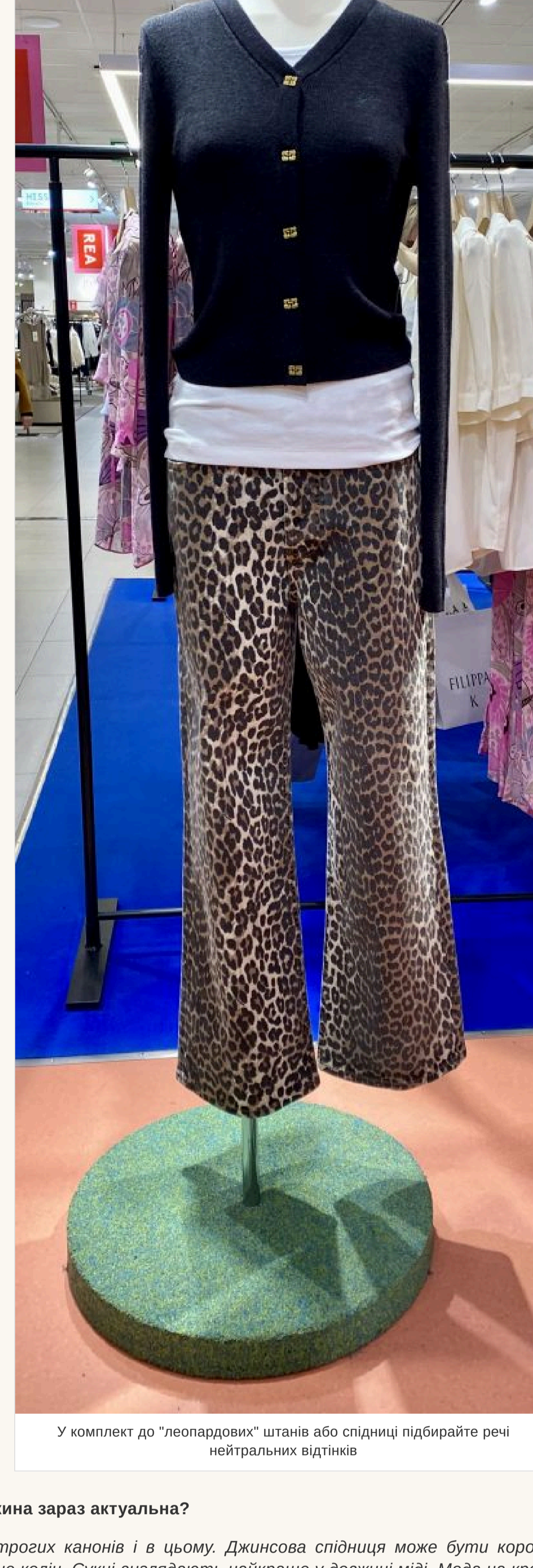
У комплект до «леопардових» штанив або спідниці підбирайте речі нейтральних відтінків

— Що робити з речами з «в'єтнаним» принтом? — Якщо така річ у вашому гардеробі — улюблена, речі із задоволенням. Але у комплект до «леопардових» штанив або спідниці підбирайте нейтральні відтінки і фасону, що не «кричить» — інакше буде перебір.