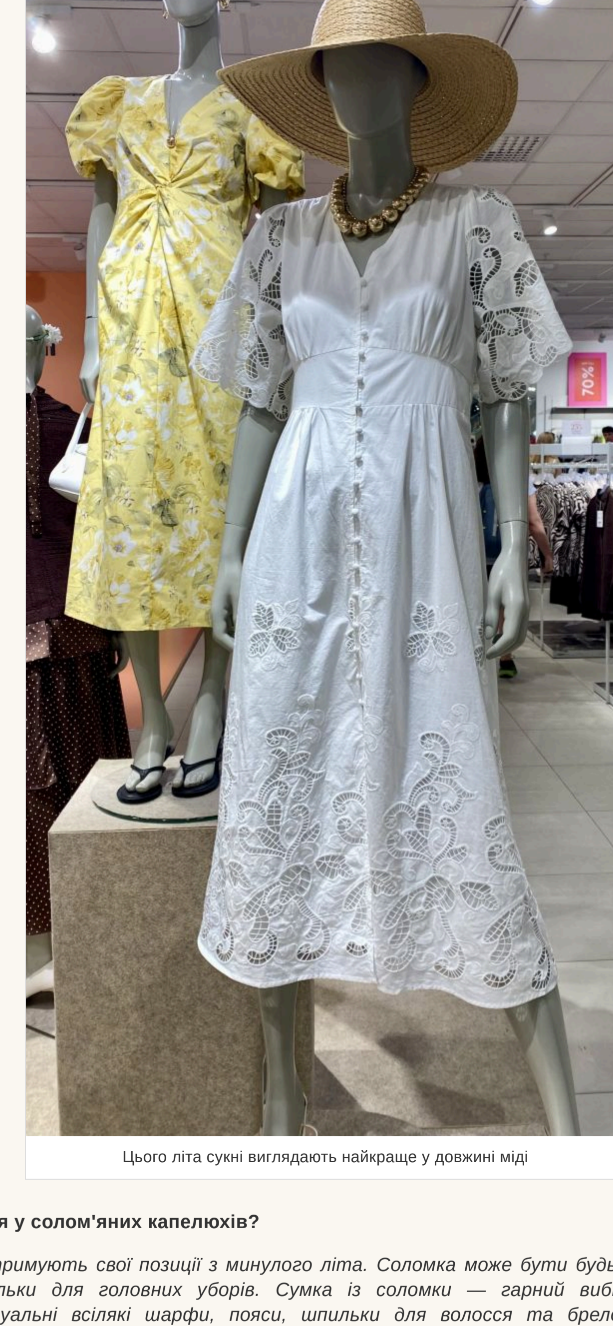
Цього літа сукні виглядають найкраще у довжині міді

— Немає строгих канонів і в цьому. Джинсова спідниця може бути короткою на гудзик і трохи нижче колін. Сукні виглядають найкраще у довжині міді. Мода на кроєвки із сукнями відходить. Звичайно, це комфортно, але для літа краще підібрати босоніжки на низькій підшаві або популярні шльопанці. У моді найпростіші в'єтнамки, які зазвичай носять на пляжі. Вони дуже стильно виглядають із джинсами. Що стосується фасонів штанів, то головне — це комфорт. Купуйте трохи більше вашого розміру, не намагайтеся, щоб джинси чи штани сиділи ідеально. Якщо здаватиметься, що ви їх запозичили у свого хлопця — це те, що треба!