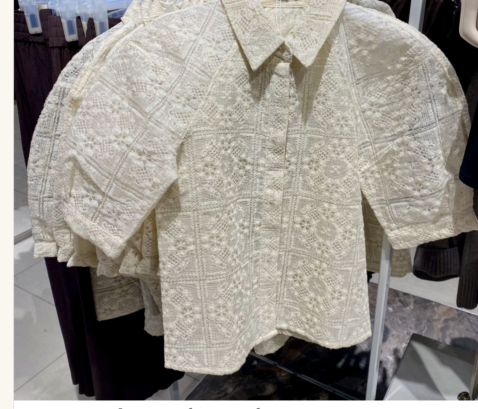
Доповнити улюблені джинси блузою з пишними рукавами

— Виходить, що так. Секрет лише в тому, чим «оновити» ці джинси, що під них одягнути. Наврядки, заради у моді багатозначність. Якщо на джинси одягнути легку сілпору або шовкову спідницю, це виглядатиме дуже актуально. Або блузу з пишними рукавами, об'ємний піджак. Не треба боятися виглядати не класично.