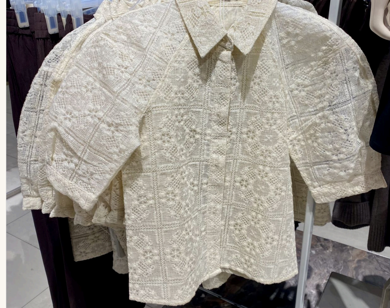
Доповнити улюблені джинси блузою з пишними рукавами

— Виходить, що так. Секрет лише в тому, чим «оновити» ці джинси, що під них одягнути. Наврядки зараз у моді багатшорівність. Якщо на джинси одягнути легку сілпору або шовкову спідницю, це виглядатиме дуже актуально. Або блузу з пишними рукавами, об'ємний піджак. Не треба боятися виглядати не класично.