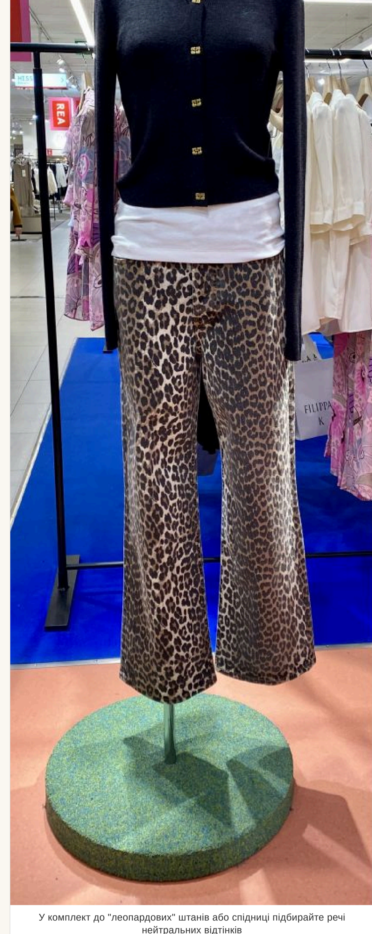
У комплект до «леопардових» штанив або спідниці підбирайте речі нейтральних відтінків

— Якщо така річ у вашому гардеробі — улюблена, носите із задоволенням. Але у комплект до «леопардових» штанив або спідниці підбирайте речі нейтральних відтінків і фасону, що не «контраст» — такіше буде краще.