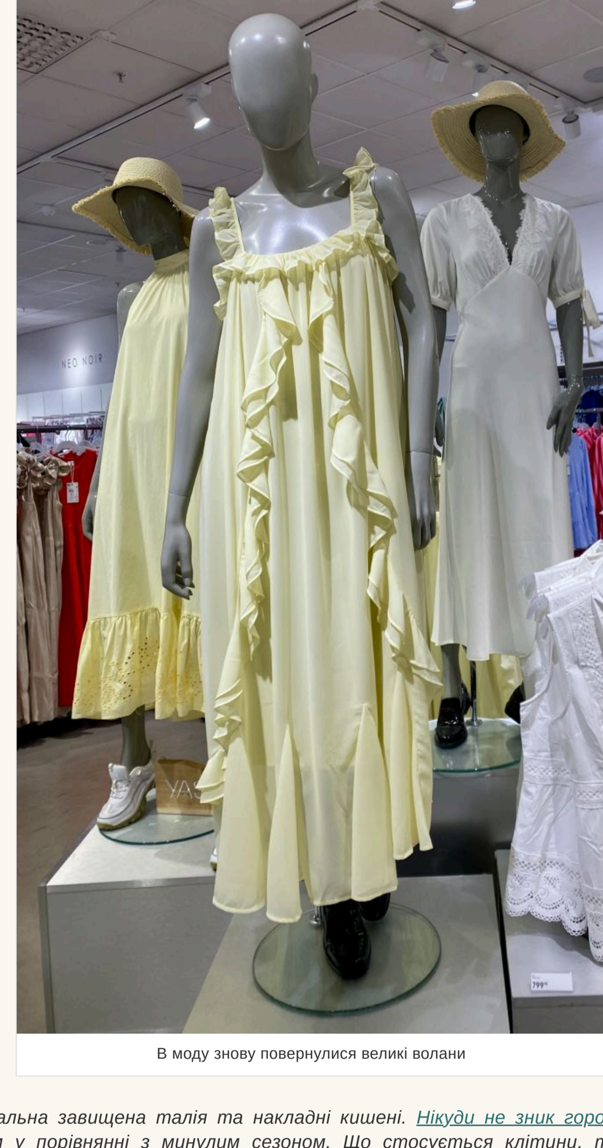
В моду знову повернулися великі волани

— На сукнях такий принт завжди виглядає красиво та ніжно. Інше питання — наскільки квіти йдуть володарці такого вбрання. Скажимо, якщо дівчина невисокого зросту, то великі квіти їй не підійдуть, а от дрібні — саме те, що треба. І навпаки. Якщо говорити про фасони суконь, то в моду повернулися великі волани. Вони можуть прикрасити поділ виробу, глибокий виріз чи рукав.