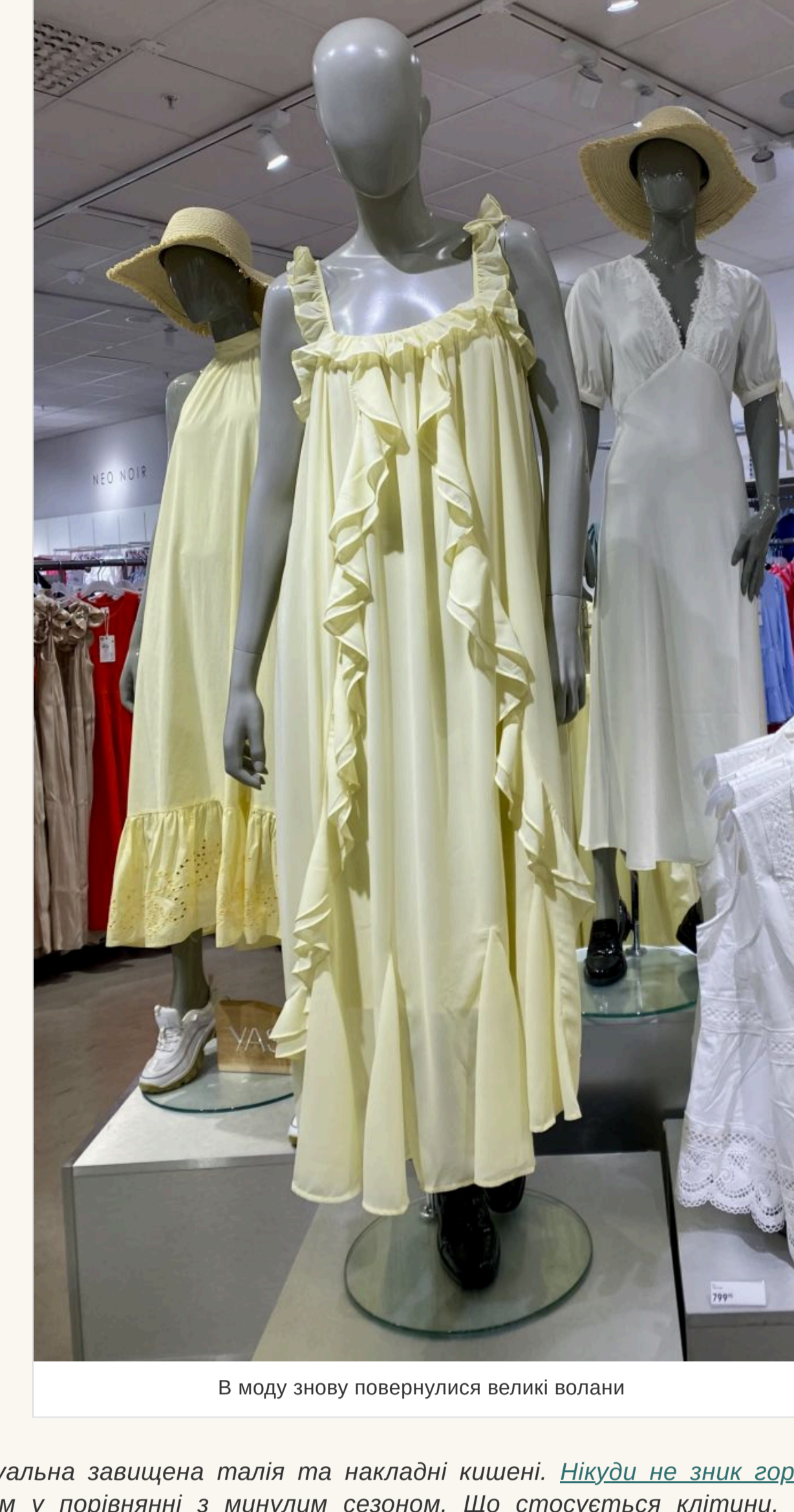
В моду знову повернулися великі волани

— На сукнях такий принт завжди виглядає красиво та ніжно. Інше питання — наскільки квіти йдуть володарці такого вбрання. Скажимо, якщо дівчина невисокого зросту, то великі квіти їй не підійдуть, а от дрібні — саме те, що треба. І навпаки. Якщо говорити про фасони суконь, то в моду повернулися великі волани. Вони можуть прикрасити поділ виробу, глибокий виріз чи рукав.