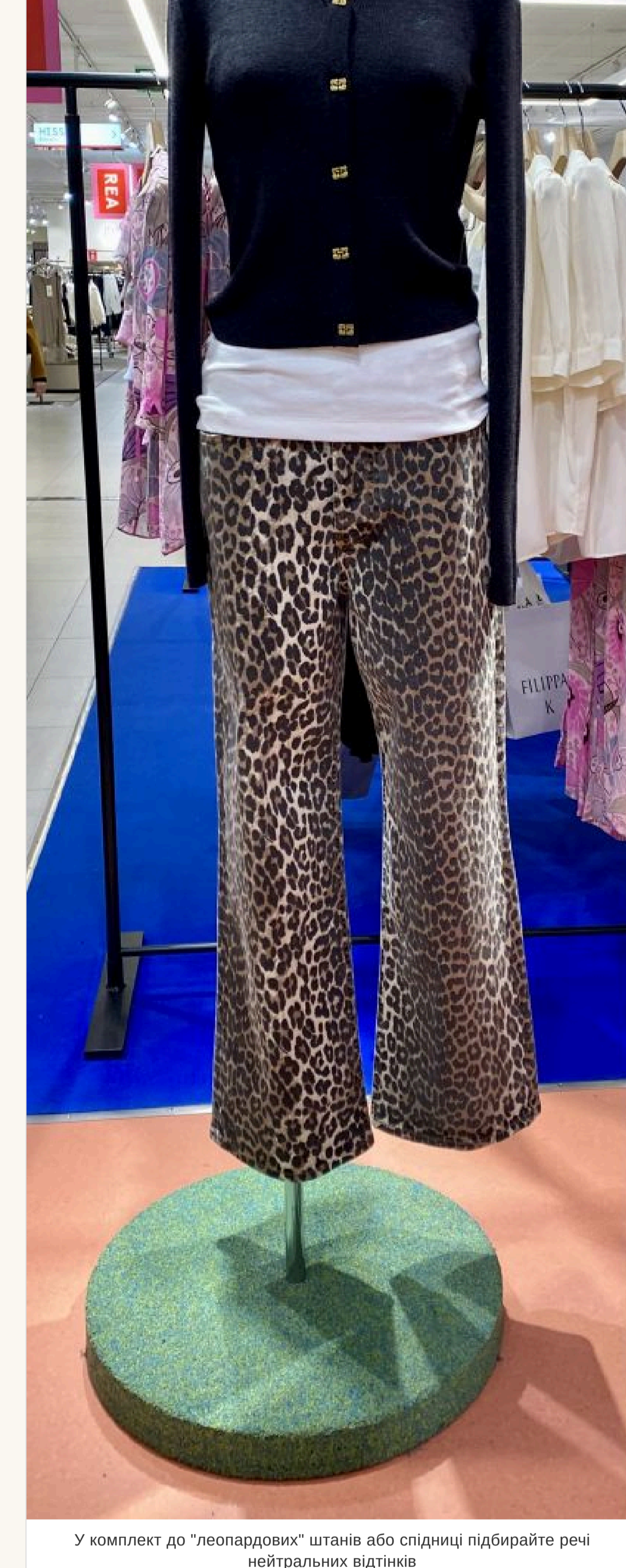
У комплект до "леопардових" штанів або спідниці підбирайте речі нейтральних відтінків

— Якщо така річ у вашому гардеробі — улюблена, носите із задоволенням. Але у комплект до «леопардових» штанів або спідниці підбирайте речі нейтральних відтінків і фасону, що не «контраст» — іншає буде перебір.