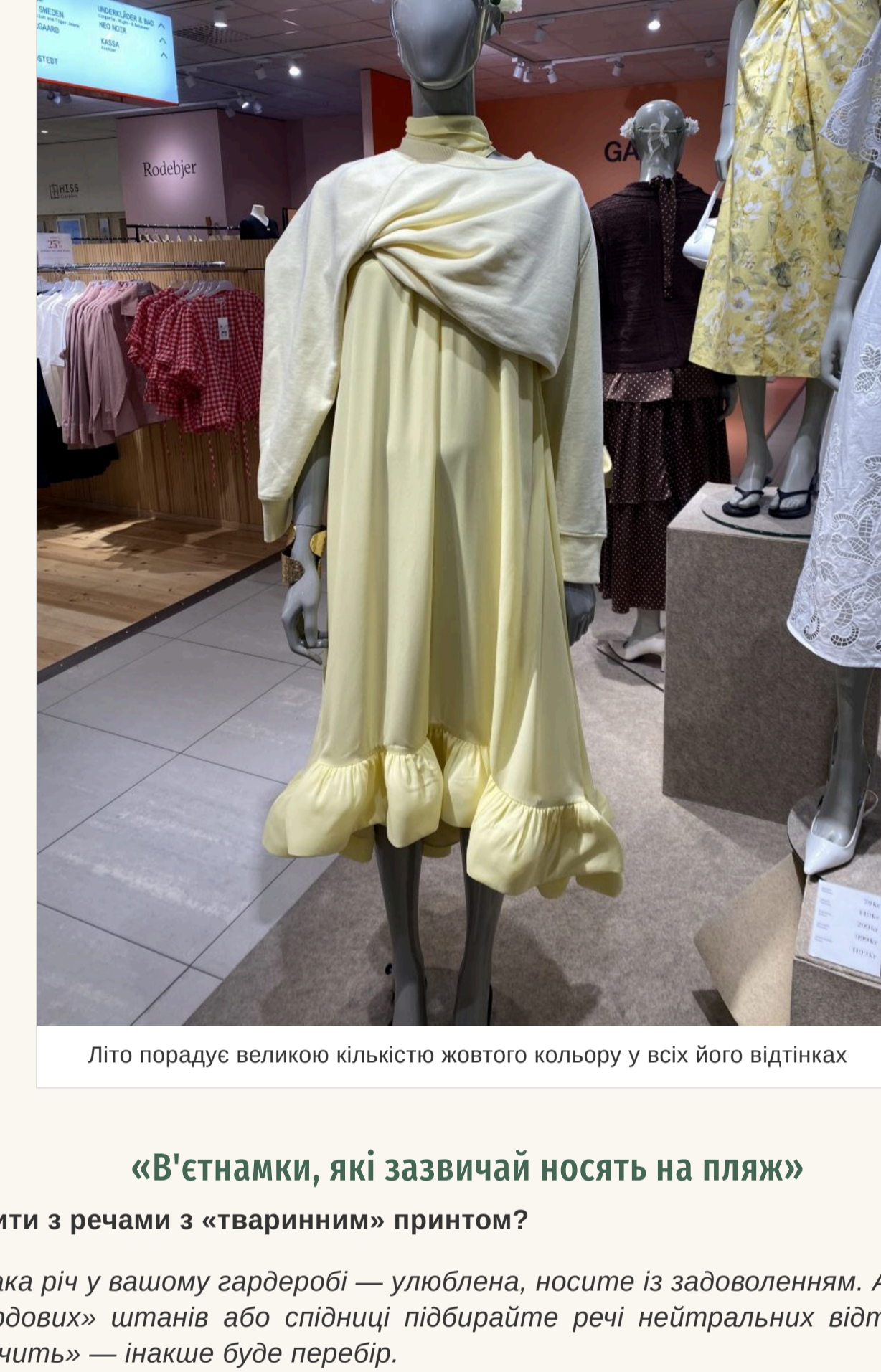
Літо порадує великою кількістю жовтого кольору у всіх його відтінках

Знову актуальна завищена талія та накладні кишені. Нікуди не зник 2020x — він став ще більшим у порівнянні з минулим сезоном. Що стосується клітчини, то вибирайте вбрання із кліткою середнього розміру, а ось її колір найкраще щоб був яскравим. Літо порадує великою кількістю жовтого кольору у всіх його відтінках. Білий — на піку популярності. Продовжує утримувати позиції та яскраво-червоної із білими. А ось популярний минулого літа коричневий поступається своїм місцем.