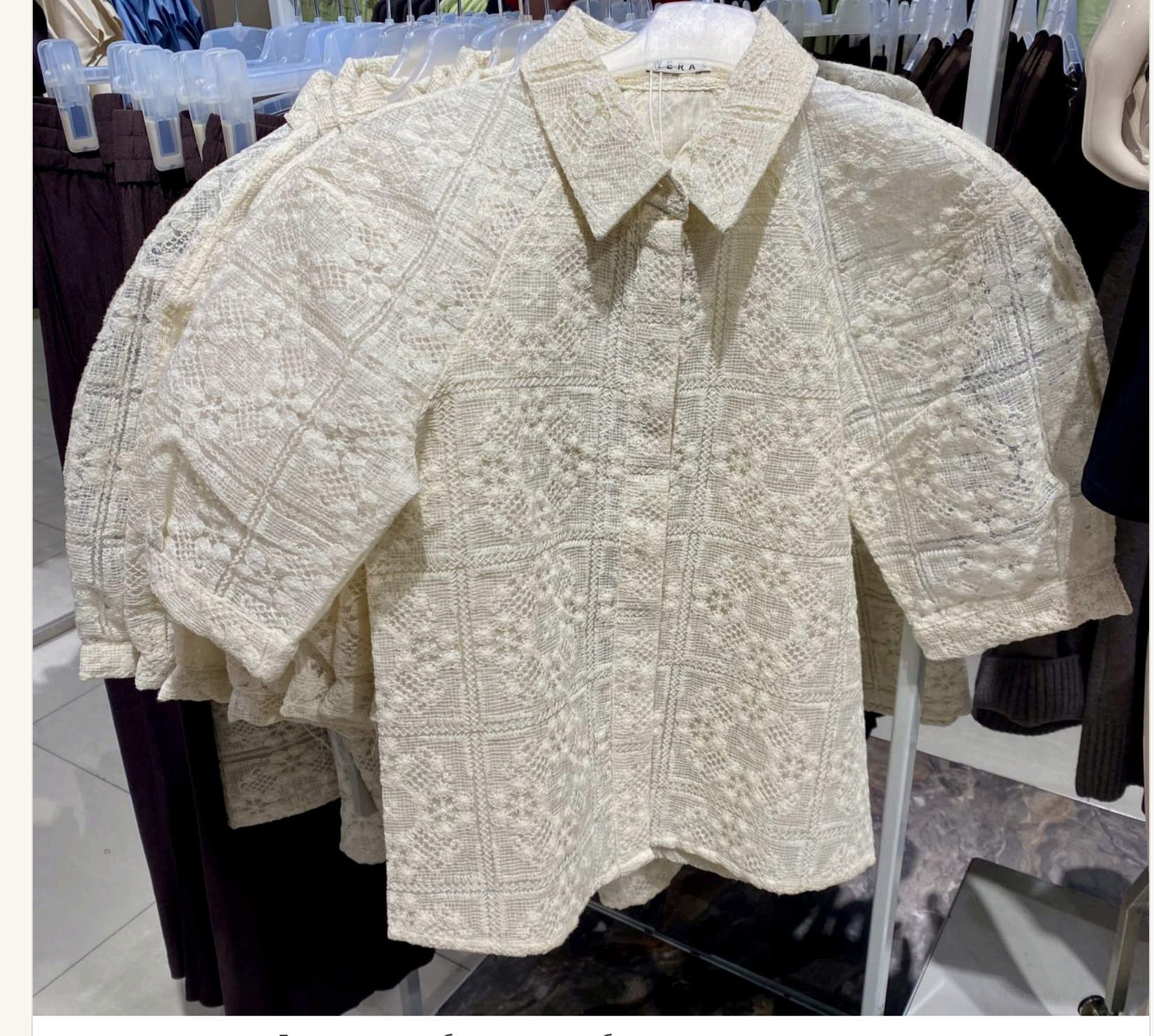
Доповнити улюблені джинси блузою з пишними рукавами

— Виходить, що так. Секрет лише в тому, чим «оновити» ці джинси, що під них одягнути. Наврядки зараз у моді бязатшовість. Якщо на джинси одягнути легку сіпвору або шовкову спідницю, це виглядатиме дуже актуально. Або блузу з пишними рукавами, об'ємний піджак. Не треба боятися виглядати не класично.