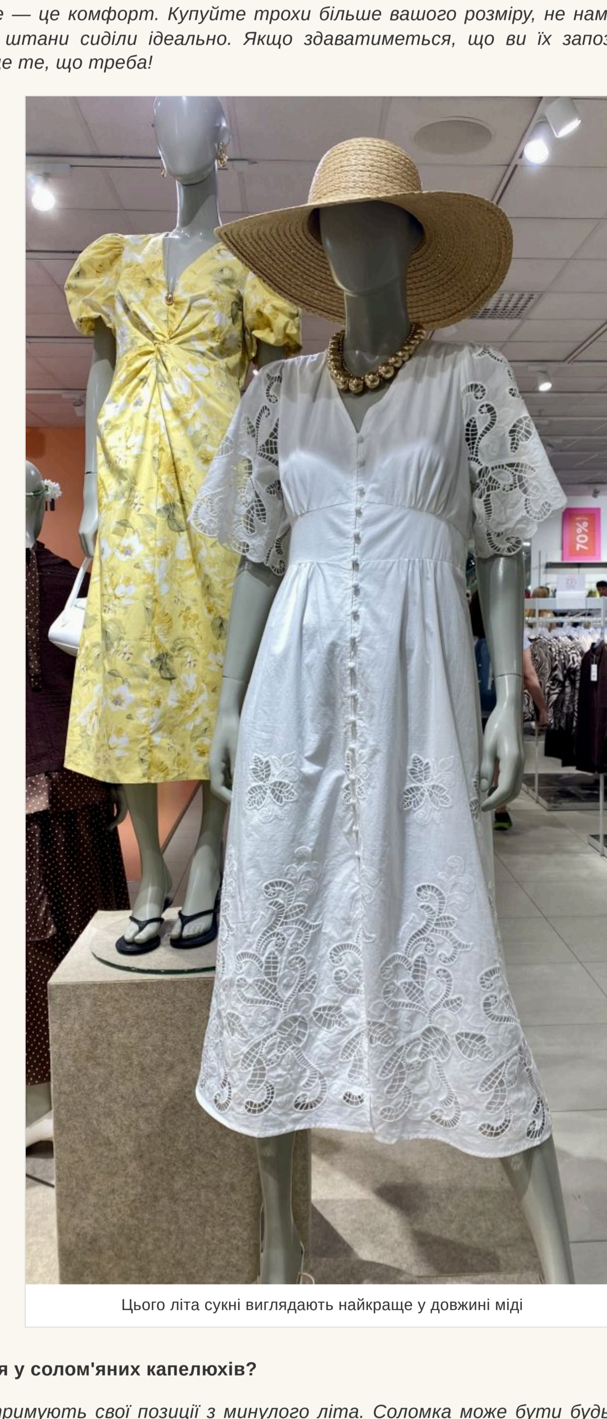
Цього літа сукні виглядають найкраще у довжині міді

— Яка довжина зараз актуальна? — Немає строгих канонів і в цьому. Джинсова спідниця може бути короткою на гудзик і трохи надикте. Звичайно, сукні виглядають найкраще у довжині міді.