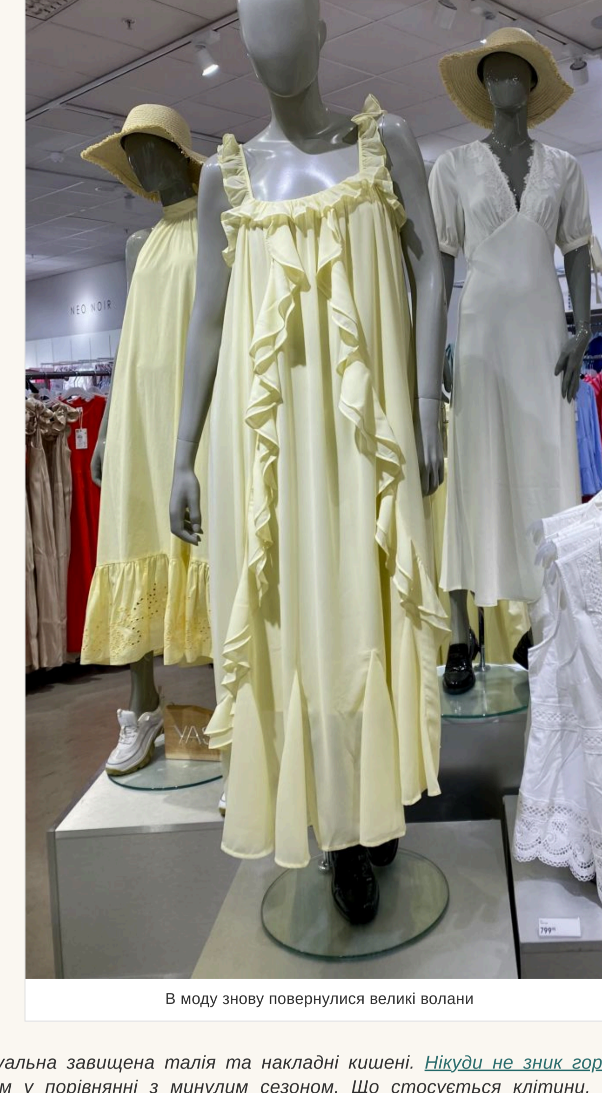
В моду знову повернулися великі волани

— Чи варто вибирати вбрання із квітковими принтами? — На сукнях такий принт завжди виглядає красиво та ніжно.