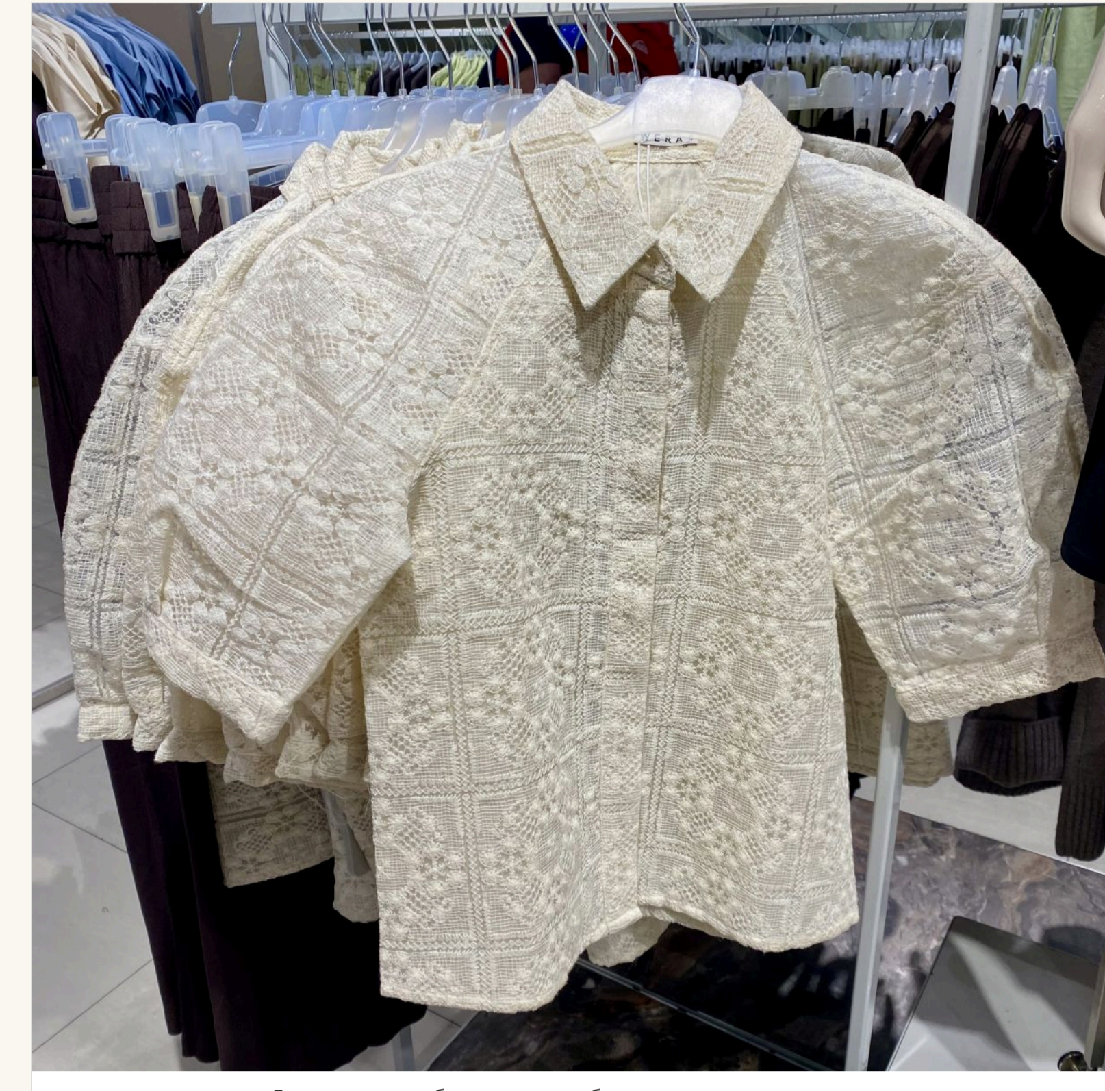
Доповнити улюблені джинси блузою з пишними рукавами

— Дар'є, яка рiч у лiтньому сезонi стала головною у гардеробi? — Та, яка найбільше вам подобається. Знаєте, я дотримуюся думки, що людина може сама вплинути на враження від свого образу.