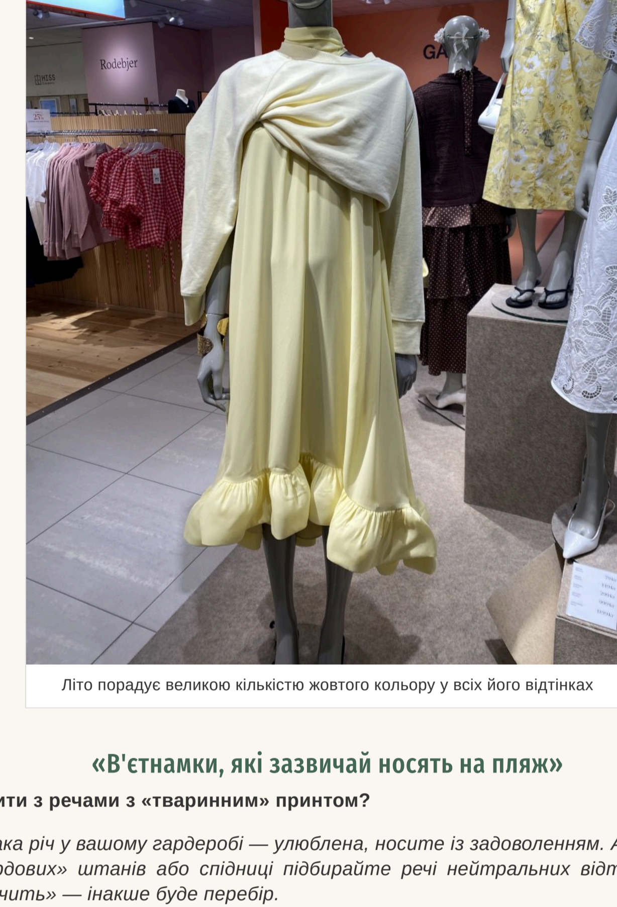
Літо порадує великою кількістю жовтого кольору у всіх його відтінках

Знову актуальна завищена талія та накладні кишені. Нікуди не зник 2020x — він став ще більшим у порівнянні з минулим сезоном.