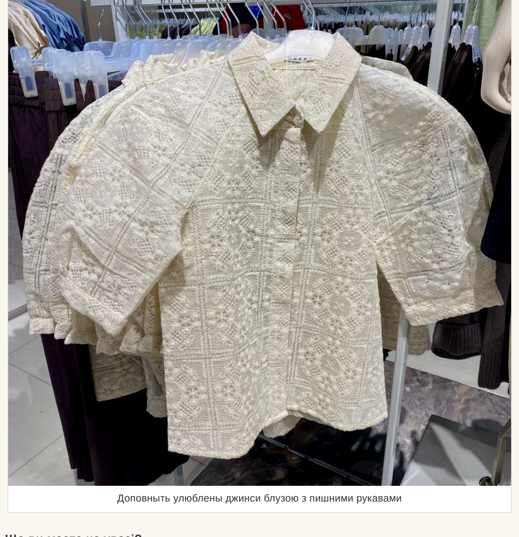
Доповнити улюблені джинси блузою з пишними рукавами

— Виходить, що так. Секрет лише в тому, чим «оновити» ці джинси, що під них одягнути. Наприклад, зараз у моді баззашаровість. Якщо на джинси одягнути легку шовкову або шовкову спідницю, це виглядатиме дуже актуально. Або блузу з пишними рукавами, об'ємний піджак. Не треба боятися виглядати не класично.