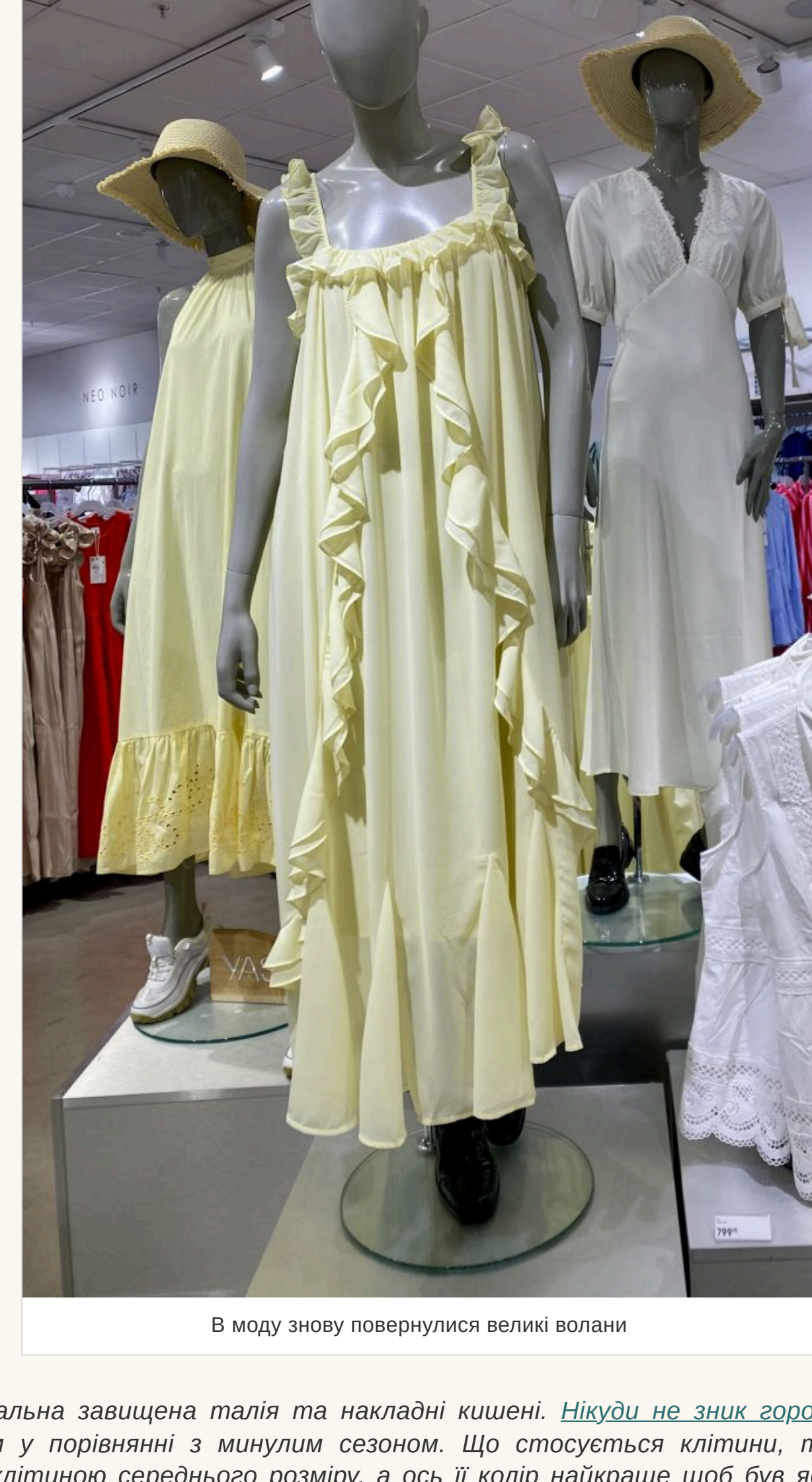
В моду знову повернулися великі волани

— На сухих такий принт завжди виглядає красиво та ніжно. Інше питання — наскільки квіти ідуть володарці такого вбрання. Скажімо, якщо дівчина невисокого зросту, то великі квіти їй не підійдуть, а от аріоні — саме те, що треба. І навпаки. Якщо говорити про фасони суконь, то в моду повернулися великі волани. Вони можуть прикрасити повні виробу, глибокий виріз чи рукав.