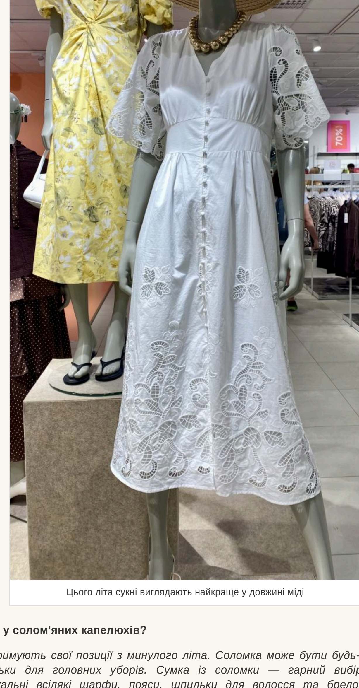
Цього літа сукні виглядають найкраще у довжні ніді

— Немає строгих канонів і в цьому. Джинсова спідниця може бути короткою на гудзик та не тільки для голявих уборів. Пювка із соломки — гарний вибір для сезону. А це актуальні всілякі шарфи, пояси, шпильки для волосся та брелоки для сумок та телефонів. У моді все, що може зробити ваш образ яскравішим і помітнішим. Літо тим і цінне, що можна дати волю своїм фантазіям та не ховати її за нудними пуховиками чи пальто. Життя надто складне і непереобуване, а мода — частина нашого психологічного розвантаження.