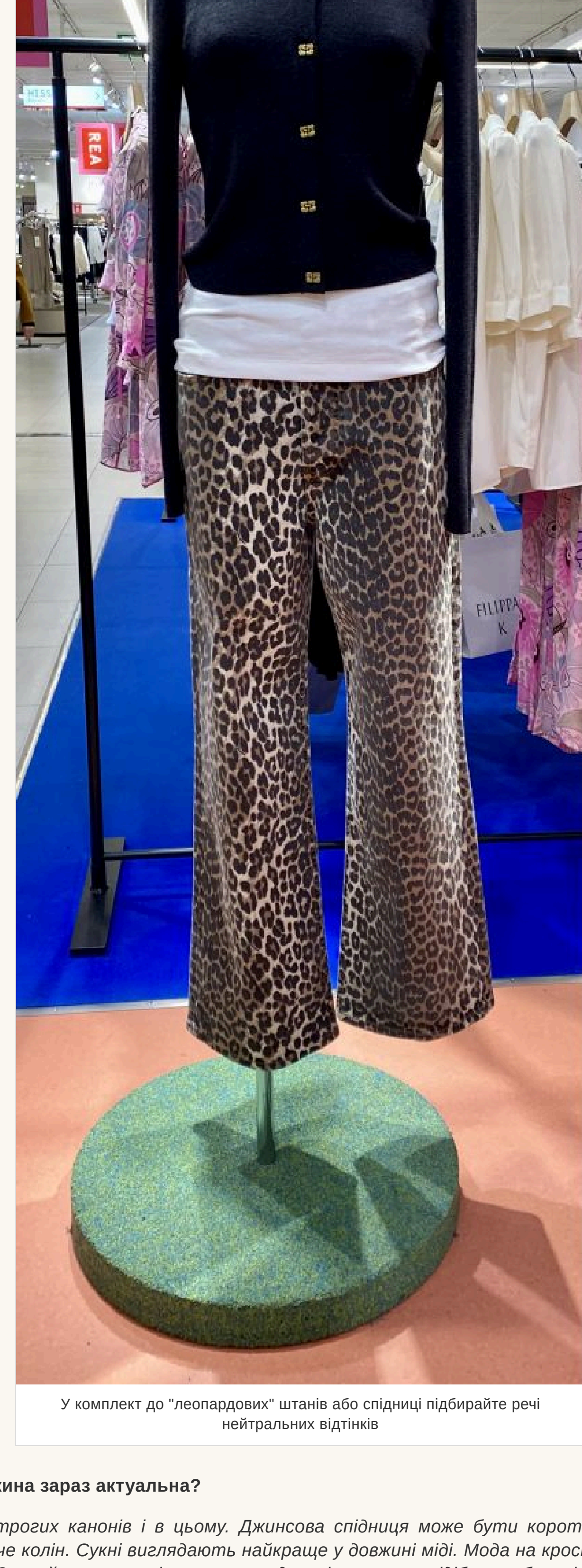
У комплект до "леопардових" штанив або спідниці підбирайте речі нейтральних відтінків

— Якщо така річ у вашому ардеробі — улюблена, носите із задоволенням. Але у комплект до «леопардових» штанив або спідниці підбирайте речі нейтральних відтінків і фасону, що не «кричить» — іншаке буде перебір.