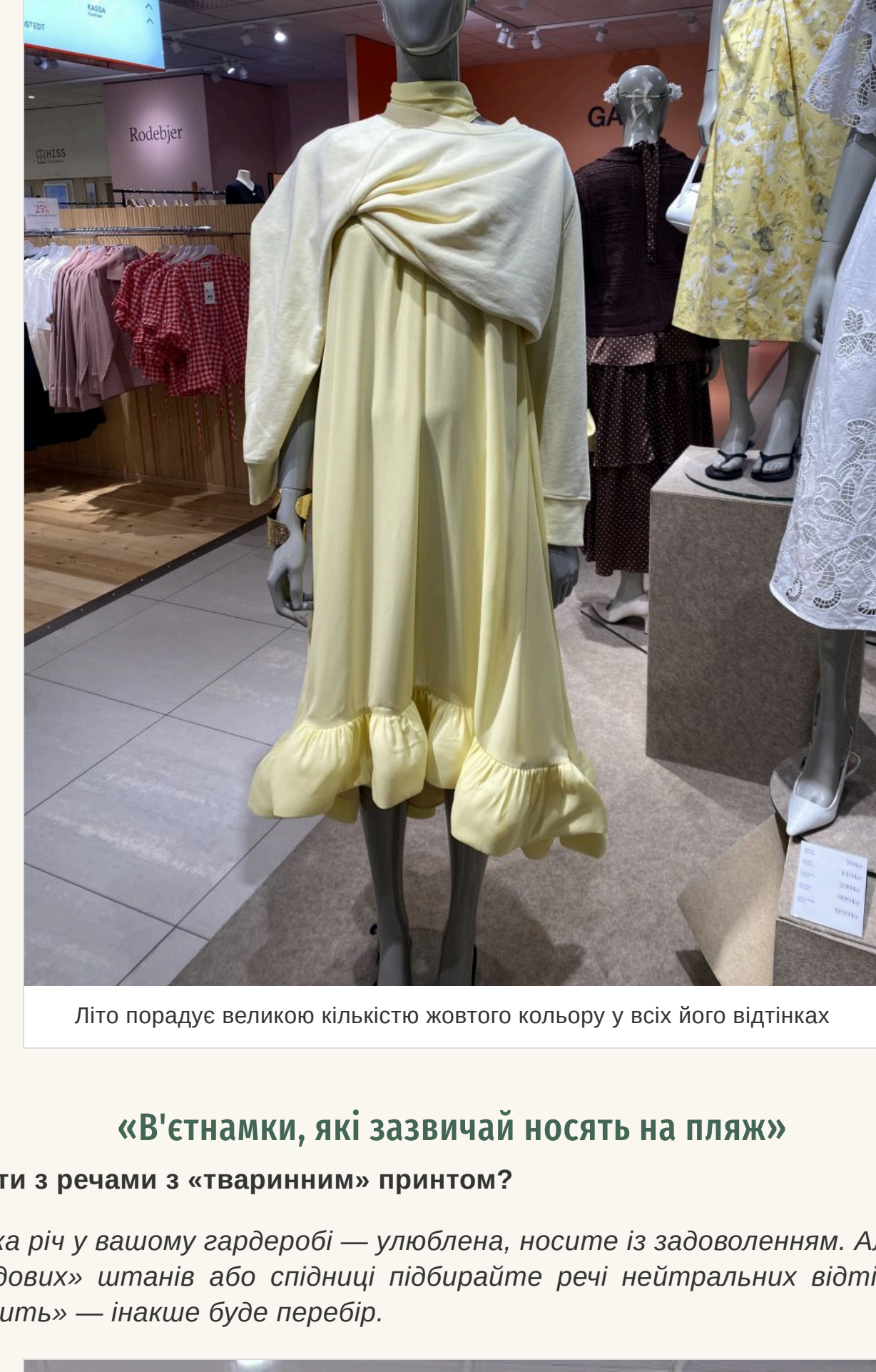
Літо порадує великою кількістю жовтого кольору у всіх його відтінках

Знову актуальна завищена талія та накладні кишені. Нікуди не зник 2000х — він став ще більшим у порівнянні з минулим сезоном. Що стосується кліпшини, то вибирайте вбрання із кліпшиною середнього розміру, а ось її колір найкраще щоб був яскравим. Літо порадує великою кількістю жовтого кольору у всіх його відтінках. Білий — на піку популярності. Продовжує утримувати позиції та яскраво-червоний із блакитним. А ось популярність минулого літа коричневий поступається своїм місцем.