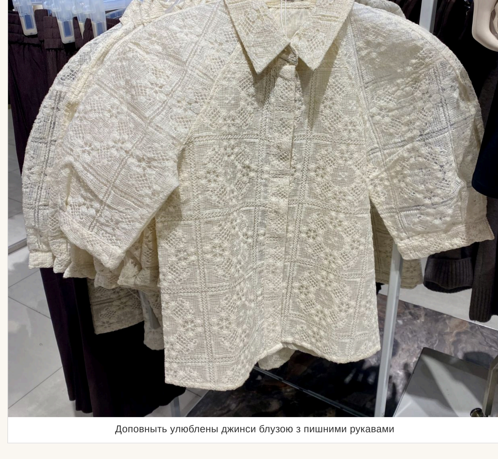
Доповнити улюблені джинси блузою з пишними рукавами

— Виходить, що так. Секрет лише в тому, чим «оновити» ці джинси, що під них одягнути. Наврядки, заради у моді багатозначність. Якщо на джинси одягнути легку сілпору або шовкову спідницю, це виглядатиме дуже актуально. Або блузу з пишними рукавами, об'ємний піджак. Не треба боятися виглядати не класично.