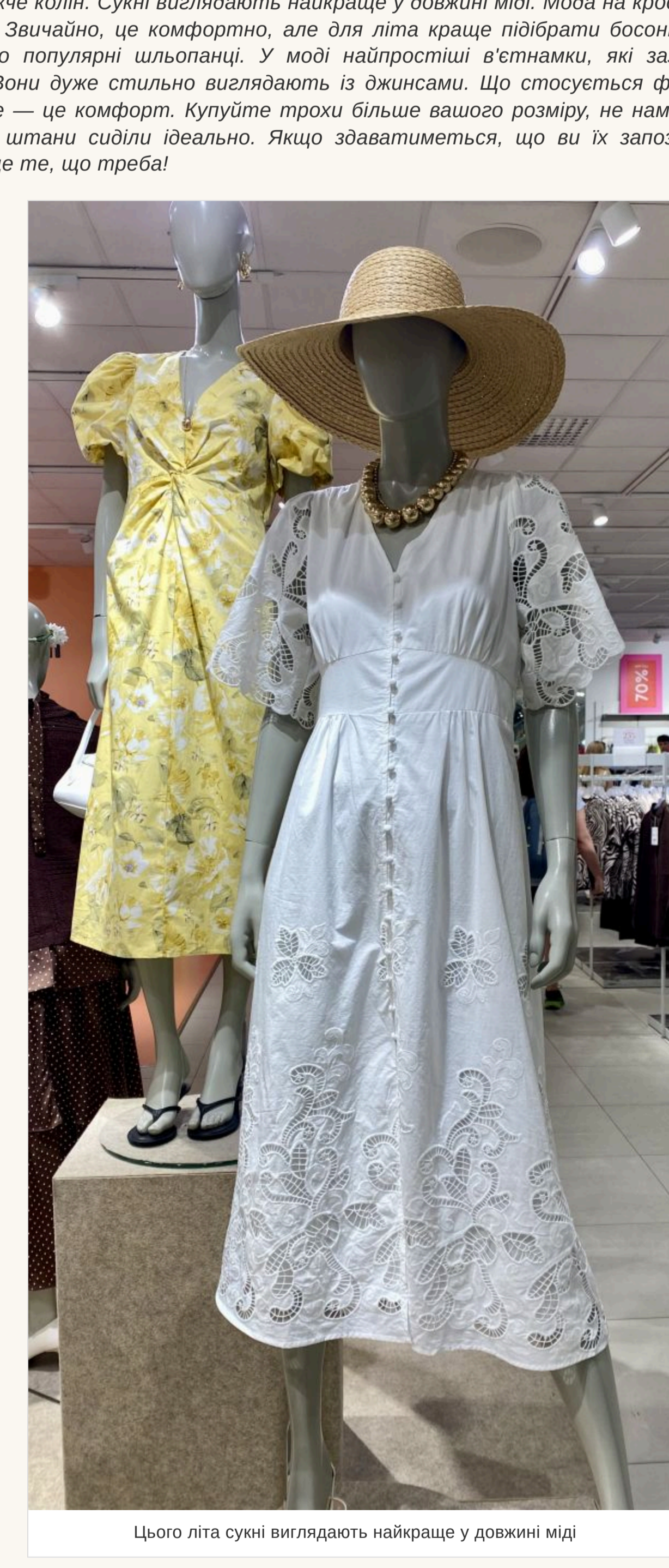
Цього літа сукні виглядають найкраще у довжінні між коліні та колоски

— Яка довжина зараз актуальна? — Немає строгих канонів і в цьому. Джинсова спідниця може бути короткою на гудзик і трішки нижче коліні. Сукні виглядають найкраще у довжину між коліні та колоски із сукнями відкритою або зав'язаною, це комфортно, але для літа краще підібрати босоніжки на низькій підсош або популярні шльопанці. У моді найпростіші в'єтнамки, які зазвичай носять на пляжі. Вони дуже стільно виглядають із джинсами. Що стосується фасонів штанив, то головне — це комфорт. Купуйте трохи більше вашого розміру, не намагайтеся, щоб одягати чи штани сиділи ідеально. Якщо здаватиметься, що ви їх запозичили у свого хлопця — це те, що треба!