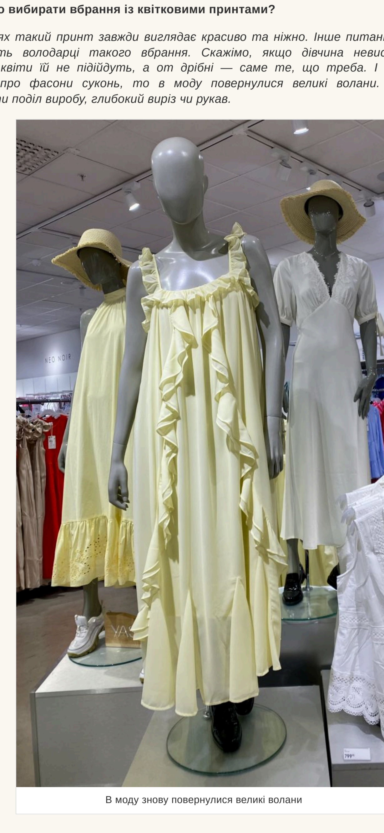
В моду знову повернулися великі волани

— Чи варто вибирати вбрання із квітковими принтами? — На сухих такий принт завжди виглядає скучно та ніжно. Іще питання — наскільки квіти ідуть володарці такого вбрання. Скажимо, якщо дівчина невисокого зросту, то великі квіти їй не підійдуть, а от дрібні — саме те, що треба. І навпаки. Якщо говорити про фасони суконь, то в моду повернулися великі волани. Вони можуть прикрашати поділ виробу, глибокий виріз чи рукав.