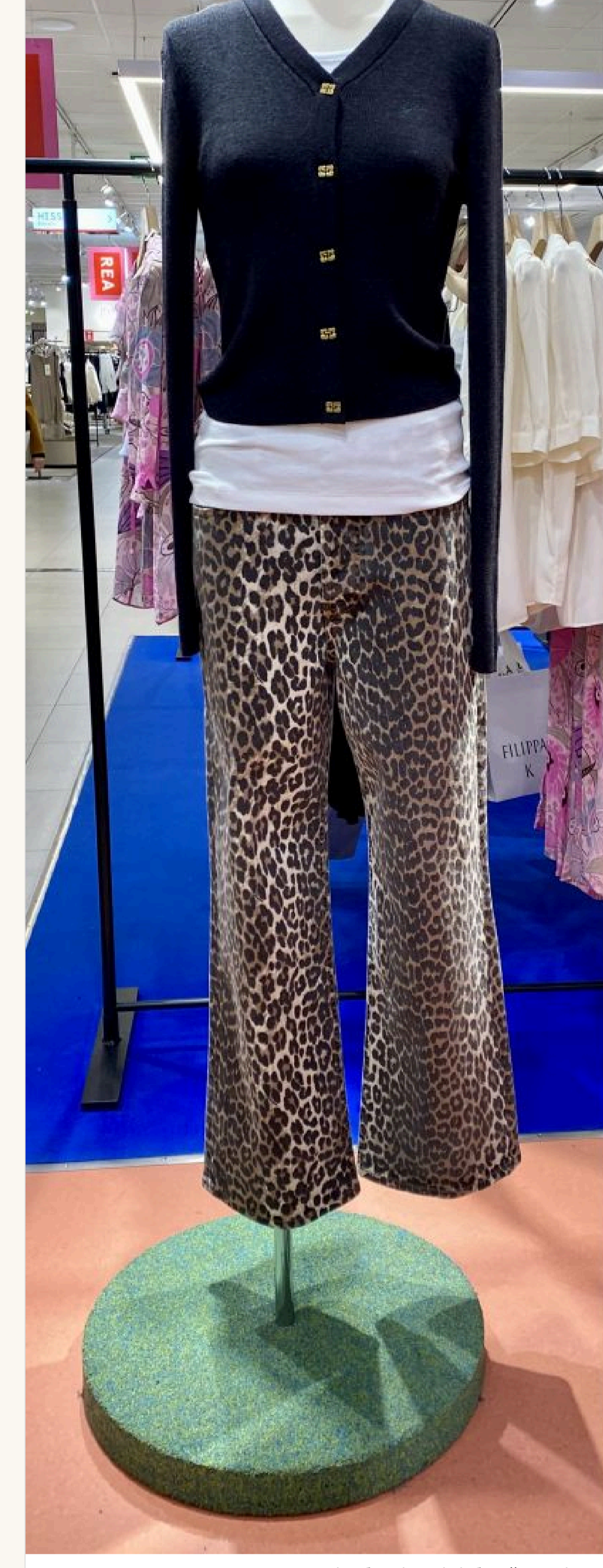
У комплект до «леопардових» штанив або спідниці підбирайте речі нейтральних відтінків

— Що робити з речами з «тваринним» принтом? — Якщо така рiч у вашому гардеробi — улюблена, носите із задоволенням. Але у комплект до «леопардових» штанив або спідниці підбирайте речі нейтральних відтінків і фасону, що не «кричить» — інакше буде перебір.