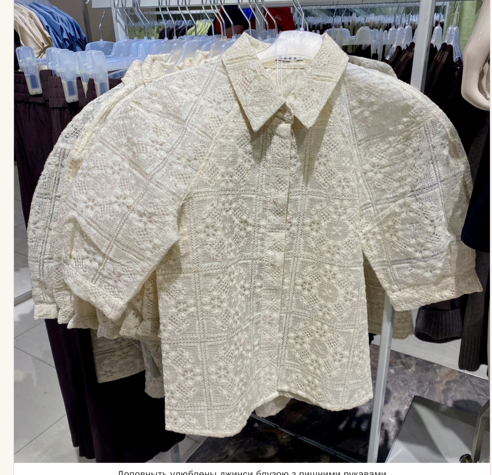
Доповнюють улюблені джинси блузою з пишними рукавами

— Значить, сміливо можна одягати улюблені джинси, яким вже років п'ять? — Висловити, що так. Секрет лише в тому, чим «новітні» ці джинси, що лiд них одягнуті. Наприклад, зараз у модi базовошаровість. Якщо на джинси одягнути легку отвору або шовкову спідницю, це виглядатиме дуже актуально. Або блузу з пишними рукавами, об'ємний піджак. Не треба боятися виглядати не класично.