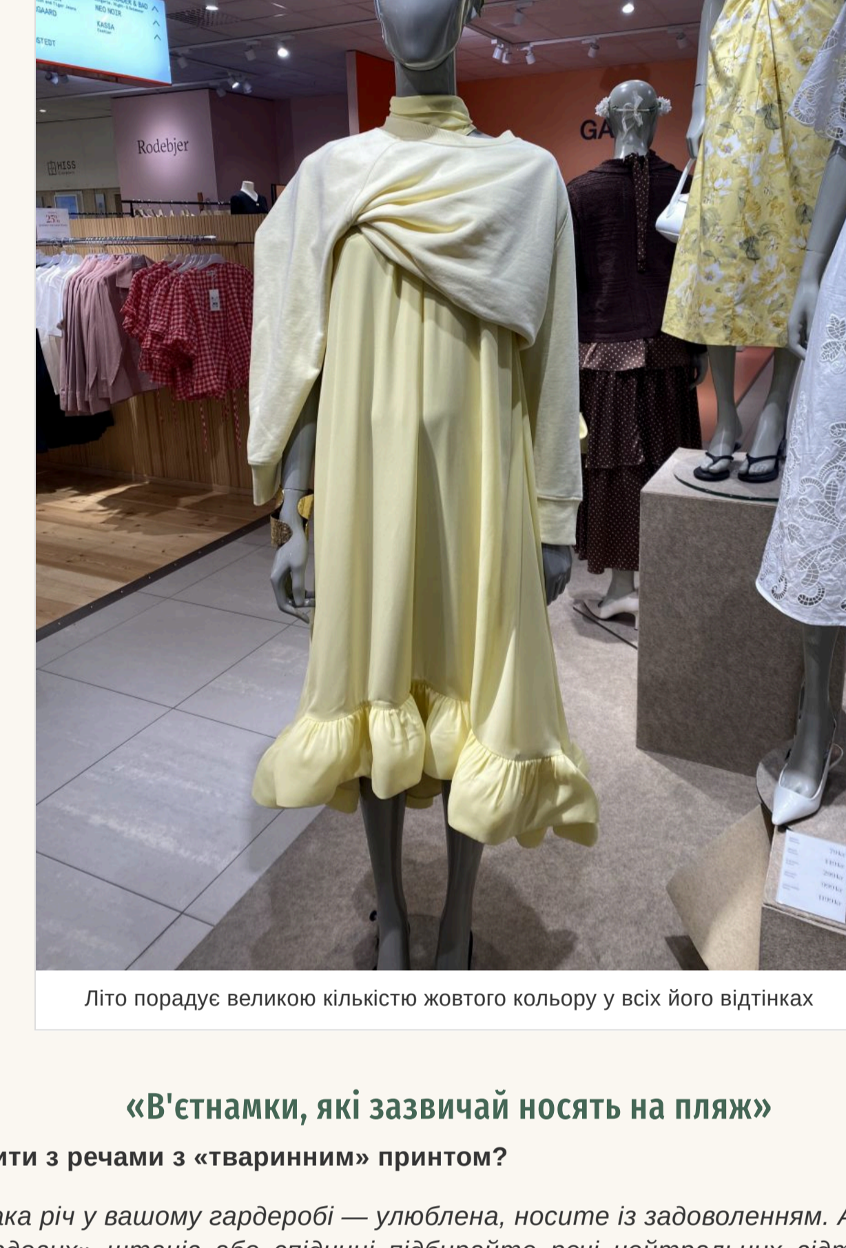
Літо порадує великою кількістю жовтого кольору у всіх його відтінках

Знову актуальна завичена талія та накладні кишені. Нікуди не зник зорох — він став ще більшим у порівнянні з минулим сезоном. Що стосується клітчини, то вибирайте вбрання із кліткою середнього розміру, а ось її колір найкраще щоб був яскравим. Літо порадує великою кількістю жовтого кольору у всіх його відтінках. Білий — на його популярності. Продовжує утримувати позиції та яскраво-червоний із блакитним. А ось популярний минулого літа коричневий поступається своїм місцем.