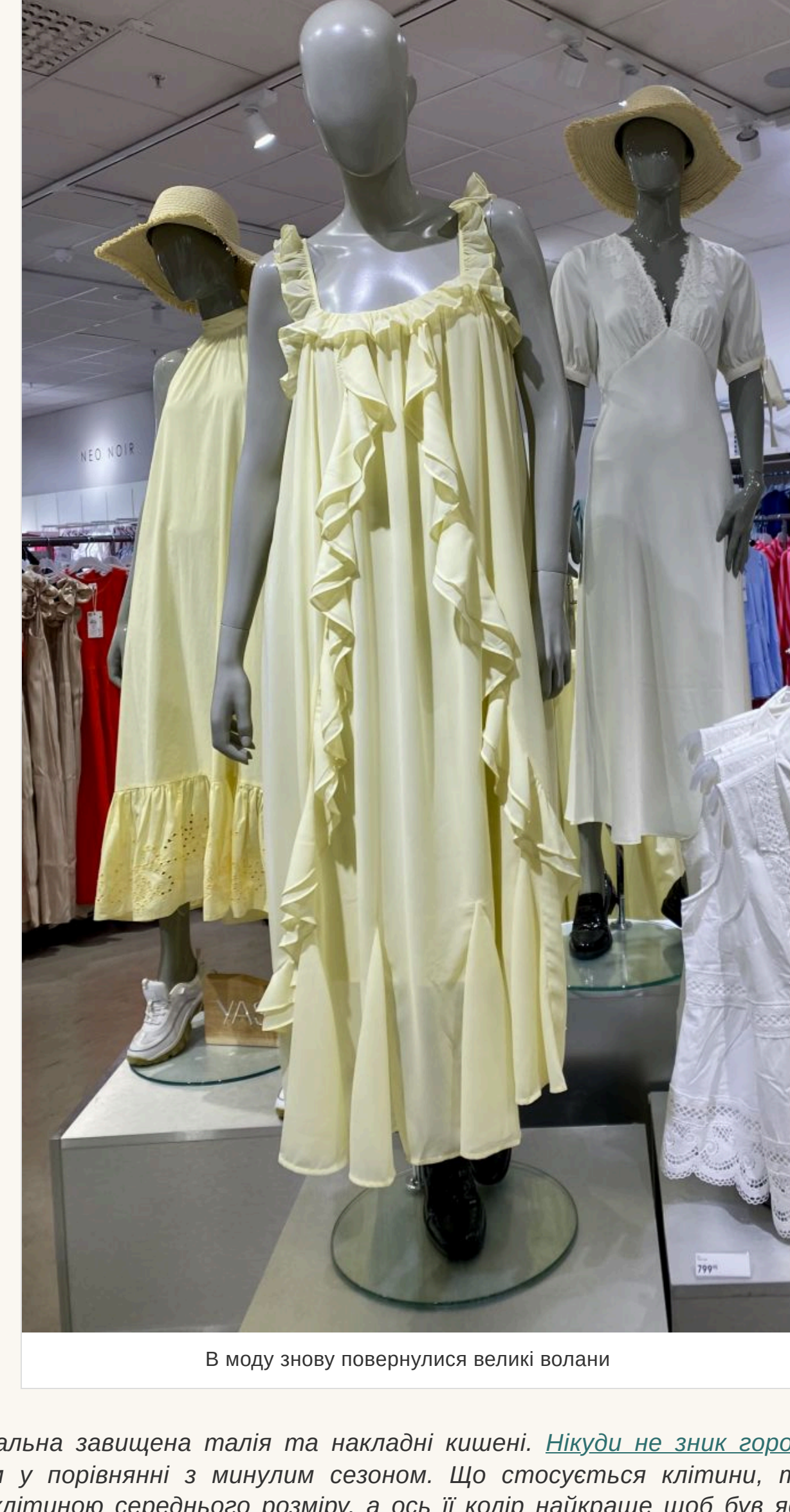
В моду знову повернулися великі волани

— На сукнях такий принт завжди виглядає красиво та ніжно. Інше питання — наскільки квіти їдуть володарці такого вбрання. Скажімо, якщо дівчина невисокого зросту, то великі квіти їй не підійдуть, а от ароні — саме те, що треба. І навпаки. Якщо зоворити про фасони суконь, то в моду повернулися великі волани. Вони можуть прикрасити повіль виробу, глибокий виріз чи рукав.