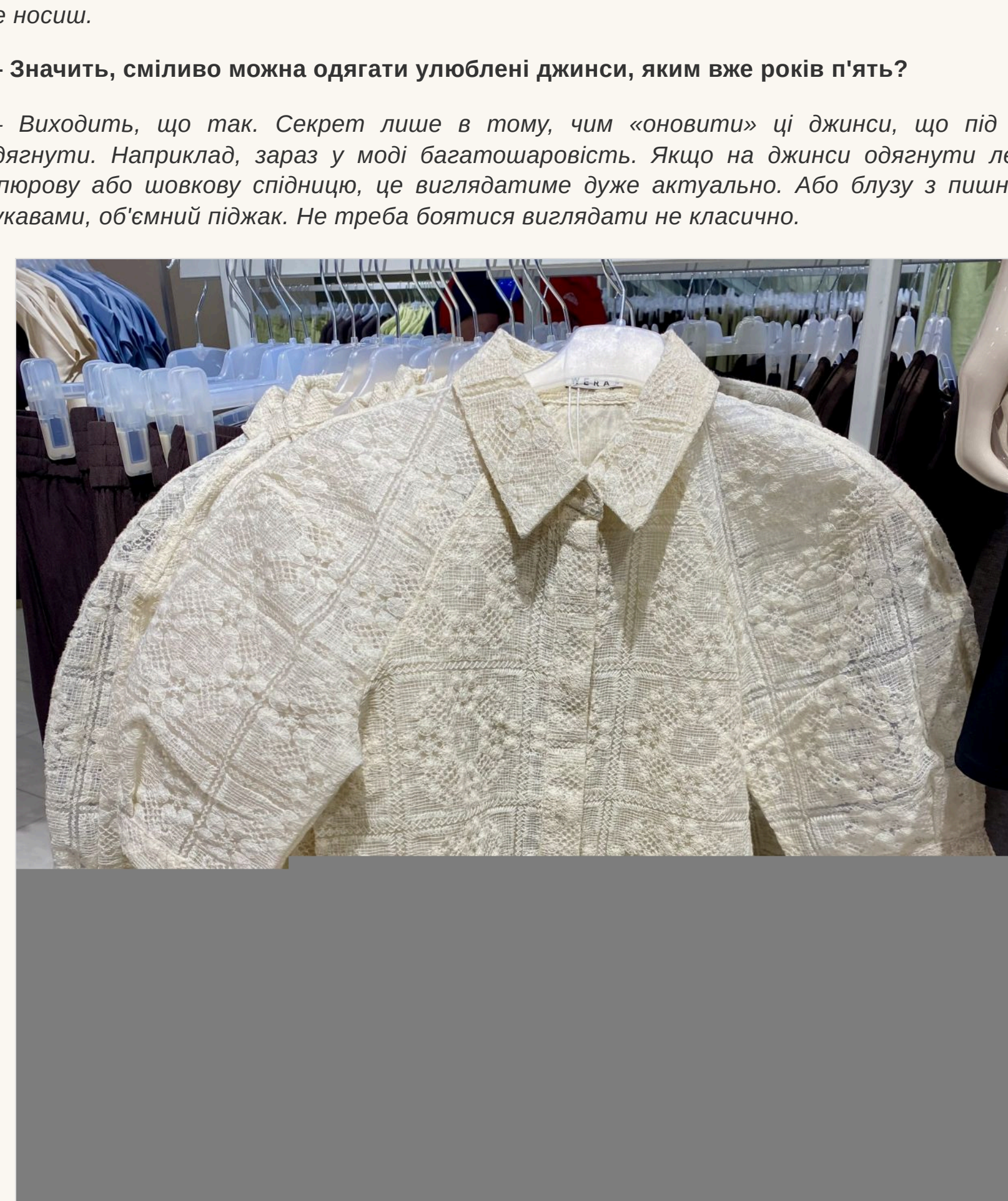
Доповнить улюблені джинси блузою з пишними рукавами

— Виходить, що так. Секрет лише в тому, чим «оновити» ці джинси, що під них одягнути. Наприклад, зараз у моді баззашаровість. Якщо на джинси одягнути легку сукню або шовкову спідницю, це виглядатиме дуже актуально. Або блузу з пишними рукавами, об'ємний піджак. Не треба боятися виглядати не класично.