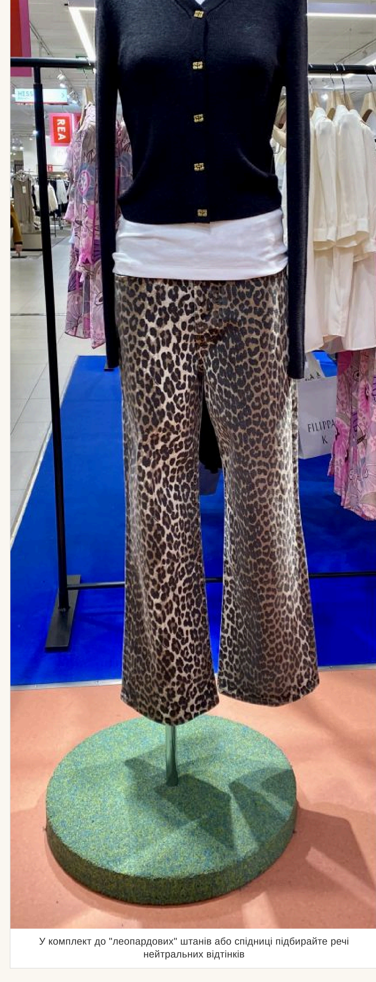
У комплект до "леопардових" штанів або спідниць підбавряйте речі нейтральних відтінків

— Якщо така річ у вашому ардеробі — улюблена, носите із задоволенням. Але у комплект до «леопардових» штанив або спідниць підбавряйте речі нейтральних відтінків і фасону, що не «кричить» — наікше буде перебір.