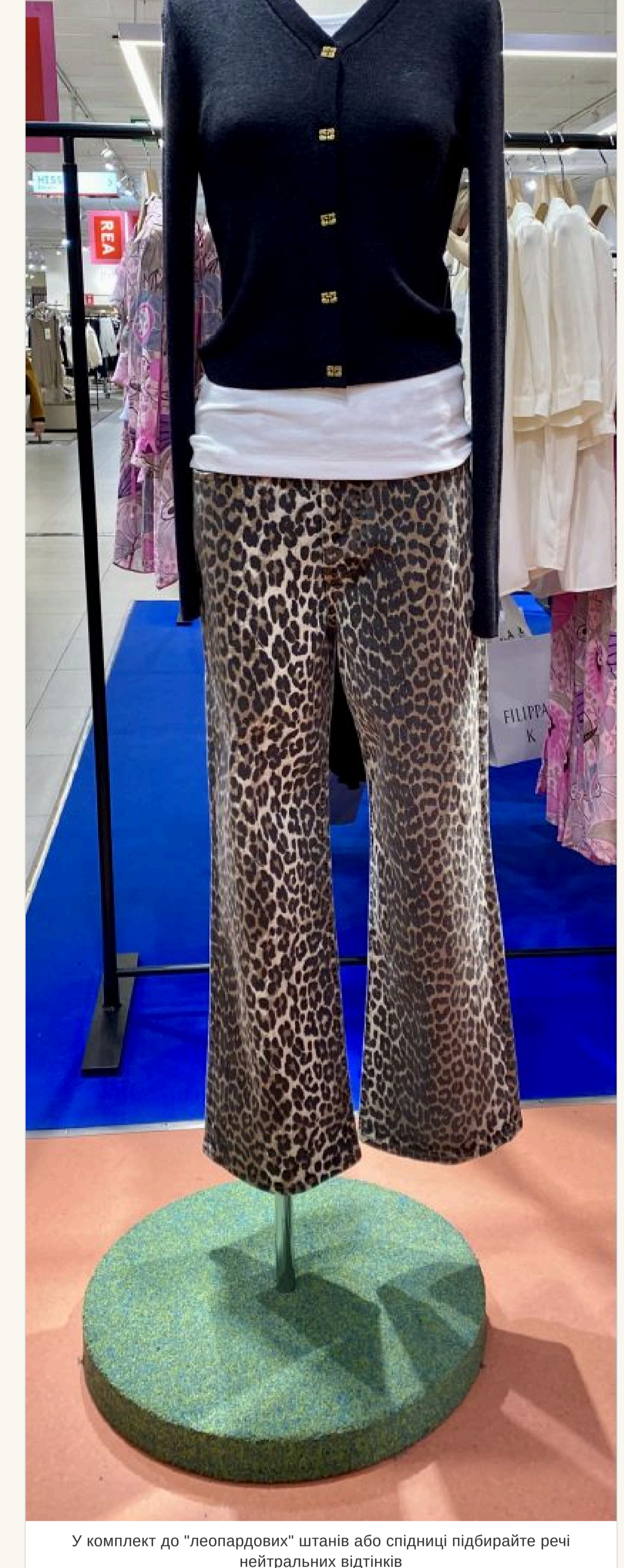
У комплект до «леопардових» штанив або спідниці підбирайте речі нейтральних відтінків

— Якщо така річ у вашому гардеробі — улюблена, носите із задоволенням. Але у комплект до «леопардових» штанив або спідниці підбирайте речі нейтральних відтінків і фасону, що не «контраст» — інакше буде перебір.