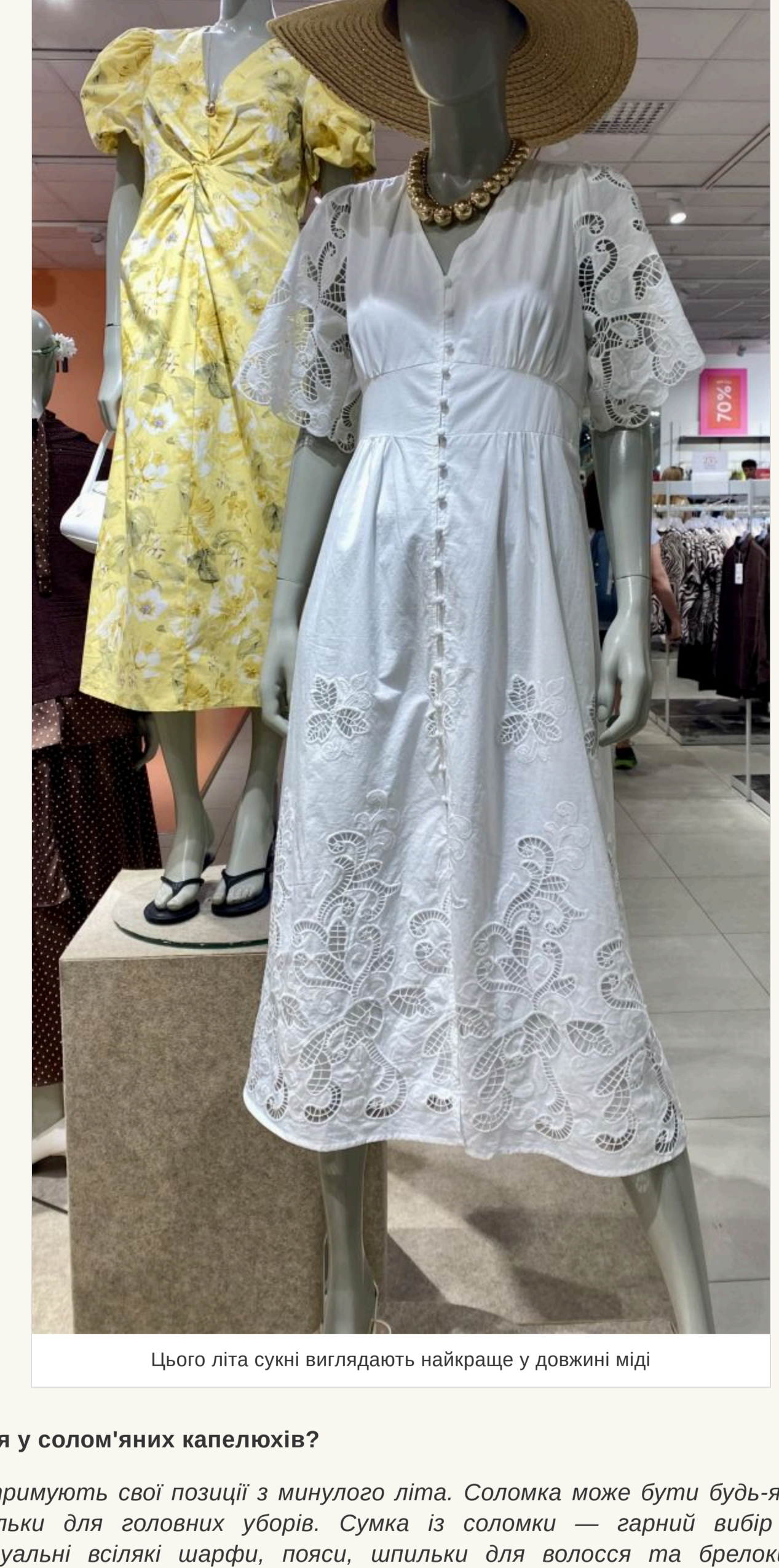
Цього літа сукні виглядають найкраще у довжині міді

— Немає строгих канонів і в цьому. Джинсова спідниця може бути короткою на гудзик і трохи нижче колін. Сукні виглядають найкраще у довжині міді. Мода на кроєвці із сукнями відходить. Звичайно, це комфортно, але для літа краще підібрати босоніжки на низькій підставі або популярні шльопанці. У моді найпростіші в'єтнамки, які зазвичай носять на пляжі. Вони дуже стильно виглядають із джинсами. Що стосується фасонів штанив, то головне — це комфорт. Купуйте трохи більше вашого розміру, не намагайтеся, щоб джинси чи штани сиділи ідеально. Якщо здаватиметься, що ви їх зазичили у свого хлопця — це те, що треба!