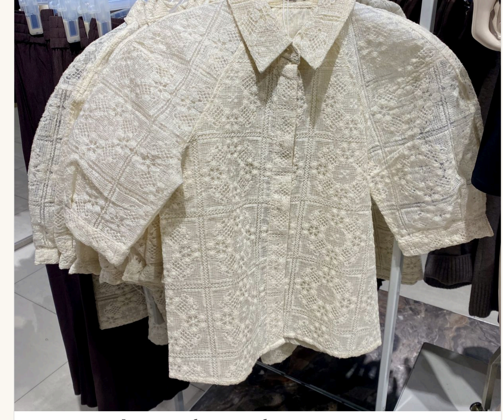
Доповнити улюблені джинси блузою з пишними рукавами

— Виходить, що так. Секрет лише в тому, чим «оновити» ці джинси, що під них одягнути. Наврядки зараз у моді базисність. Якщо на джинси одягнути легку сілшову або шовшову спідницю, це виглядатиме дуже актуально. Або блузу з пишними рукавами, об'ємний піджак. Не треба боятися виглядати не класично.