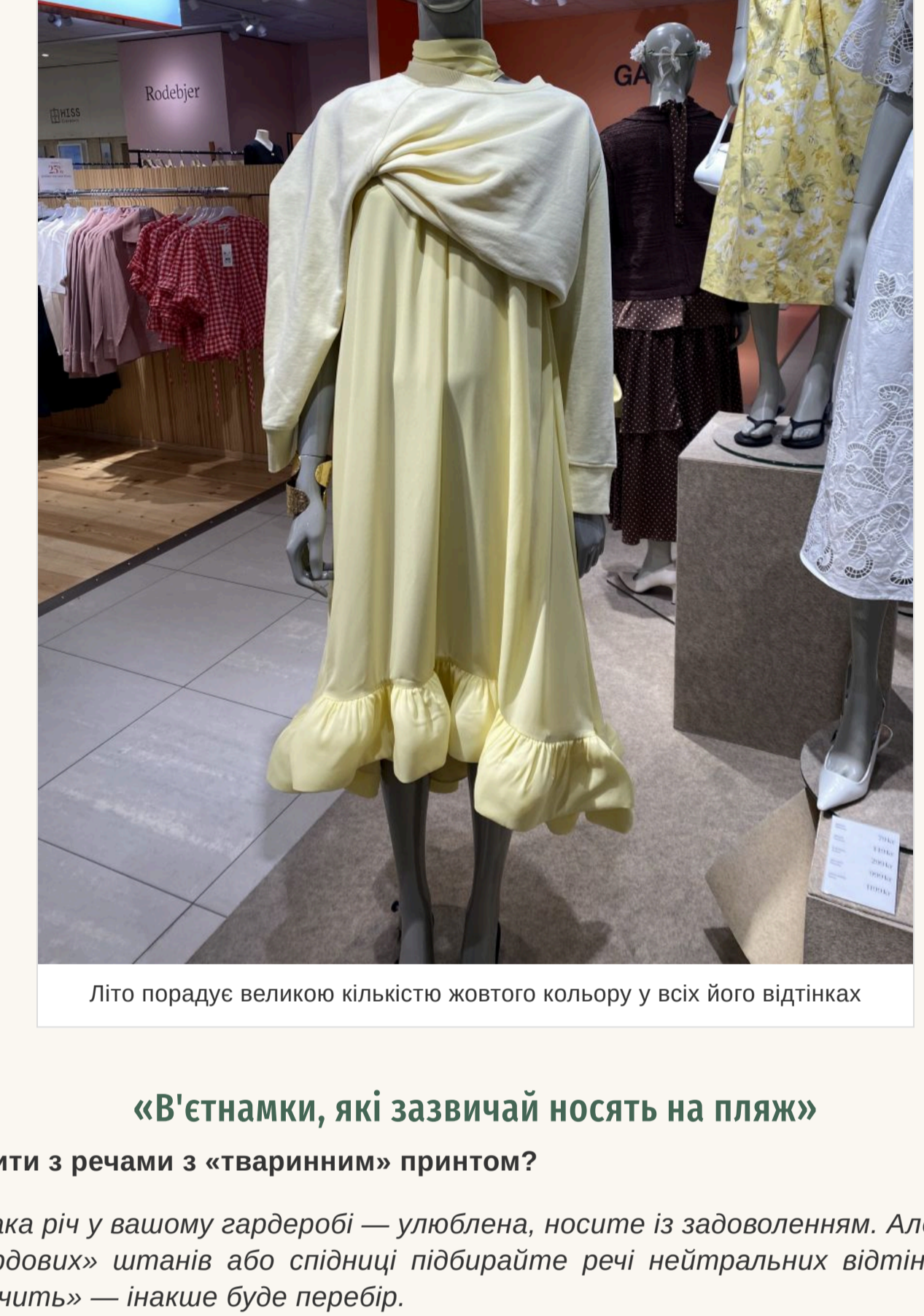
Літо порадує великою кількістю жовтого кольору у всіх його відтінках

Знову актуальна завищена талія та накладні кишені. Нікуди не зник 2020x — він став ще більшим у порівнянні з минулим сезоном. Що стосується клітчини, то вибирайте вбрання із клітинкою середнього розміру, а ось її колір найкраще щоб був яскравим. Літо порадує великою кількістю жовтого кольору у всіх його відтінках. Білий — на піку популярності. Продовжує утримувати позиції та яскраво-червоної із білими. А ось популярний минулого літа коричневий поступається своїм місцем.