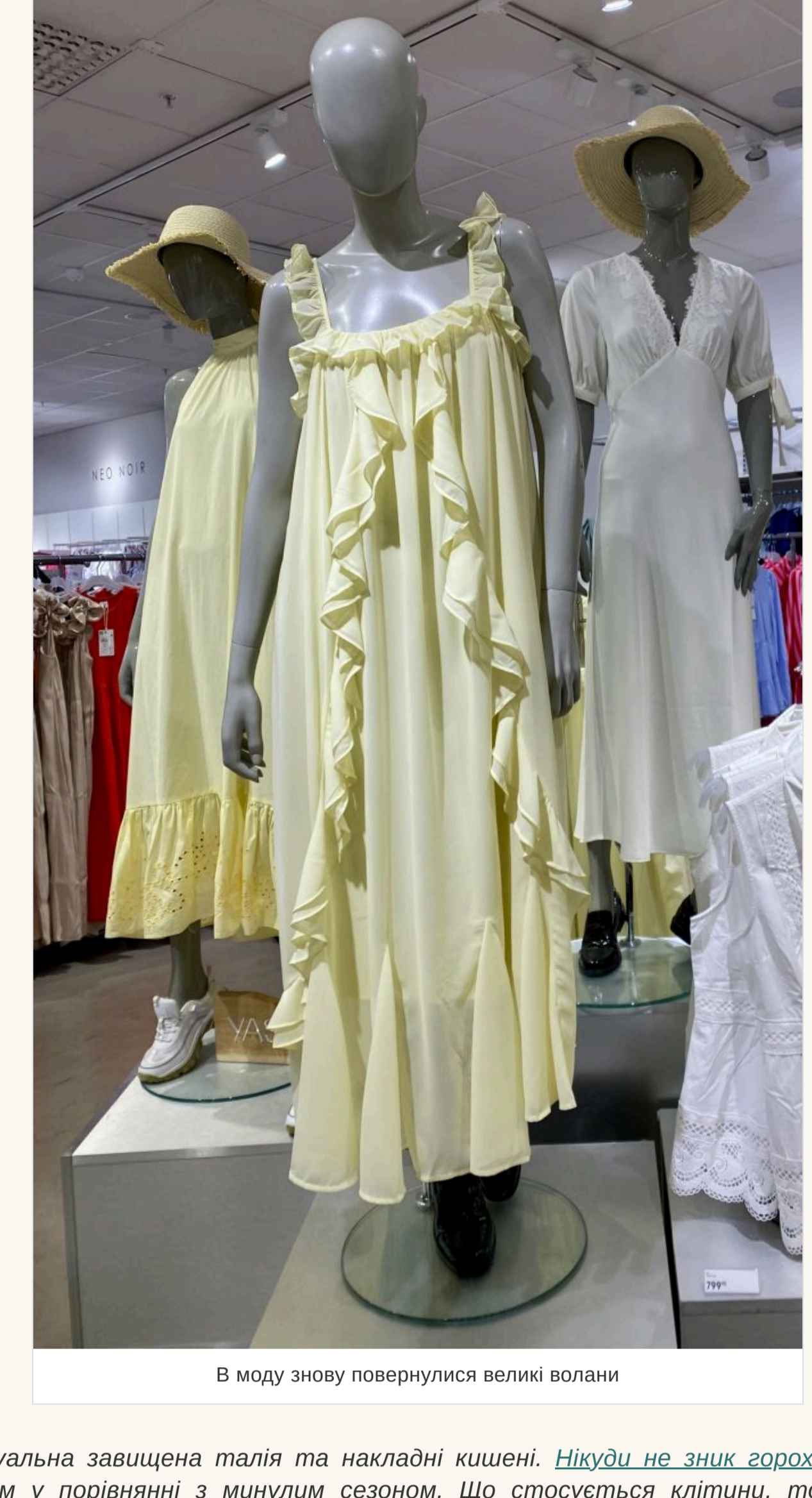
В моду знову повернулися великі волани

— На сукнях такий принт завжди виглядає красиво та ніжно. Інше питання — наскільки квіти йдуть володарці такого вбрання. Скажимо, якщо дівчина невисокого зросту, то великі квіти їй не підійдуть, а от дрібні — саме те, що треба. І навпаки. Якщо говорити про фасони суконь, то в моду повернулися великі волани. Вони можуть прикрасити поділ виробу, глибокий виріз чи рукав.