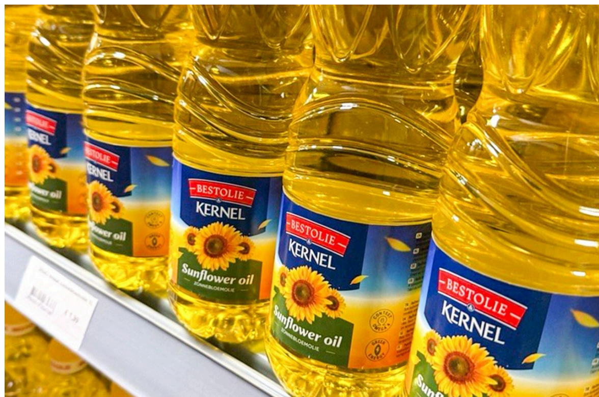
Олія виробництва "Кернел" продається у Європі під брендом Bestolie&Kernel (фото: пресслужба "Кернел")

"Кернел" відповідає за виробництво та контроль якості продукції на всіх етапах - від насіння до готової олії, що підтверджено сертифікаціями ISO 9001 та ISO 22000. В свою чергу Fango&Zon Impex забезпечує дистрибуцію на локальному ринку.