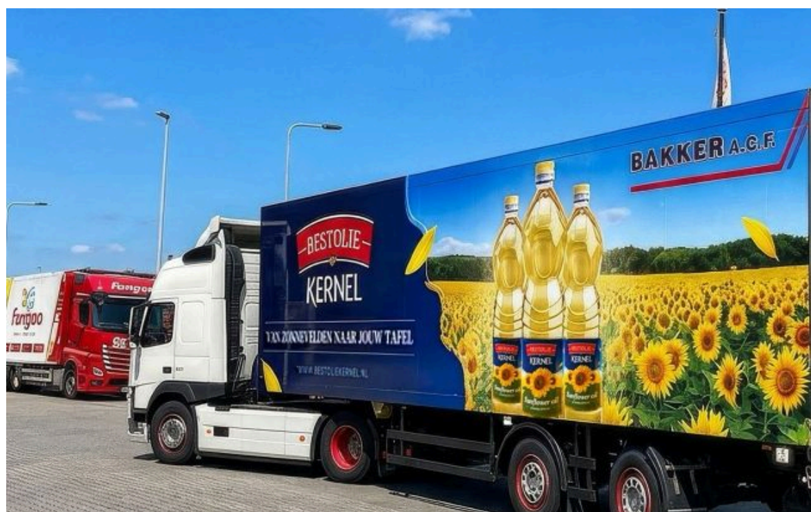
"Кернел" наростив продажі олії в Нідерландах

Не витрачай час на шум! Читай тільки суть з РБК-Україна у Google