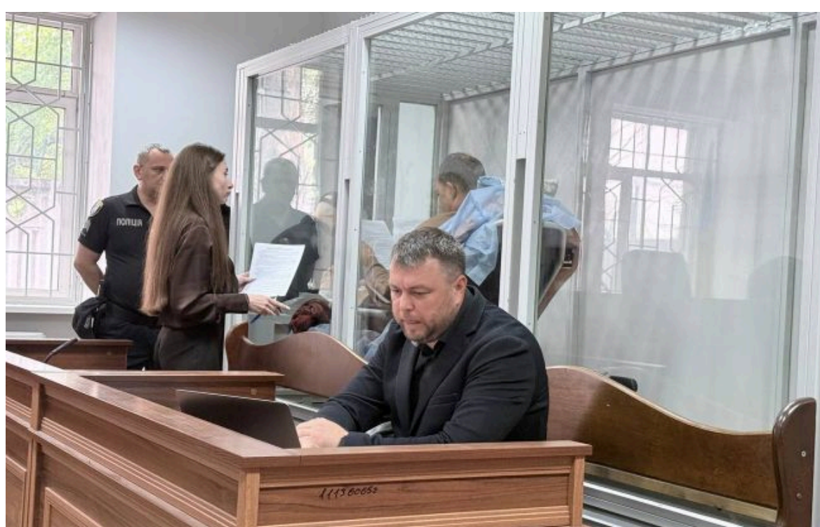
Фото: водію, який влетів у перехід з людьми у Києві, обрали запобіжний захід (t.me/rbko_gov_ua)