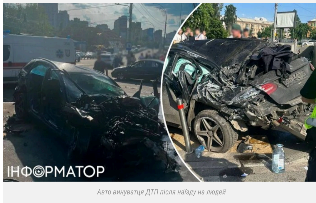
Авто винуватця ДТП після наїзду на людей

Унаслідок ДТП загинули четверо пішоходів – двоє дільничних офіцерів поліції, жінка та 12-річний хлопчик. Ще троє людей отримали травми.