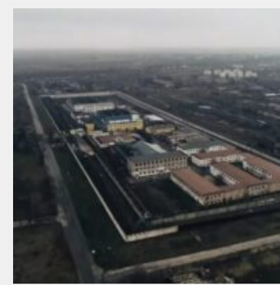
Російські загарбники перетворили Бердянську колонію № 77 на катівню для українців