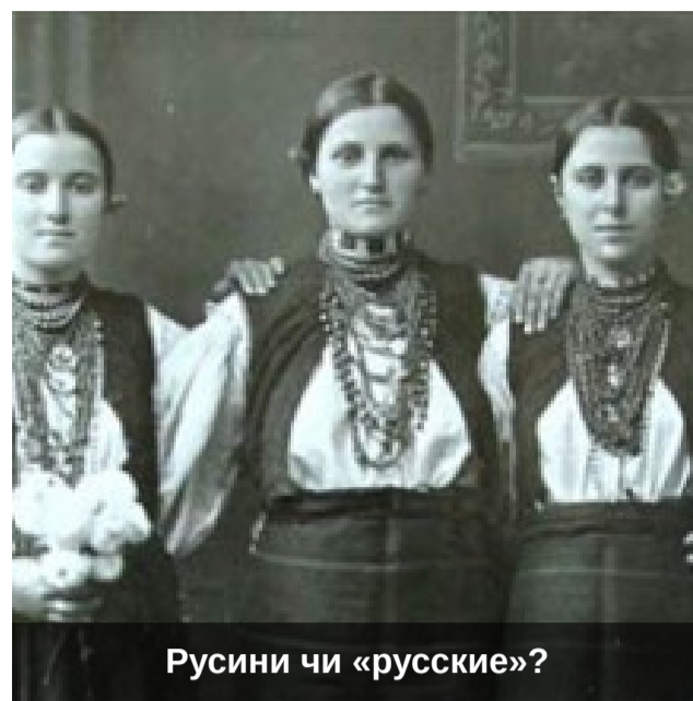
Русини чи «русские»?