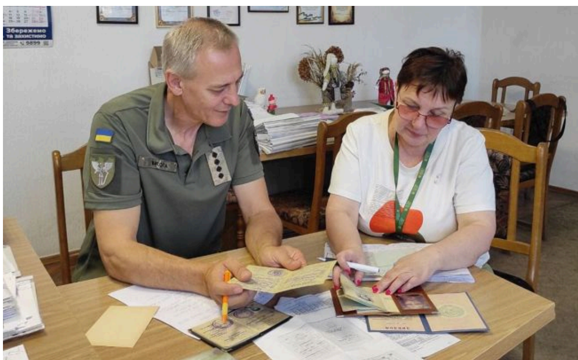
Фото: Оформлення пенсії в Україні (facebook.com/kagupfu)

Розбираємося в субсидіях та пенсіях за тебе! Підпишись на РБК-Україна у Google