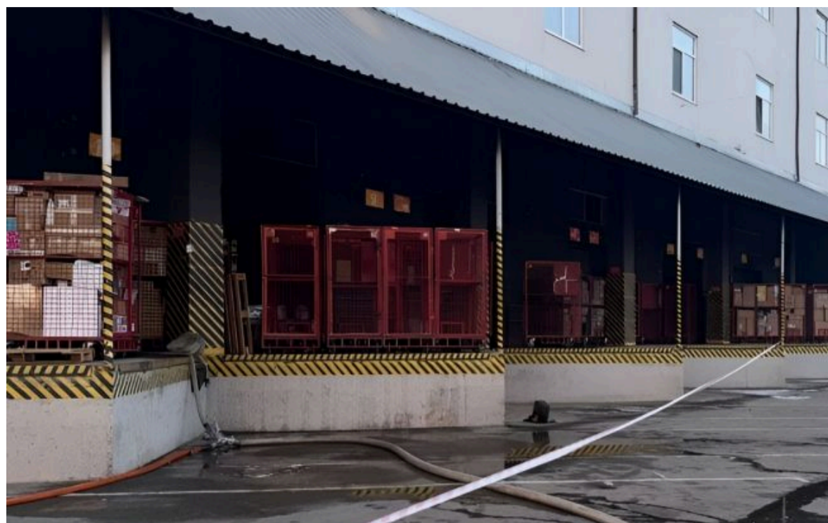
Фото: теракт у Києві стався на "Новій пошті"