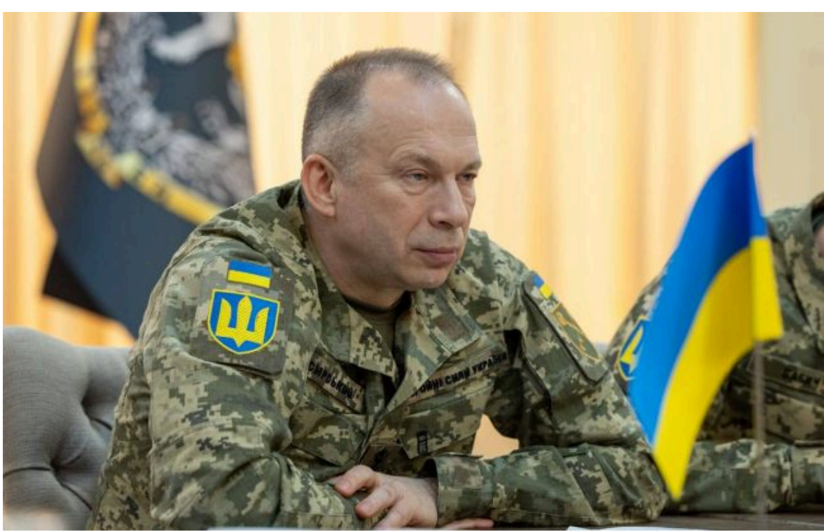
Фото: Олександр Сирський, головнокомандувач ЗСУ (facebook.com/CinCFAofUkraine)