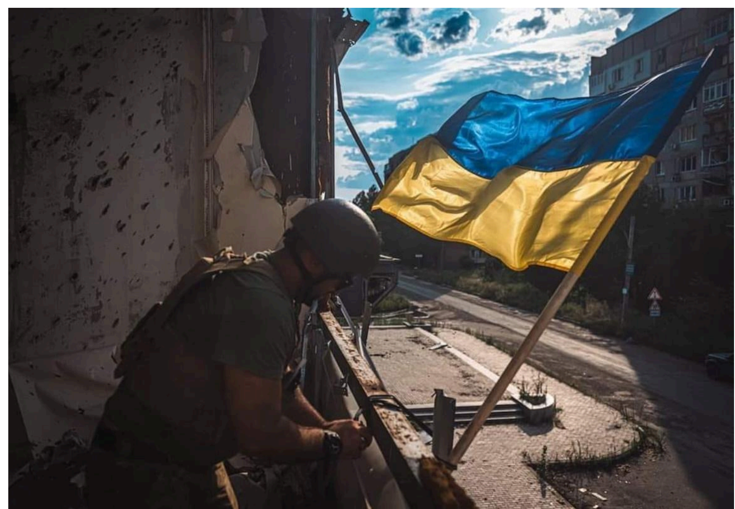
Нова виграшна стратегія України наближає закінчення війни

Припинення вогню в Україні не призведе до демобілізації російської армії, воно дозволить звільнити колишніх ув'язнених.