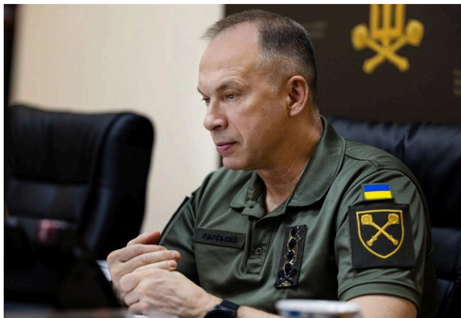
Сирський розповів про успіхи Сил оборони на фронті

Ситуація на полі бою залишається складною і динамічною.